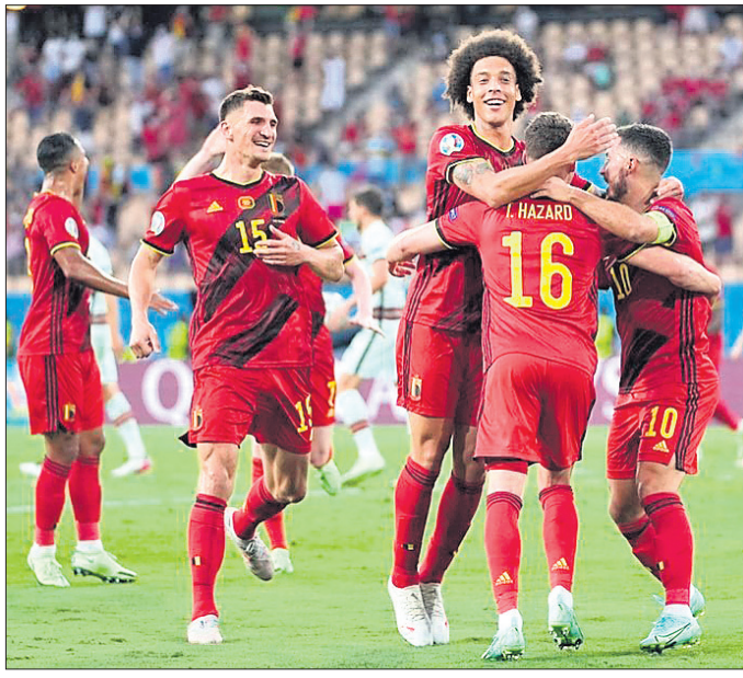
ବିଜୟ ହାସଲ ପରେ ଉଲ୍ଲସିତ ବେଲଜିୟମ ଖେଳାଳି

ସ୍ପାନିଶ ଲେଖକ ଡେଲିଆ ଲୋପେଜ୍ କିଲିଆନ ପୁଲିଟ୍ସର ପୁସ୍ତକ 'ସ୍ପାନିଶ ଲେଖକ'ର ପ୍ରଥମ ପଞ୍ଚମାଠା ପୁସ୍ତକ ସମ୍ବନ୍ଧରେ ଲେଖିଛନ୍ତି।