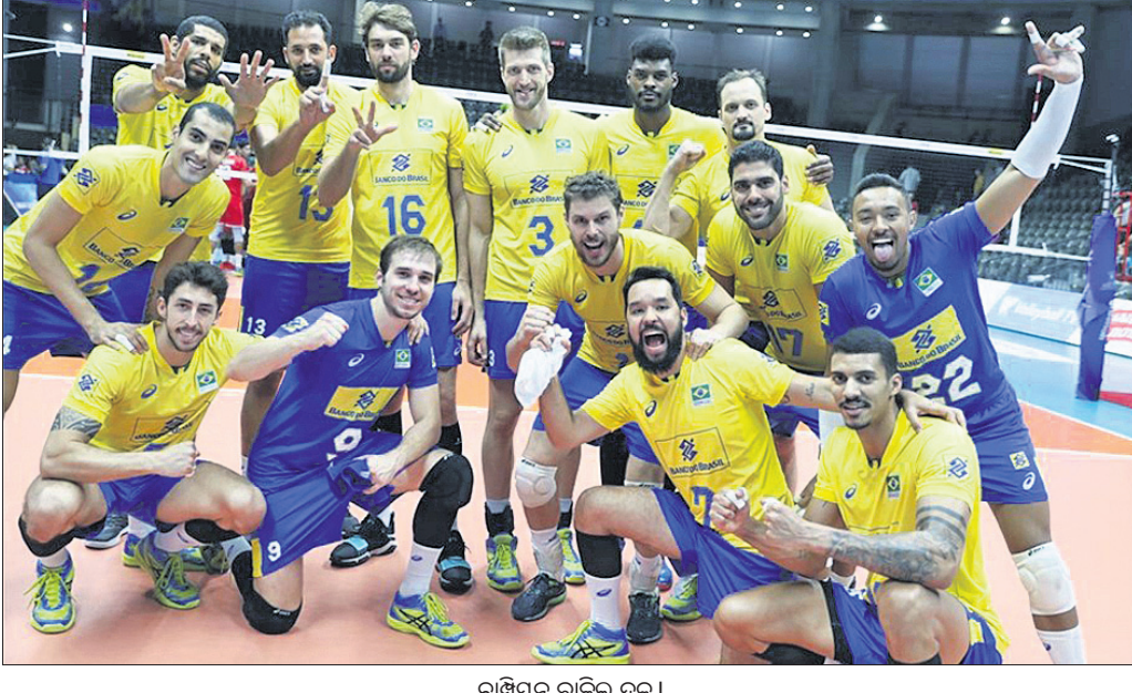
ଚାମ୍ପିୟନ ବ୍ରାଜିଲ ଦଳ

ଭଲିବଲ ନେସନ୍ସ ଲିଗ୍ ଟୁର୍ଣ୍ଣାମେଣ୍ଟରେ ବ୍ରାଜିଲ ଟୀମ୍ ଚାମ୍ପିୟନ ହୋଇଛି।