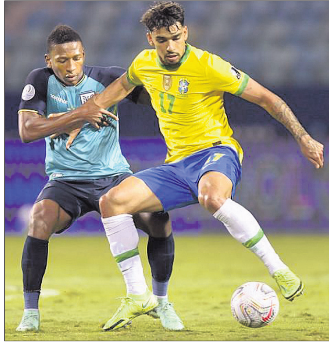
ବ୍ରାଜିଲ ଓ ଇକ୍ୱେଡର ମଧ୍ୟରେ ଅନୁଷ୍ଠିତ ମ୍ୟାଚ

ପୂର୍ବରୁ ଯଥେଷ୍ଟ ଆଗରେ ରହିଥିଲା। ବେଲଜିୟମ ଖେଳାଳି ଶ୍ରୀ ଶର୍ମିଷ୍ଠା ପୋଷ୍ଟ ଉପରକୁ ମାରିଥିଲେ ଓ ଗୋଟିଏ ଗୋଲ ସମ୍ପର୍କ ହୋଇଥିଲା।