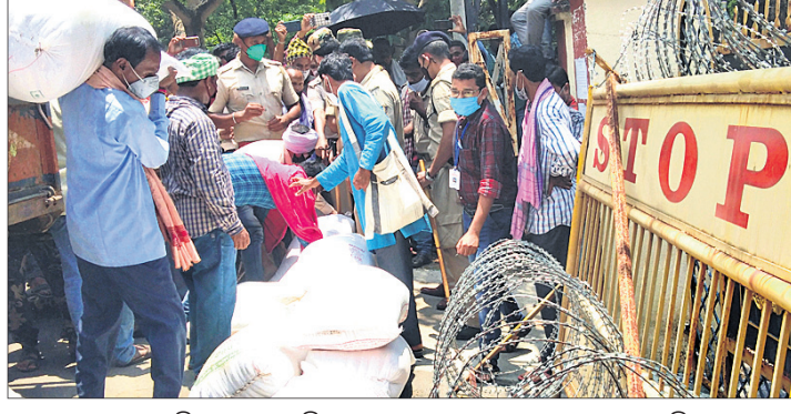
ବରଗଡ଼ ଜିଲ୍ଲାପାଳଙ୍କ ଅଫିସ୍ ଆଗରେ ଚାଷୀମାନେ ଧାନ ଗଦା କରୁଛନ୍ତି।

ବରଗଡ଼ ଜିଲ୍ଲାରେ ରବିଧାନ ଜିଣାବିକା ଅବ୍ୟବସ୍ଥା ଚରମ ସ୍ଥିତିରେ ପହଞ୍ଚିଛି। ଖରିଫ ଚାଷକାରୀମାନେ ଆରମ୍ଭ ହୋଇଥିବାବେଳେ ଧାନ ଗଦା ହେବାରେ ଲାଗିଛି।