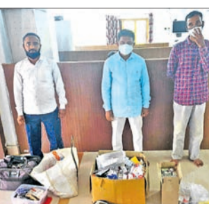
ଗିରଫ ନକଲି ଡାକ୍ତରମାନେ।

ଗ୍ରାମାଞ୍ଚଳରେ ଲୋକଙ୍କୁ ଡାକ୍ତର ଘରରେ ଭେଦ ଚଳୁଥିଲେ