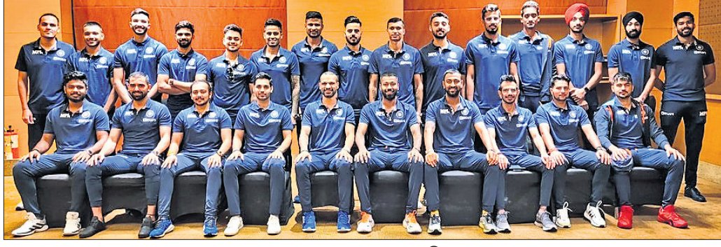
ଶ୍ରୀଲଙ୍କା ଗସ୍ତରେ ଯାଇଥିବା ଭାରତୀୟ କ୍ରିକେଟ ଦଳ

ଲଙ୍କା ଟିକେଟ ବିପକ୍ଷ ତୃତୀୟ ତଥା ଅନ୍ତିମ ଅନ୍ତର୍ଜାତୀୟ ଟି୨୦ ମ୍ୟାଚ ପରେ ତରହାମ୍ ରାସ୍ତାରେ ଏହି ଦୁଇ ଖେଳାଳି ଭ୍ରମଣ କରୁଥିବା ଦେଖାଯାଇଥିଲା।