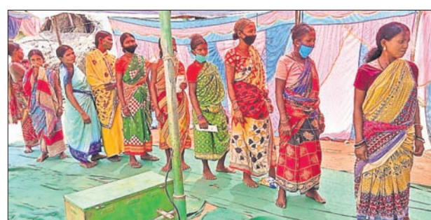
ଟିକାନେବାକୁ ମହକାମାନେ ଧାଡ଼ିରେ ଆସୁଛନ୍ତି।

କେତେଜଣ ସ୍ତ୍ରୀମାନେ ସଂଘା ଓ ପ୍ରଶାସନିକ ଅଧିକାରୀ ମାତ୍ର ୧୬୧ ଜଣଙ୍କୁ ଟିକାକରଣ କରାଇଥିଲେ।