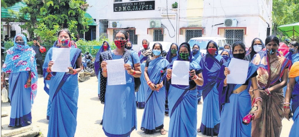
ଜିଲ୍ଲା ମୁଖ୍ୟ ଚିକିତ୍ସାଧିକାରୀଙ୍କୁ ଦାବିପତ୍ର ଦେବାକୁ ଆସିଥିବା ଆଶାକର୍ମୀ।