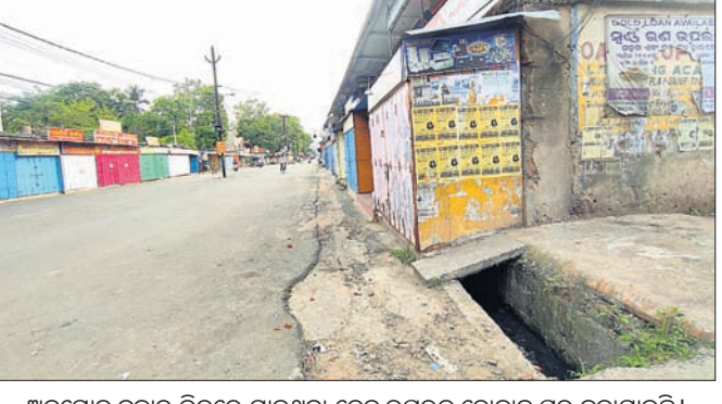
ଅନୁଗୋଳ ବଜାର ଭିତରେ ଯାଇଥିବା ଡ୍ରେନ୍ ଉପରକୁ ଦୋକାନ ଘର ବଢ଼ାଯାଇଛି।

ଅନୁଗୋଳ ଅର୍ଥସ, ୨୮।୬ ଅନୁଗୋଳ ପୌରାଞ୍ଚଳରେ ୨ ହଜାରରୁ ଅଧିକ ଦୋକାନ ରହିଛି। କେବଳ ପୌରପାଳିକାର ନିଜସ୍ୱ ବୃଦ୍ଧି ପାଇଁ ବ୍ୟବସାୟିକ ପ୍ରତିଷ୍ଠାନ। ପୌରାଞ୍ଚଳ ହୋଇଥିଲେ ବି ଏହା ଉପରେ ପୌରପାଳିକାର ସେପରି କର୍ତ୍ତୃତ୍ୱ ଥିବା ଭଳି ଲାଗୁନାହିଁ। କାରଣ ଡ୍ରେନ୍, ରାସ୍ତା ଆଦି ସରକାରୀ ଜାଗାକୁ ନେଇ ଅନେକ ବ୍ୟବସାୟୀ ଦୋକାନ ସମ୍ପ୍ରସାରଣ କରିଛନ୍ତି। ଫଳରେ କେଉଁଠି କେଉଁଠି ବର୍ଷା ଜଳ ନିଷ୍କାସନ ପଥ ଅବରୋଧ ହୋଇଛି। ସବୁଠୁ ଗୁରୁତ୍ୱପୂର୍ଣ୍ଣ କଥା, ଏହି ଜବରଦଖଲକାରୀ ବ୍ୟବସାୟୀଙ୍କ ମଧ୍ୟରୁ ଅନେକେ ପୌରପାଳିକାର ନିଜସ୍ୱ ଦୋକାନ ଘର ଭଡ଼ାରେ ନେଇଛନ୍ତି। ହେଲେ ଏମାନଙ୍କ ବିରୋଧରେ ପୌର କର୍ତ୍ତୃପକ୍ଷ କାର୍ଯ୍ୟାନୁଷ୍ଠାନ ଗ୍ରହଣରେ ଆଗ୍ରହ କରୁନାହାନ୍ତି। ଡ୍ରେନ୍ ସହ ଅନ୍ୟ ଜଳ ନିଷ୍କାସନ ପଥ ଜବରଦଖଲ ହେବୁ ବର୍ଷା ପାଣି ସହରରୁ ବାହାରି ପାଣି ମଧ୍ୟରେ ଅସନ୍ତୋଷ ପ୍ରକାଶ ପାଇଛି।