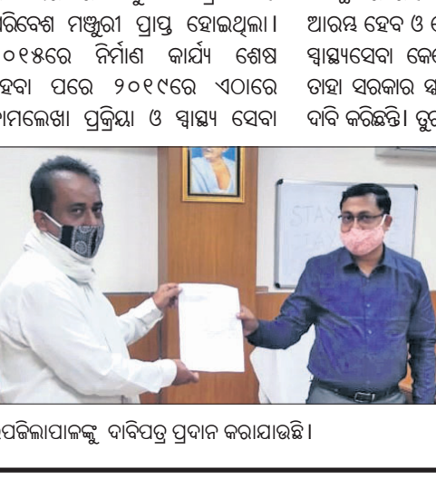
ଉପଜିଲ୍ଲାପାଳଙ୍କୁ ଦାବିପତ୍ର ପ୍ରଦାନ କରାଯାଇଛି।