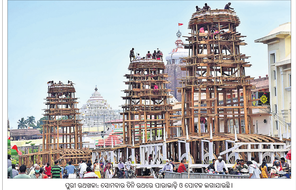
ପୁରୀ ରଥଖଳା: ସୋମବାର ତିନି ରଥରେ ପାରାଭାଡ଼ି ଓ ପୋଟଳ ଲଗାଯାଇଛି।

ହେଲିଥରେ ଅତିରିକ୍ତ ୨୩ ହଜାର କୋଟି ଟଙ୍କା ଖର୍ଚ୍ଚ ହେବ। ଆଗାମୀ ଚୋଟିଏ ବର୍ଷରେ ସ୍ୱଳ୍ପ ନିଆଯାଉ ଉକ୍ତ ଶିଶୁ ଯତ୍ନ ଏବଂ ଶିଶୁ ବିଭାଗ ବେଦ୍ ସ୍ଥାପନରେ ଏକ ଟଙ୍କା ଖର୍ଚ୍ଚ ଯୋଜନା ରଖାଯାଇଛି।