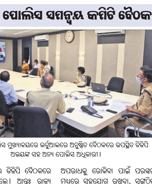
କଟକସ୍ଥିତ ପୋଲିସ ମୁଖ୍ୟାଳୟରେ ଭର୍ଚୁଆଲରେ ଅନୁଷ୍ଠିତ ବୈଠକରେ ଉପସ୍ଥିତ ଡିପିଏ ଅଭିଭାବକ ସହ ଅନ୍ୟ ପୋଲିସ ଅଧିକାରୀ।

କଟକ ଅଫିସ, ୨୯।୬ ଓଡ଼ିଶା, ପଶ୍ଚିମବଙ୍ଗ, ଝାଡ଼ଖଣ୍ଡ, ବିହାର ଓ ଛତିଶଗଡ଼ ରାଜ୍ୟକୁ ନେଇ ଗଠିତ ପୂର୍ବାଞ୍ଚଳ ପୋଲିସ ସମନ୍ୱୟ କମିଟିର ଏକ ଉଚ୍ଚସ୍ତରୀୟ ବୈଠକ ମଙ୍ଗଳବାର ଭର୍ଚୁଆଲରେ ଅନୁଷ୍ଠିତ ହୋଇଯାଇଛି।