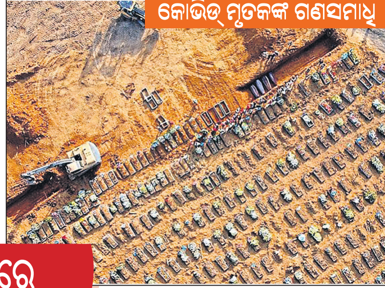
କୋଭିଡ଼ ମୃତକଙ୍କ ଗଣସମାଧି

ବ୍ରାଜିଲରେ କୋଭିଡ଼-୧୯ର ଭାରତୀୟ ଟିକା କୋଭାଇଡ଼ିନକୁ ନେଇ ଝଡ଼। ୪୫ ନିୟୁତ ଡୋଜର ଏକ ଚାଲି ଯାଉଥିବା ଆସିବା ପରେ ଭାଙ୍ଗି ଦିଆଯାଇ ବିବାଦରେ ପଡ଼ିଛି ରାଷ୍ଟ୍ରପତି ଜୈନ ବୋଲସୋନାରେ। ହାଇଡ୍ରୋକାର୍ବୋନାଟ୍ ବାୟୋଟେକ ପକ୍ଷରୁ ପ୍ରସ୍ତୁତ ୩୦ ଲକ୍ଷ ଡୋଜ କୋଭାଇଡ଼ିନ ପଠାଇବା ପାଇଁ ବିନାପୁରଣ ଏକ କମ୍ପାନୀ ସହ ବୁକ୍ସି ହୋଇଥିଲେ ହେଁ ଏଯାଏଁ ବ୍ରାଜିଲରେ ଟିକା ପହଞ୍ଚିନାହିଁ।