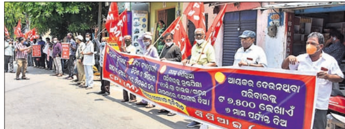
ଗାଟାବେଞ୍ଚି ଛକରେ ପ୍ରତିବାଦ

ବ୍ରହ୍ମପୁର ଅଫିସ୍/ଆସିକା/ପାରଳାଖେମୁଣ୍ଡି, (ଡି.ଏନ.ଏ.), ୨୯/୬: ସିପିଏମ୍ ଦଳ ବୃଦ୍ଧି ବିରୋଧ ଅଭିଯାନ ପଞ୍ଚମ ଦିନ ମଙ୍ଗଳବାର ଗାଟାବେଞ୍ଚି ଛକରେ ପ୍ରତିବାଦ କାର୍ଯ୍ୟକ୍ରମରେ ସିପିଏମ୍ ରାଜ୍ୟ ସମାଜକ ଅଭିଭାବକମାନଙ୍କ ଯୋଗଦେଇ କେନ୍ଦ୍ର ସରକାରଙ୍କ ଦଳ ବୃଦ୍ଧି ନୀତିକୁ ବିରୋଧ କରିଥିଲେ।