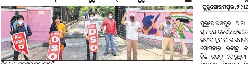
ବିକ୍ଷୋଭ ପ୍ରଦର୍ଶନ କରାଯାଇଛି।

ମାଟ୍ରିକ ପରୀକ୍ଷା ଫଳ ପ୍ରକାଶନ ବିକ୍ଷୋଭ ସମାଧାନ, ମୁକ୍ତ ୨ ପାଠ୍ୟକ୍ରମରେ ସିଡ଼ି ସଂଖ୍ୟା ବୃଦ୍ଧି ଦାବି କରି ମଙ୍ଗଳବାର ଅଲ୍ ଲକ୍ଷ୍ମୀଆ ଡିଏସ୍ ଓ ପକ୍ଷରୁ ଦକ୍ଷିଣାପଶ୍ଚିମ ରାଜ୍ୟ କମିଶନରଙ୍କୁ ଏକ ଦାବି ପତ୍ର ପ୍ରଦାନ କରାଯାଇଛି।