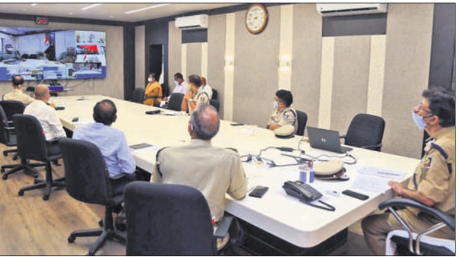
କଟକସ୍ଥିତ ପୋଲିସ ମୁଖ୍ୟାଳୟରେ ଭର୍ତ୍ତୀଆଇଲେ ଅନୁଷ୍ଠିତ ବୈଠକରେ ଉପସ୍ଥିତ ଡିପିଏ ଅଭ୍ୟନ୍ତର ସଭା ସହ ଅଧ୍ୟକ୍ଷ ଅଧିକାରୀ।

କେତେକ ରାଜ୍ୟର ଡିପିଏ ବୈଠକରେ ଅପରାଧକୁ ରୋକିବା ପାଇଁ ପରସ୍ପର ମତବ୍ୟକ୍ତ କରିଥିଲେ। ଆନ୍ଧ୍ର ରାଜ୍ୟ ମଧ୍ୟରେ ସହଯୋଗ ରଖିବା, ସଙ୍ଗଠିତ