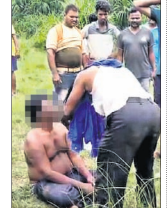
ଏନ୍. ଭେକ୍ଟରମାଣିଙ୍କ ଦାନ୍ତ ଭଙ୍ଗା ଯାଉଥିବାର ଦୃଶ୍ୟ।

ଭୁବନେଶ୍ୱର, ୨୯।୬(ବୁଧବେଳା) କରୋନା ଲଢ଼େଇରେ ରୁଷିଆ ପ୍ରସ୍ତୁତ 'ସୁରନିକ ଭି' ଚିକାକୁ ସାମିଲ କରାଯାଇଛି। ଓଡ଼ିଶାରେ ମଧ୍ୟ ଏହାର ଚିକାକରଣ ଆରମ୍ଭ ହୋଇଛି। ଭୁବନେଶ୍ୱରର ଏକ ଘରୋଇ ହସ୍ତିଚାଲରେ ମଙ୍ଗଳବାର ଏହି ଚିକାକରଣ କରାଯାଇଥିବାବେଳେ ପ୍ରଥମ ଦିନରେ ୭୦ଜଣ ଚିକା ନେଇଥିବା ଜଣାପଡ଼ିଛି। ଡ. ରେଭିନ୍ଦ୍ର ଲାବରଟୋରୀର କେତେଜଣ କର୍ମଚାରୀଙ୍କ ସମେତ ସାଧାରଣ ଲୋକ ମଧ୍ୟ ଏହି ଚିକା ନେଇଛନ୍ତି। ଏହି ଚିକାର ଗୋଟିଏ ଡୋଜର ଦାମ୍ ୧,୧୪୫ ଟଙ୍କା। ଯେଉଁମାନେ କୋଭିଡ଼ ଯୋଗିଲରେ ନାନ ପଞ୍ଜାକରଣ କରିଥିବେ ସେମାନେ ଏହି ଚିକା ପାଇପାରିବେ ବୋଲି ଜୁହାଯାଇଛି।