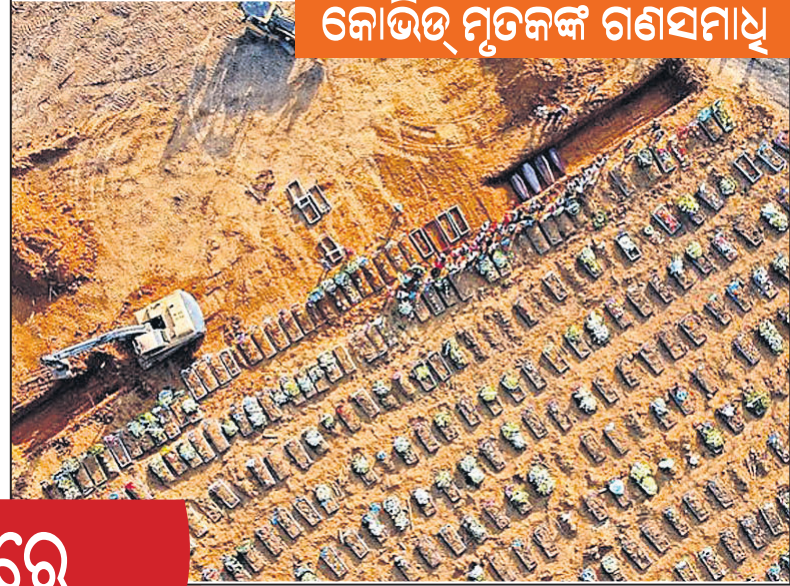
କୋଭିଡ଼ ମୃତକଙ୍କ ଗଣସମାଧି

ବ୍ରାଜିଲରେ କୋଭିଡ଼-୧୯ର ଭାରତୀୟ ଚିକିତ୍ସା କୋଭାକ୍ସିନକୁ ନେଇ ଝଡ଼। ୪୫ ନିୟୁତ ଡୋଜର ଏକ ଚାଲି ଥିବା ସମୟକୁ ଆସିବା ପରେ ଭାଜିନ ଡିଲିଭରୀରେ ପଡ଼ିବାର ସମ୍ଭାବନା ରହିଛି। କିନ୍ତୁ ବୋଲସୋନାରୋ ହାଇଡ୍ରୋକାର୍ବୋନେଟ୍ ଭାରତ ବାୟୋଟେକ ପକ୍ଷରୁ ପ୍ରସ୍ତୁତ ୩୦ ଲକ୍ଷ ଡୋଜ କୋଭାକ୍ସିନ ପଠାଇବା ପାଇଁ ବିନୀତ ହୋଇଥିଲେ ହେଁ ଏଯାବତ୍ ବ୍ରାଜିଲରେ ଚିକିତ୍ସା ପହଞ୍ଚିନାହିଁ।