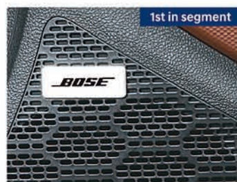
Bose premium sound system (8 speakers)