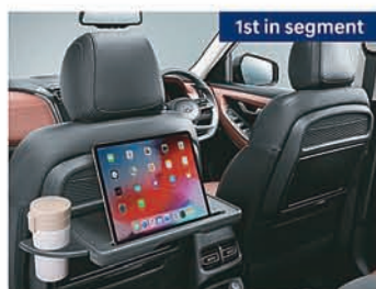
Front row seatback table with retractable cup-holder and IT device holder