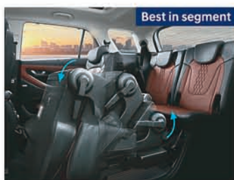
2 nd row - one touch tip tumble captain & split seats