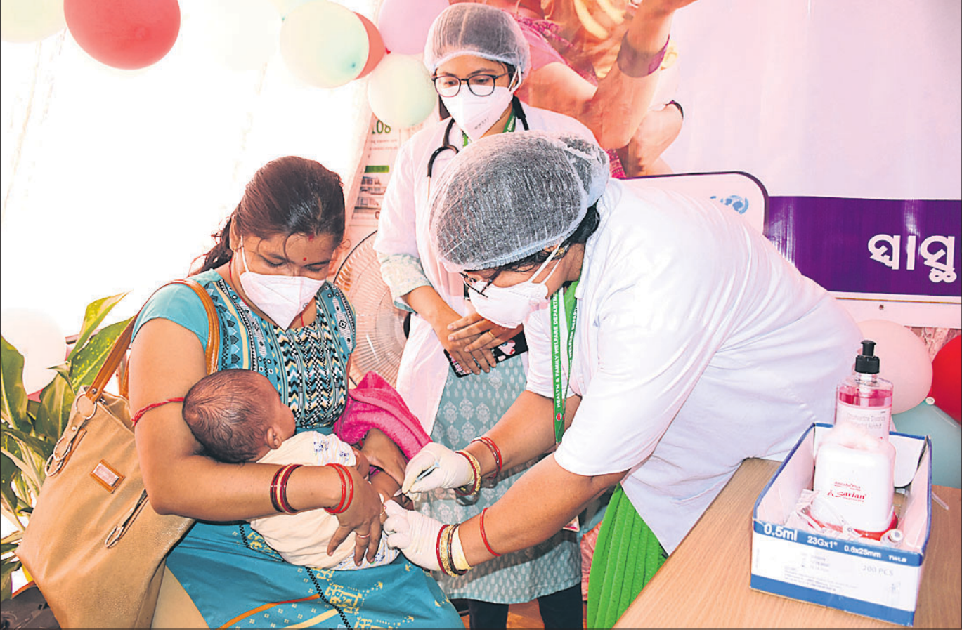
ଶିଶୁକୁ ନିମୋକୋକାଲ ନିମୋନିଆରୁ ସୁରକ୍ଷା ଦେବା ନିମନ୍ତେ ଭୁବନେଶ୍ୱର ମୁନିସ୍ - ୪ ସହରାଞ୍ଚଳ ଗୋଷ୍ଠୀ ସାମ୍ପ୍ରଦାୟରେ ରୁଧିରା ନିମୋକୋକାଲ କଣ୍ଟ୍ରୋଲ ଡାକ୍ତର (ପିସିଭି)ର ଶୁଭାରମ୍ଭ।