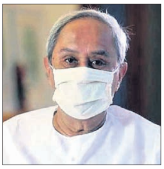
କୃଷି କ୍ଷେତ୍ରର ସମ୍ପର୍କିତ ପକ୍ଷରେ ରହିଛି ଭୂମିହୀନ ଚାଷୀର ଚ୍ୟାନ୍ସ: ଗୁମ୍ଫାମନ୍ତ୍ରୀ

କରିଥାଏ । କୃଷି କ୍ଷେତ୍ରର ସବୁ ସମ୍ପର୍କିତ ପକ୍ଷରେ ଭୂମିହୀନ ଚାଷୀଙ୍କ ଚ୍ୟାନ୍ସ ଓ ପରିସ୍ଥିତି ରହିଛି । ଆମେ ତା'ର ଚ୍ୟାନ୍ସକୁ ସମ୍ମାନ କରୁ । ତା'ର ସ୍ୱାର୍ଥର ପୁରଣ ପାଇଁ ଆମ ଲକ୍ଷ୍ୟ ଲାଗି ରହିଛି । ଏ.ଏ.ଏ. ସ୍ୱାମୀନାଥନ କମିଟିର ସୁପାରିସକୁ କାର୍ଯ୍ୟକାରୀ କରିବା ପାଇଁ ସବୁବେଳେ ଦାବି କରି ଆସିଛି । ଏହା ପୁରଣ ହେବା ପର୍ଯ୍ୟନ୍ତ ଲକ୍ଷ୍ୟ ଲାଗି ରହିବ ବୋଲି ଗୁମ୍ଫାମନ୍ତ୍ରୀ କହିଛନ୍ତି । ଚାଷୀ ହେଉଛନ୍ତି ଆମର ଗର୍ବ ଓ ଗୌରବ । ତେଣୁ ଚାଷୀ ସ୍ୱାର୍ଥର ପୁରଣ ସବୁବେଳେ ତାଙ୍କର ପ୍ରାଥମିକତା ହୋଇ ରହି ଆସିଛି । କାଳିଆ ଯୋଜନା ଯୋଗୁ ରାଜ୍ୟର ଲକ୍ଷ ଲକ୍ଷ ଚାଷୀ ପରିବାର ପୁଣିଥରେ ହସ ଫୁଟିଛି ଓ ମନରେ ଭରସା ଦେଇଛି । ଏଥିପାଇଁ କାଳିଆ ମୋର ସବୁଠାରୁ ପ୍ରିୟ ଯୋଜନା ବୋଲି ଗୁମ୍ଫାମନ୍ତ୍ରୀ କହିଛନ୍ତି । କୋଭିଡ଼ ଲକ୍ଷ୍ମରେ ବିକ୍ଷୟ ପାଇଁ ଚାଷୀମାନେ ସମସ୍ତେ ଚିକା ଦେବା