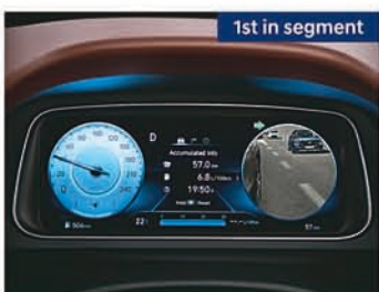
Blind view monitor