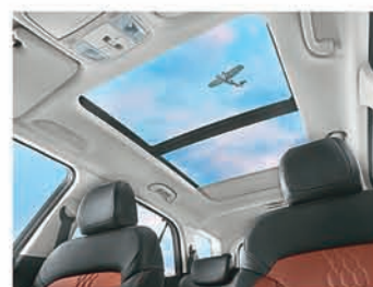
Voice enabled smart panoramic sunroof