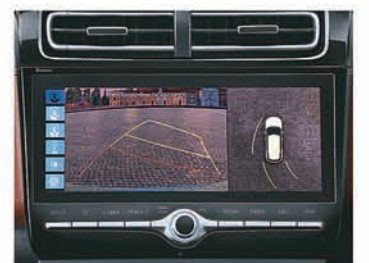
Surround view monitor with 360° camera

Powertrain options : 1.5 l diesel CRDi & 2.0 l petrol MPi with 6MT & 6AT Best in segment fuel economy for both diesel (20.4~ kmpl - MT) & petrol (14.5~ kmpl - MT)