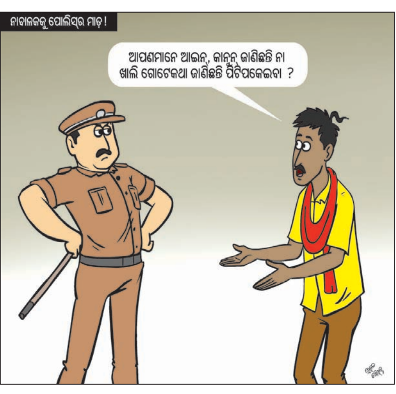
ନାବାଳକକୁ ପୋଲିସ ମାଡ଼!