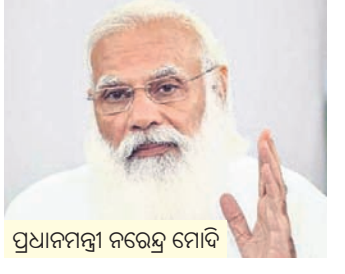
ପ୍ରଧାନମନ୍ତ୍ରୀ ନରେନ୍ଦ୍ର ମୋଦି

ନୂଆଦିଲ୍ଲୀ, ୧୨(ପି.ଟି.) କରୋନାକୁ ଜୀବନ ବଞ୍ଚାଇବାରେ ଡାକ୍ତରମାନଙ୍କ ଅବଦାନକୁ ପ୍ରଧାନମନ୍ତ୍ରୀ ନରେନ୍ଦ୍ର ମୋଦି ଉଚ୍ଚ ପ୍ରଶଂସା କରିଛନ୍ତି। ମହାମାରୀ ମୁକାବିଲା ପାଇଁ ସ୍ୱାସ୍ଥ୍ୟସେବା ଭିତ୍ତିକ୍ରିୟା ବିକାଶ ଉପରେ ସରକାର ସର୍ବାଧିକ ଗୁରୁତ୍ୱ ଦେଉଛନ୍ତି। ଲକ୍ଷ ଲକ୍ଷ ଲୋକଙ୍କ ଜୀବନ ରକ୍ଷା