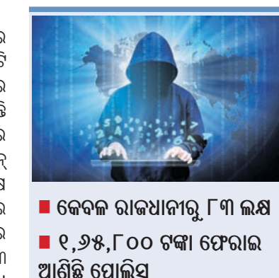
କେବଳ ରାଜଧାନୀରୁ ୮୩ ଲକ୍ଷ ୧୨,୬୫,୮୦୦ ଟଙ୍କା ଫେରାଇ ଆଣିଛି ପୋଲିସ

ଭୁବନେଶ୍ୱର, ୧୨ (ବୁଧବେଳା) ଲକ୍ଷ୍ମୀନଗର ସମୟରେ ପ୍ରତିମାସରେ ସାଇବର ଠକମାନେ ରାଜ୍ୟକୁ ବହୁ କୋଟି ଟଙ୍କା ଲୁଚିନେଉଛନ୍ତି। ଲୁଚିନେ ଶିକାର ଲୋକଙ୍କ ମଧ୍ୟରୁ ଅଧିକାଂଶ ହେଉଛନ୍ତି ରାଜଧାନୀବାସୀ। ଭୁବନେଶ୍ୱର ସାଇବର ସେଲର ରିପୋର୍ଟ ଅନୁଯାୟୀ, କେବଳ ଭୁବନେଶ୍ୱର ସମୟରେ ୧ କୋଟି ୫୩ଲକ୍ଷ ୨୯ ହଜାର ଟଙ୍କାର ସାଇବର ଠକେଇ ଅଭିଯୋଗ ଆସିଛି। ଏଥିମଧ୍ୟରୁ ସାଇବର ଠକମାନେ କେବଳ ଭୁବନେଶ୍ୱର ୮୩ ଲକ୍ଷ ୮ହଜାର ୬୬୨ ଟଙ୍କା ଠକି ନେଇଛନ୍ତି। ଠକେଇ ନେଇ ମୋଟ ୪୬୩୩ କଲ୍ ସାଇବର ସେଲକୁ ଆସିଥିବାବେଳେ ଭୁବନେଶ୍ୱରକୁ ୨୨୯୯୯୯ କଲ୍ ରହିଛି। ବିଶେଷକରି ଯୁପିଆଇ ମାଧ୍ୟମରେ ସାଇବର ଅପରାଧମାନେ ଅଧିକ ଠକେଇ କରିଛନ୍ତି, ଯେଉଁଥିରେ ଭୁବନେଶ୍ୱରକୁ ୯୩ ଠକେଇ ହୋଇଛି। ସେହିପରି କ୍ରେଡିଟ୍, ଡେବିଡ୍ କାର୍ଡ୍ ଓ ଉପହାର ପ୍ରଲୋଭନ ବେଖାଇ ୭୭ ଠକେଇ ହୋଇଛି। ଏ ନେଇ ସାଇବର ସେଲରେ ୧୪ ମାମଲା ପଞ୍ଜୀକୃତ ହୋଇଥିବାବେଳେ ସାଇବର