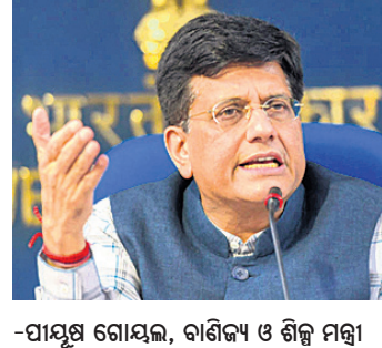
-ପାୟୁଷ ଗୋୟଲ, ବାଣିଜ୍ୟ ଓ ଶିଳ୍ପ ମନ୍ତ୍ରୀ

୨-୪ ବର୍ଷ ତଳେ ମୋଦି ସରକାରଙ୍କ ମନ୍ତ୍ରୀମାନେ ଇ-କମର୍ସ କମ୍ପାନୀଗୁଡ଼ିକୁ ଭାରତରେ ଥିବା ଛୋଟ ଛୋଟ କମ୍ପାନୀର ଗ୍ରାଣକର୍ତ୍ତା ବୋଲି ଅଭିଯୋଗ କରୁଥିଲେ। ସେମାନେ ଆସିଲେ ଦେଶର ଅନେକ ଛୋଟ କମ୍ପାନୀ ଉପରକୁ ଉଠିବେ ଏବଂ ଗ୍ରାହକଙ୍କୁ ମନପସନ୍ଦର ସାମଗ୍ରୀ ମିଳିବ ବୋଲି ଯୁକ୍ତି ବାଦ୍ତି ସ୍ୱାଗତ କରୁଥିଲେ। ଏହାସହ ସମ୍ପୂର୍ଣ୍ଣ କମ୍ପାନୀର ମାଲିକ ଓ ବନ୍ଧୁ ଅଧିକାରୀମାନଙ୍କ ସହ ଫଟୋ ଉଠାଉଥିଲେ। ସେମାନେ ତାଙ୍କିଆଣ୍ଡିଆ କମ୍ପାନୀଗୁଡ଼ିକୁ ବ୍ୟବସାୟର ପରିବର୍ତ୍ତନ କାରଣରୁ ଉଭୟ ଇ-କମର୍ସ ଓ ଭାରତୀୟ କମ୍ପାନୀ କ୍ଷତିଗ୍ରସ୍ତ ହେଉଛନ୍ତି। ତେଣୁ ଥରେ ସବୁ ପକ୍ଷଙ୍କ ସୁଧାଧିକାରୀ ଦେଖି ଏକପ୍ରକାର ବ୍ୟାଧିକାର ଦେଇଥିଲେ। ଏବେ ସରକାରଙ୍କ ଆଖିରେ ସେହି