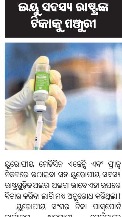
ଇୟୁ ସଦସ୍ୟ ରାଷ୍ଟ୍ର ଟିକାକୁ ମଞ୍ଜୁରୀ

ନୂଆଦିଲ୍ଲୀ, ୧୨ କୋଭିଡ଼ ଟିକା ପାଇଁ 'ଗ୍ରୀନ୍ ପାସ୍'କୁ ନେଇ ଭାରତ ଓ ଯୁରୋପୀୟ ସଂଘ (ଇୟୁ) ମଧ୍ୟରେ ବିବାଦ ଲାଗି ରହିଥିବାବେଳେ ଏ ଯୁରୋପୀୟ ଦେଶ ସିରମ୍ ଇନଷ୍ଟିଚ୍ୟୁଟ୍ ଅଫ ଇଣ୍ଡିଆ (ଏସ୍ଆଇଆଇ)ର କୋଭିଡ଼ ଟିକାକୁ ସେମାନଙ୍କର ଅନୁମୋଦିତ ଭାବେ ଚାଲିକାରେ ସାମିଲ କରିଛନ୍ତି। କୋଭିଡ଼ ଟିକା ପ୍ରଦାନ କରିଥିବା ଇୟୁ ସଦସ୍ୟ ରାଷ୍ଟ୍ର ମଧ୍ୟରେ କର୍ମାନ୍ତା, ଗ୍ଲୋଭେନିଆ, ଅଷ୍ଟ୍ରିଆ, ଗ୍ରୀସ୍, ଆଇର୍ଲାଣ୍ଡ, ଇଷ୍ପେନିଆ ଏବଂ ସ୍ୱେଡିନ୍ ରହିଥିବାବେଳେ ଅଣସଦସ୍ୟ ରାଷ୍ଟ୍ର ଆଇସ୍ଲାଣ୍ଡ ଏବଂ ସୁଇଜରଲ୍ୟାଣ୍ଡ ମଧ୍ୟ ଉକ୍ତ ଟିକାକୁ ଅନୁମୋଦନ କରିଛନ୍ତି। ଫଳରେ ଉକ୍ତ ଟିକା ନେଇଥିବା ବ୍ୟକ୍ତିଙ୍କୁ ଏହିସବୁ ଦେଶକୁ ଯିବାରେ କୌଣସି ଭ୍ରମଣ କଟକଣା ରହିବ ନାହିଁ। ଯୁରୋପୀୟ ସଂଘ ଭାରତୀୟ ଟିକା କୋଭାକ୍ସିନ୍ ଓ କୋଭିଡ଼ିନ୍ ଟିକାକୁ ନ ଦେଲେ ଭାରତ ମଧ୍ୟ ଇୟୁର ଡିଜିଟାଲ କୋଭିଡ଼ ସାର୍ଟିଫିକେଟକୁ ସ୍ୱୀକୃତି ଦେବ ନାହିଁ ବୋଲି ବୁଧବାର ଘୋଷଣା କରିଦେଇଥିଲା। ନୂଆଦିଲ୍ଲୀ ଏହି ପ୍ରସଙ୍ଗକୁ