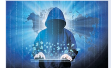
କେବଳ ରାଜଧାନୀରୁ ୮୩ ଲକ୍ଷ ୧୨.୬୫,୮୦୦ ଟଙ୍କା ଫେରାଇ ଆଣିଛନ୍ତି ପୋଲିସ

ଲକ୍ଷ୍ମୀନର ସମୟରେ ପ୍ରତିମାସରେ ସାଧାରଣ ଠକାମାନେ ରାଜ୍ୟରୁ ବହୁ କୋଟି ଟଙ୍କା ଲୁଟିନେଉଛନ୍ତି। ଲୁଟିନେ ଶିକାର ଲୋକଙ୍କ ମଧ୍ୟରୁ ଅଧିକାଂଶ ହେଉଛନ୍ତି ରାଜଧାନୀବାସୀ।