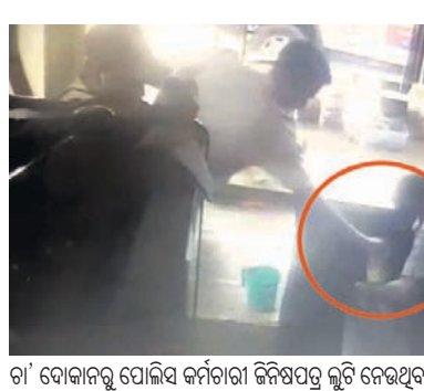
ଚା' ଦୋକାନରୁ ପୋଲିସ କର୍ମଚାରୀ ଜିନିଷପତ୍ର ଲୁଟି ନେଇଥିବା ଭିଡିଓ ପୁରୁଷା

ଭୁବନେଶ୍ୱର, ୧୬(ବୁଧବେଳା) ଲକ୍ଷ୍ମୀନର ସମୟରେ ଚା' ଦୋକାନ ଖୋଲିଥିବା ଜଣେ ନାବାଳକଙ୍କୁ ଗୋଇଠା ମାରିବା ପୋଲିସ ପାଇଁ ମହଙ୍ଗା ପଡ଼ିଛି।