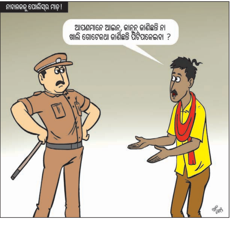
ନାବାଳକକୁ ପୋଲିସ ମାଡ଼!

କନ୍ୟାପୁର, ୧୬(ବି.ପି.): ବେଆଇନ ଭାବେ ବେଶୀ ବନ୍ଦୁକ ରଖିଥିବା ଅଭିଯୋଗରେ କନ୍ୟାପୁର ଚାରନ ଥାନା ପୋଲିସ ଗୁରୁବାର ୨ ଜଣଙ୍କୁ ଚିରଫ କରିଛି।