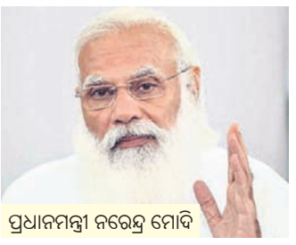
ପ୍ରଧାନମନ୍ତ୍ରୀ ନରେନ୍ଦ୍ର ମୋଦି

ନୂଆଦିଲ୍ଲୀ, ୧୨ (ପି.ଟି.) କରୋନାକୁ ଜୀବନ ବଞ୍ଚାଇବାରେ ଡାକ୍ତରମାନଙ୍କ ଅବଦାନକୁ ପ୍ରଧାନମନ୍ତ୍ରୀ ନରେନ୍ଦ୍ର ମୋଦି ଉଚ୍ଚ ପ୍ରଶଂସା କରିଛନ୍ତି। ମହାମାରୀ ମୁକାବିଲା ପାଇଁ ସ୍ୱାସ୍ଥ୍ୟସେବା ଭିତ୍ତିକ୍ତର ବିକାଶ ଉପରେ ସରକାର ସର୍ବାଧିକ ଗୁରୁତ୍ୱ ଦେଉଛନ୍ତି। ଲକ୍ଷ ଲକ୍ଷ ଲୋକଙ୍କ ଜୀବନ ରକ୍ଷା