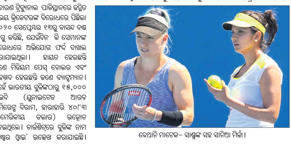
ବେଥାନି ମାଟେକ- ସାଣ୍ଡୁକ ସହ ସାନିଆ ମିର୍ଲା