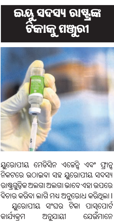
ଇୟୁ ସଦସ୍ୟ ରାଷ୍ଟ୍ରୀୟ ଚିକାକୁ ମଞ୍ଜୁରୀ

ନୂଆଦିଲ୍ଲୀ, ୧୬ କୋଭିଡ଼ ଚିକା ପାଇଁ 'ଗ୍ରୀନ୍ ପାସ୍'କୁ ନେଇ ଭାରତ ଓ ଯୁରୋପୀୟ ସଂଘ (ଇୟୁ) ମଧ୍ୟରେ ବିବାଦ ଲାଗି ରହିଥିବାବେଳେ ଏ ଯୁରୋପୀୟ ଦେଶ ସିରମ୍ ଇନଷ୍ଟିଚ୍ୟୁଟ୍ ଅଫ ଇଣ୍ଡିଆ (ଏସ୍ଆଇଆ)ର କୋଭିଡ଼ ଚିକାକୁ ସେମାନଙ୍କର ଅନୁମୋଦିତ ଭାବେ ଗ୍ରହଣ କରିଛନ୍ତି।