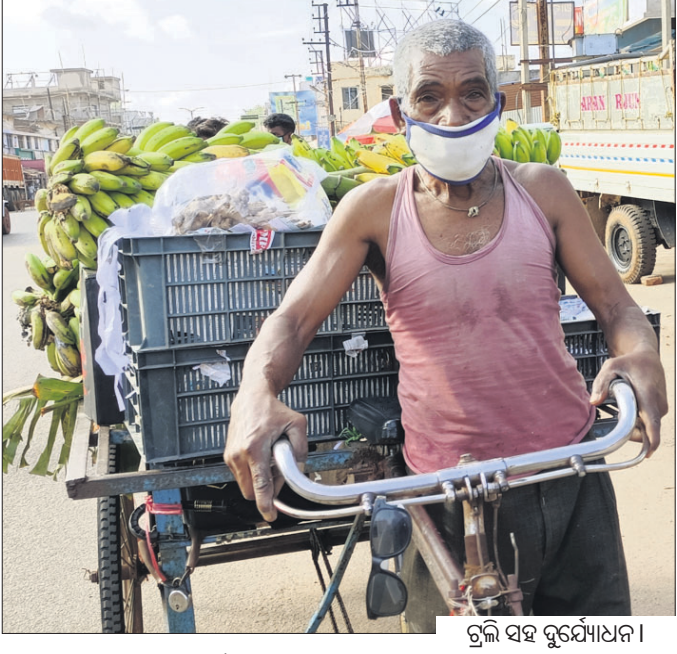
ଟ୍ରଲି ସହ ଦୁର୍ଯ୍ୟୋଧନ । ନ ଖଟିଲେ ଟଙ୍କା କେଉଁଠୁ ମିଳିବ । ତେବେ ଭରା ଟଙ୍କା ମିଳିଲେ କାମରୁ ଚିତ୍କ ବିଶ୍ରାମ ନେବା ପାଇଁ ଭାବୁଛନ୍ତି ବୋଲି ସେ କହିଛନ୍ତି । ସରକାର ବାର୍ଦ୍ଧକ୍ୟ

ଅଫିସରେ ୮ ବର୍ଷ ଧରି ପିଅନ ଚାକିରି କରିଥିଲେ । ସେ ସମୟରେ ବିଭିନ୍ନ ଗେରୁଟର ଟ୍ରାକ୍ଟରକୁ ଚଳୁଥିଲେ । ସେତେବେଳେ ୭୫ ଟଙ୍କା ଦରମା ପାଉଥିଲେ ବି ଖୁସିରେ ଚଳୁଥିଲେ । ତାଙ୍କର ବିବାହ ହେବା ପରେ ଦୂରକୁ ବଦଳି କରିଦେବାକୁ ସେ ଚାକିରି ଛାଡ଼ି ଦେଇଥିଲେ । ବର୍ଷେ ଦୁଇବର୍ଷ ଏଣେତେଣେ ବୁଲିବା ପରେ ଚିକ୍କା ଚଳାଇ ପରିସାର ପ୍ରତିପୋଷଣ କରୁଥିଲେ । ୩ ଡିଅକ୍ ବିବାହ କରାଇ ଦେଇଛନ୍ତି । ସାନ ଡିଅ ବିବାହ ପରେ ସ୍ତ୍ରୀଙ୍କ ଦେହାନ୍ତ ହୋଇଥିଲା । ତା'ପରୁ ଘରେ ଏକୁଟିଆ ରହୁଛନ୍ତି । ରାଶନ ସାମଗ୍ରୀ ପାଇଛନ୍ତି । କିନ୍ତୁ ସେ କହିଛନ୍ତି, ରାଶନ ସାମଗ୍ରୀ ପାଇଁ କିଛି ସେଥିରେ କ'ଣ ଖାଇ ଚଳିହେବ । ଏଣୁ ଘରେ ବସିବା ବଦଳରେ କିଛି ରୋଜଗାର କରିବା ପାଇଁ ଟ୍ରଲି ଚଳାଇଛନ୍ତି । ତେବେ ଅପ୍ୟାୟ ଭରା ମିଳି ନ ଥିବାରୁ ସେ ଦୁଃଖ ପ୍ରକାଶ କରିଛନ୍ତି । କଷ୍ଟ ଲାଗୁଛି ଖରା, ବର୍ଷାରେ କାମ କରିବାକୁ ପଡୁଛି ।