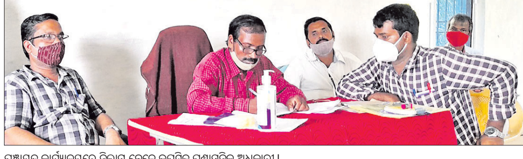
ପଞ୍ଚାୟତ କାର୍ଯ୍ୟାଳୟରେ ନିଲାମ ବେଳେ ଉପସ୍ଥିତ ପ୍ରଶାସନିକ ଅଧିକାରୀ । ରୁପସା, ୧୬ (ଡି.ଏନ.ଏ.)

ବାଲେଶ୍ଵର ଜିଲା ବସ୍ତା ବ୍ଲକ୍ ଅଧୀନ ରାଉତପଡ଼ା ପଞ୍ଚାୟତର ପ୍ରସିଦ୍ଧ ବିଦ୍ୟାଧର ପୋଖରୀକୁ ଗୁରୁବାର ନିଲାମ କରାଯାଇଛି । ୧୦ ବର୍ଷ ପରେ ଏହି ନିଲାମ ହୋଇଥିବାରୁ ସାଧାରଣରେ ଆଶ୍ଚର୍ଯ୍ୟ ଦେଇଛି । ପଞ୍ଚାୟତ କାର୍ଯ୍ୟାଳୟରେ ୩ ବର୍ଷ ପାଇଁ ୧୭ ଏକର ବିଶିଷ୍ଟ ଏହି ପୋଖରୀକୁ ନିଲାମ ପାଇଁ ସରକାରୀ ରାଶି ୧୦,୭୪,୭୦୦ ଟଙ୍କା ଧାର୍ଯ୍ୟ ରହିଥିଲା । ଏବିଡିଓ ଅକ୍ସ କୁମାର