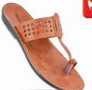
ART No. WG5327 MRP ₹ 289.00*