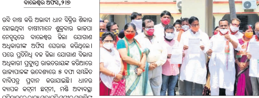
ଜିଲ୍ଲା ଯୋଗାଣ ଅଧିକାରୀଙ୍କ ଅଫିସ୍ ସମ୍ମୁଖରେ ଭାଙ୍ଗି ନେତୃତ୍ୱରେ ଘେରାଉ କରାଯାଇଥିଲା।