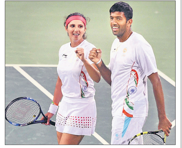
ସାନିଆ ମିର୍ଜା ଓ ରୋହନ ବୋପାଳା