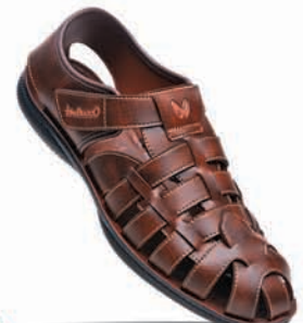
ART No. WG5713 MRP ₹ 489.00*