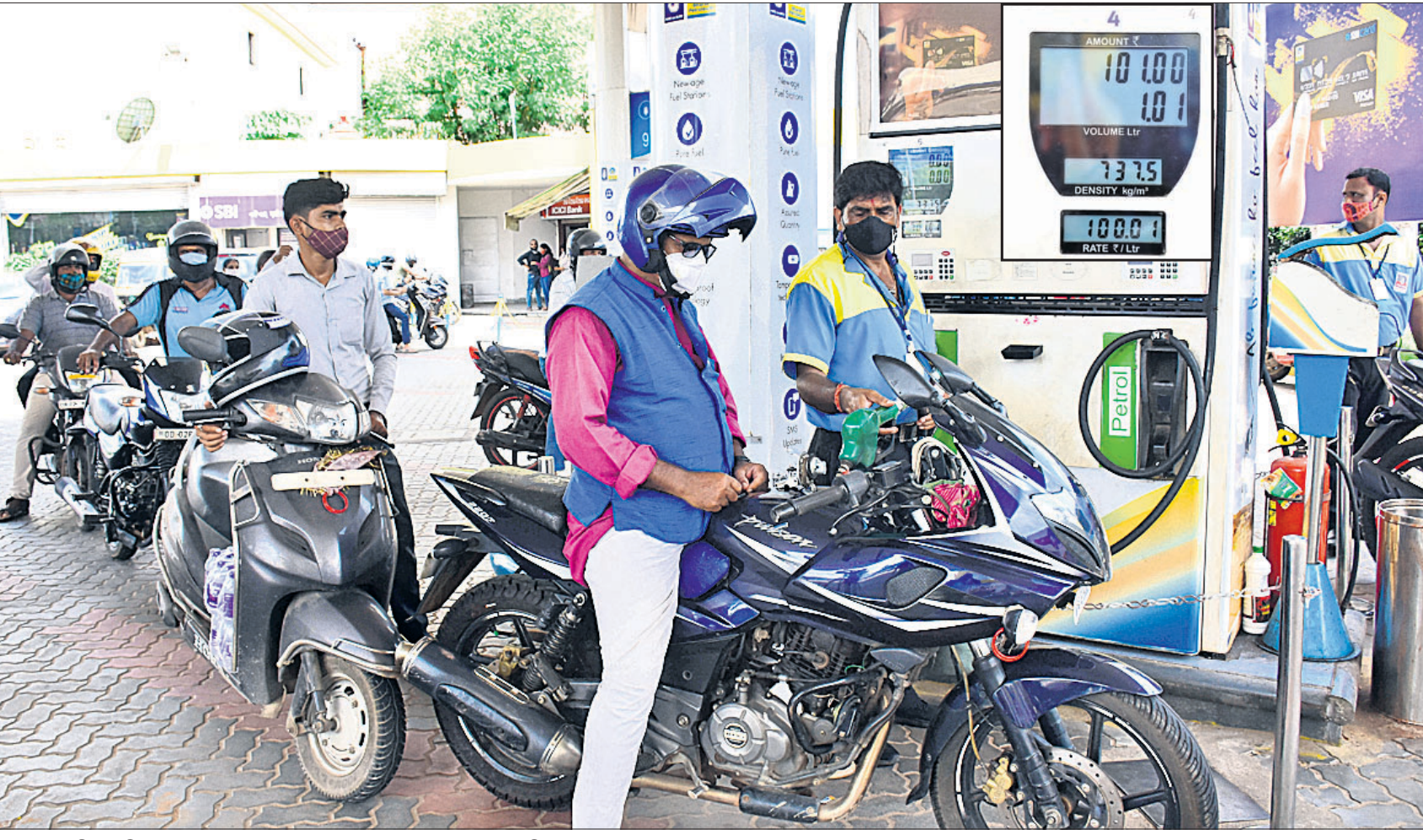
ଭୁବନେଶ୍ଵର, ୨୯-୭-୨୦୨୧: ଏକ ପେଟ୍ରୋଲ ପମ୍ପରେ ଶୁକ୍ରବାର ଲୋକେ ତେଲ ପକାଇଛନ୍ତି।

ଭୁବନେଶ୍ଵର, ୨୯(ବୁଧବେଳା) ପୁରୀର ବିରତି ପରେ ଶୁକ୍ରବାର ପୁଣି ପେଟ୍ରୋଲ ଦର ବଢ଼ିଛି। ଭୁବନେଶ୍ଵରରେ ପେଟ୍ରୋଲ ୩୬ ପଇସା ବଢ଼ିବା ଯୋଗୁ ଦର ପ୍ରଥମ ଥର ଲାଗି ୧୦୦.୦୧ ଟଙ୍କା ହୋଇଛି। ଭାରତ ପେଟ୍ରୋଲିୟମ କର୍ପୋରେସନ ଲିମିଟେଡ୍ (ବିପିଏସିଏଲ) ପକ୍ଷରୁ ସୂଚନା ମିଳିଛି। ଏହି ସମୟରେ ଡିଜେଲ ଦର ଅପରିବର୍ତ୍ତିତ ୯୭.୨୫ ଟଙ୍କା ରହିଛି। ଓଡ଼ିଶାରେ ମେ ୪ ପରଠାରୁ ତେଲ ଦର ୩୩୩ ଥର ବଢ଼ିବା ଯୋଗୁ ପେଟ୍ରୋଲ ୮. ୮୩ ଟଙ୍କା ଏବଂ ଡିଜେଲ ୯.୨୧ ଟଙ୍କା ମହଙ୍ଗା ହୋଇଛି। ତେଲ ଦର ଯେଉଁଭଳି ଲଗାତର ବଢ଼ିଚାଲିଛି ରାଜଧାନୀରେ ଡିଜେଲ ମଧ୍ୟ ଶୀଘ୍ର ୧୦୦ ଟଙ୍କା