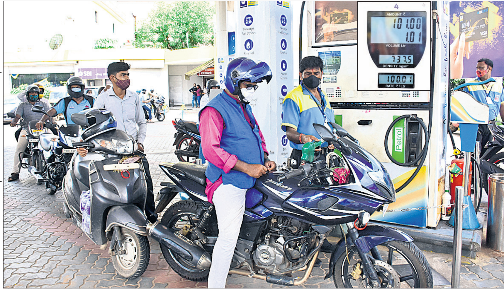
ଭୁବନେଶ୍ୱର, ସୁନିର୍-୨ସ୍ଥିତ ଏକ ପେଟ୍ରୋଲ ପମ୍ପରେ ଶୁକ୍ରବାର ଲୋକେ ତେଲ ପକାଇଛନ୍ତି।

ଭୁବନେଶ୍ୱର, ୨୭(ବୁଧବେ) ଦୁଇଦିନର ବିରତି ପରେ ଶୁକ୍ରବାର ପୁଣି ପେଟ୍ରୋଲ ଦର ବଢ଼ିଛି। ଭୁବନେଶ୍ୱରରେ ପେଟ୍ରୋଲ ୩୬ ପଇସା ବଢ଼ିବା ଯୋଗୁ ଦର ପ୍ରଥମ ଥର ଲାଗି ୧୦୦.୦୧ ଟଙ୍କା ହୁଇଥିବା ଭାରତ ପେଟ୍ରୋଲିୟମ କର୍ପୋରେସନ ଲିମିଟେଡ୍(ବିପିଏସିଏଲ) ପକ୍ଷରୁ ସୂଚନା ମିଳିଛି। ଏହି ସମୟରେ ଡିଜେଲ ଦର ଅପରିବର୍ତ୍ତିତ ୯୭.୨୫ ଟଙ୍କା ରହିଛି। ଓଡ଼ିଶାରେ ମେ ୪ ପରଠାରୁ ତେଲ ଦର ୩୩୩ ଥର ବଢ଼ିବା ଯୋଗୁ ପେଟ୍ରୋଲ ୮. ୮୩ ଟଙ୍କା ଏବଂ ଡିଜେଲ ୯.୨୧ ଟଙ୍କା ମହଙ୍ଗା ହୋଇଛି। ତେଲ ଦର ଯେଉଁଭଳି ଲଗାତର ବଢ଼ିଚାଲିଛି ରାଜଧାନୀରେ ଡିଜେଲ ମଧ୍ୟ ଶୀଘ୍ର ୧୦୦ ଟଙ୍କା