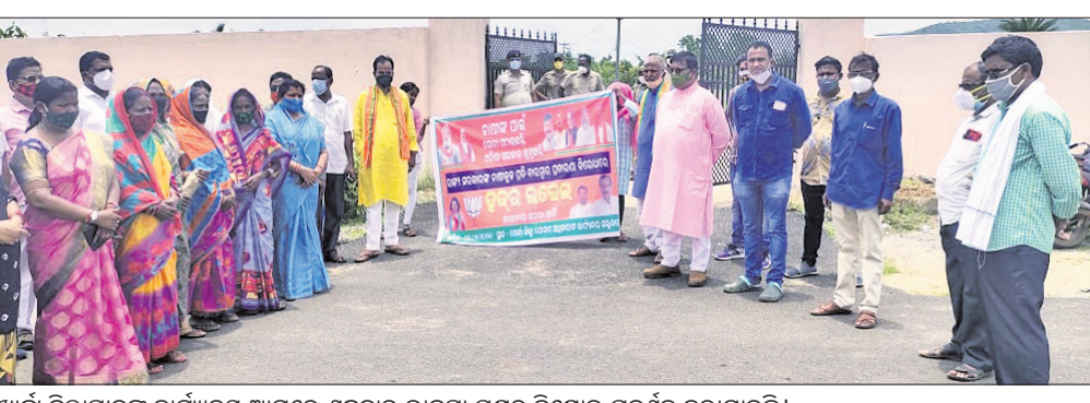
ଖୋର୍ଦ୍ଧା ଜିଲ୍ଲାପାଳଙ୍କ କାର୍ଯ୍ୟାଳୟ ଆଗରେ ଶୁକ୍ରବାର ଭାଙ୍ଗା ପକ୍ଷରୁ ବିଶେଷ ପ୍ରଦର୍ଶନ କରାଯାଇଛି।