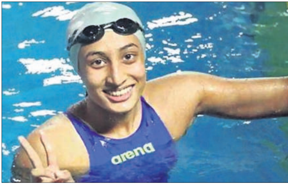
ବ୍ୟାକସ୍ପୋକ୍‌ରେ ୧:୦୪.୪୭ ସେକେଣ୍ଡ ଗାଳିମି* ସହ ସ୍ୱର୍ଣ୍ଣ ପଦକ ଲାଭ କରିଥିଲେ। ଗୋଟିଏ ପ୍ରଥମ ଲଭେଇଥିଲେ ଏପ୍ରକାରରେ ସର୍ବୋଚ୍ଚ ଓ ଲଗାଲଗାରେ ବିଜିତ ଲଭେଇଥିଲେ। ଭାଗ ନେଇଥିଲେ।

ଯୋଗ୍ୟତା ହାସଲ କରିଛନ୍ତି। ପୂର୍ବରୁ ଶ୍ରୀହରି ନଗରାଜନ ଓ ସଜନ ପ୍ରକାଶ ଉଭୟେ 'ଏ' କ୍ଲାସ୍‌ରେ ଅଲିମ୍ପିକ୍‌ରେ ଭାଗ ନେବେ 'ସୁନିକର୍ତ୍ତା' କୋଟା' କରିଆରେ ସେ ଯୋଗ୍ୟତା ହାସଲ କରିଥିବା ସୁଦ୍ଧା ଫେଡେରେଶନ ଅଫ ଇଣ୍ଡିଆ (ଏସ୍‌ଏଫ୍‌ଆଇ) ପ୍ରକାଶ କରିଛି। ମାମା ଗୋଟିଏ ସନ୍ତରଣ ପ୍ରତ୍ୟାବର୍ତ୍ତନ ଗ୍ରହଣ କରିବେ। ସେ ବୃତ୍ତୀୟ ଭାରତୀୟ ସନ୍ତରଣକାରୀ ଭାବେ ଅଲିମ୍ପିକ୍