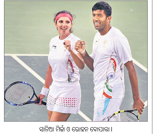
ସାନିଆ ମିର୍ଜା ଓ ରୋହନ ବୋପାଳା