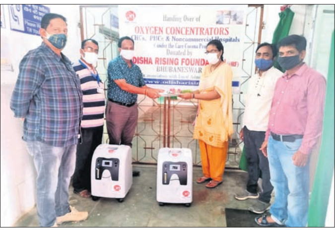
ରୋଷ୍ଟା ସାମ୍ବାଧକେନ୍ଦ୍ରକୁ ଅକ୍ତିଜନ କନ୍‌ସେଣ୍ଟ୍ରେଟର ପ୍ରଦାନ କରାଯାଇଛି ।

ପରିସଦ ଓଡିଶା ଯାଦବ ବିକାଶ ପରିଷଦ କର୍ମକର୍ମୀ ଅନାଥ ପିଲାଙ୍କୁ ସମବେଦନା ଜଣାଇଛନ୍ତି ।