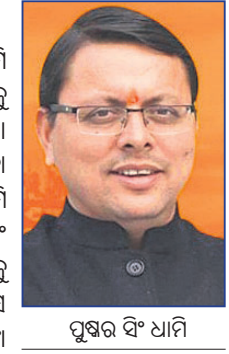
ପୁଷ୍ପର ବିଏ ଧାମି

ଭାଜପା ବିଧାନ ସଭାରେ ବିଏ ଧାମି ଉତ୍ତରାଧିକାରୀ ପଦବର୍ତ୍ତୀ ମୁଖ୍ୟମନ୍ତ୍ରୀ ହେବାକୁ ଯାଉଛନ୍ତି। ଶନିବାର ତେରାହୁନୁରେ ଭାଜପା ବିଧାନ ସଭା ଦଳ ଚିଠିକ ବସି ଚାଲୁ ନେତା ନିର୍ବାଚନ କରାଯାଇଛି। ୪ ମାସ ମଧ୍ୟରେ ଧାମି ହେବେ ରାଜ୍ୟର ତୃତୀୟ ମୁଖ୍ୟମନ୍ତ୍ରୀ। ତିନିଥର ବିଏ ରାଫ୍ଟର ଧାର୍ଯ୍ୟ ସମୟ ମଧ୍ୟରେ ବିଧାନ ସଭାକୁ ନିର୍ବାଚିତ ହେବା ସମ୍ଭାବନା ନ ଥିବାରୁ ସେ ଶୁକ୍ରବାର ମୁଖ୍ୟମନ୍ତ୍ରୀ ପଦରୁ ଇସ୍ତଫା