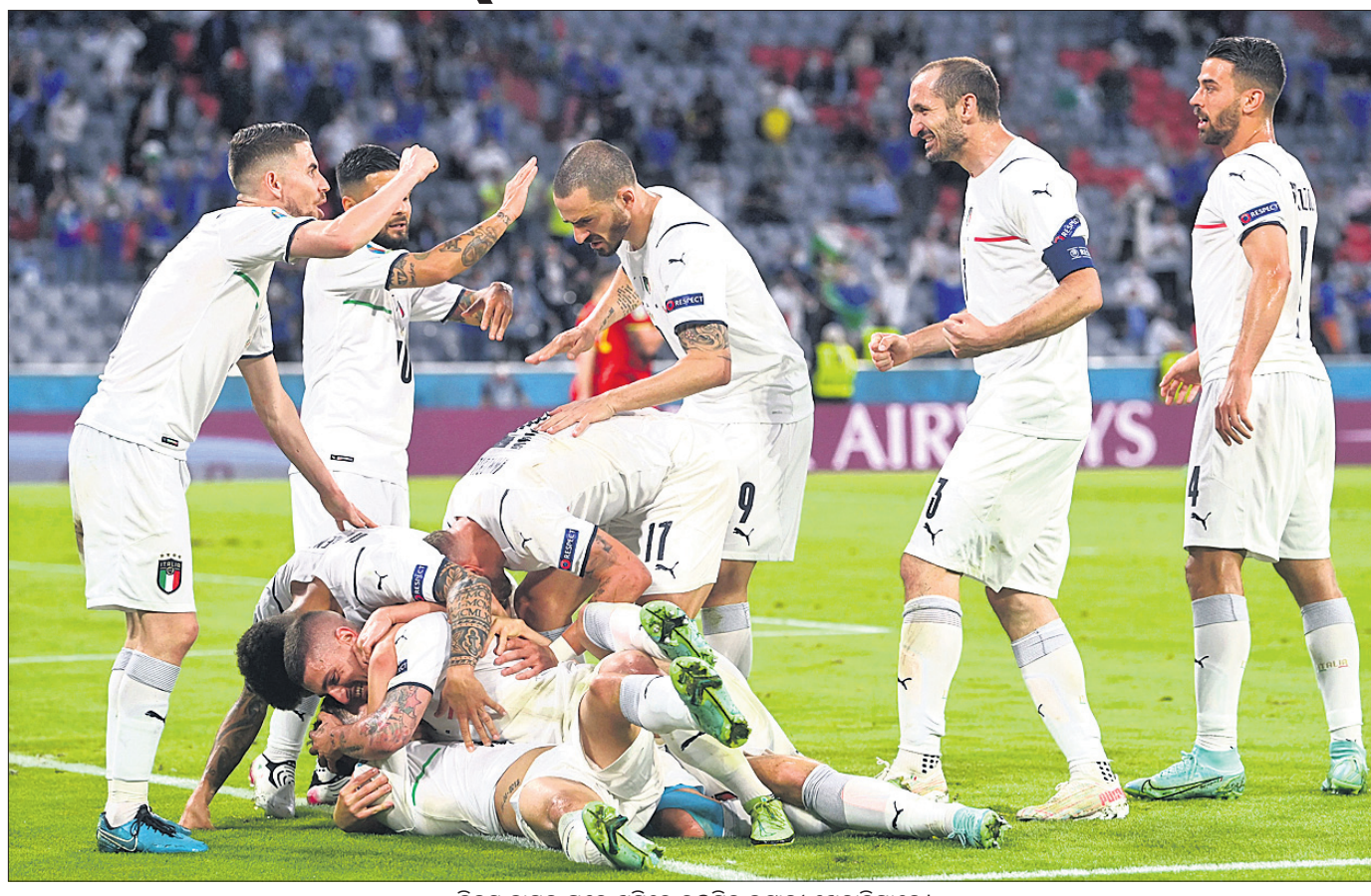
ବିଜୟ ହାସଲ ପରେ ଖୁସିରେ ଉଲଟିବେ ଇଟାଲୀ ଖେଳାଳିମାନେ।

ୟୁରୋକପ୍ ଫୁଟବଲ ଟୁର୍ନାମେଣ୍ଟରେ ଇଟାଲୀ ସେମିଫାଇନାଲରେ ପ୍ରବେଶ କରିଛି। ଶୁକ୍ରବାର ସ୍ପାନିଶ ଆଲିଆନ୍ସା ଏରିନାରେ ଅନୁଷ୍ଠିତ ଏହି ଫାଇନାଲରେ ଇଟାଲୀ ୨-୧ ଗୋଲରେ ସ୍ପାନିଶକୁ ହରାଇ ଅଗ୍ରଗତି କରିଛି। ଏଥିପାଇଁ ବିଶ୍ୱର ୧ ନମ୍ବର ଦଳ ବେଲଜିୟମର ବିପକ୍ଷରେ ଯିବେ କହିଲେ ଭୁଲ ହେବନାହିଁ। ଏବେ ୭ ତାରିଖ ରୁସ୍‌ରେ ସେମିଫାଇନାଲରେ ଇଟାଲୀ ଓ ବ୍ରୁଜିଆର ଯୁରୋକପ୍ ଚାମ୍ପିୟନ ହୋଇଥିବା ସ୍ପେନ୍ ମଧ୍ୟରେ ମୁକାବିଲା