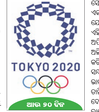
ଆଉ ୨୦ ଦିନ