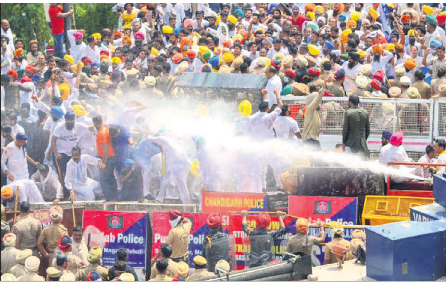
ପଞ୍ଚାବରେ ବିଦ୍ୟୁତ୍ କାର୍ଯ୍ୟ ପ୍ରତିବାଦରେ ଆମ୍ ଆର୍ପା ପାର୍ଟି (ଏଏପି) ପକ୍ଷରୁ ମୁଖ୍ୟମନ୍ତ୍ରୀ ଅମରିନ୍ଦର ସିଂହଙ୍କ ମୋହାଲିସ୍ଥିତ ବାସଭବନ ଘେରାଇ ବେଳେ ପୋଲିସର ଲାଠିମାର୍ଚ୍ଚ ଓ ପାଣିବର୍ଷା।

ଦେଇଥିଲେ। ୪୫ ବର୍ଷର ଧାମି ଦୁଇଥର ବିଧାନ ସଭାକୁ ନିର୍ବାଚିତ ହୋଇଥିଲାବେଳେ କେବେ ମନ୍ତ୍ରୀ ହୋଇ ନାହାନ୍ତି। ସେ ଉତ୍ତରାଧିକାରୀ ପଦବର୍ତ୍ତୀ ମୁଖ୍ୟମନ୍ତ୍ରୀ ଭାବେ ବିଏ କୋଣିୟାରାଜର ଓଏସଡି ଭାବେ କାର୍ଯ୍ୟ କରିଥିଲେ। ସେ ରବିବାର ଅପରାହ୍ଣ ୫ଟାରେ ଶପଥ ଗ୍ରହଣ କରିବେ ବୋଲି ରାଜଭାବନ ପକ୍ଷରୁ ସ୍ୱୀକୃତି କରାଯାଇଛି।