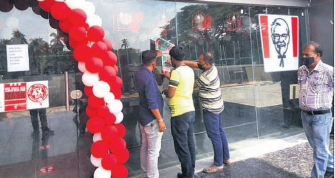
ବିଏମ୍ସିଏ ପକ୍ଷରୁ ଦୋକାନ ସିଲ୍ ।

କୋଭିଡ଼ ନିୟମ ଉଲ୍ଲଙ୍ଘନ ଅଭିଯୋଗରେ ବ୍ରହ୍ମପୁର ସହରରେ ନୂଆ କରି ଖୋଲିଥିବା କେଏଫ୍ସିଏ ଖାଦ୍ୟ ବ୍ୟବସାୟ ପ୍ରତିଷ୍ଠାନକୁ ବିଏମ୍ସିଏ ଶନିବାର ସିଲ୍ କରିଛି । ସହରର କେତେକ କମ୍ପ୍ଲେକ୍ସ ରୋଡରେ ନୂତନ ଭାବେ ନିର୍ମିତ ହେଉଥିବା ମାକେଟ୍ କମ୍ପ୍ଲେକ୍ସ ମଧ୍ୟରେ କେଏଫ୍ସିଏ ନାମକ ଏକ ଖାଦ୍ୟ ବ୍ୟବସାୟ ପ୍ରତିଷ୍ଠାନ ଶୁକ୍ରବାର ଉଦ୍ଘାଟିତ ହୋଇଥିଲା । ଉକ୍ତ ପ୍ରତିଷ୍ଠାନରେ ଖାଦ୍ୟ ଖାଇବା ଓ ଖାଦ୍ୟ ଅର୍ଥର ନିମନ୍ତେ ଦୋକାନ ସମ୍ମୁଖରେ