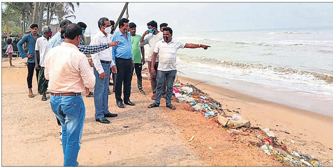
କ୍ଷତିଗ୍ରସ୍ତ ଅଞ୍ଚଳ ପରିଦର୍ଶନ କରୁଥିବା ଜଳ ସମ୍ପଦ ବିଭାଗ ସର୍ବୋଚ୍ଚ ଯନ୍ତ୍ର ଓ ଅଧିକାରୀ ।