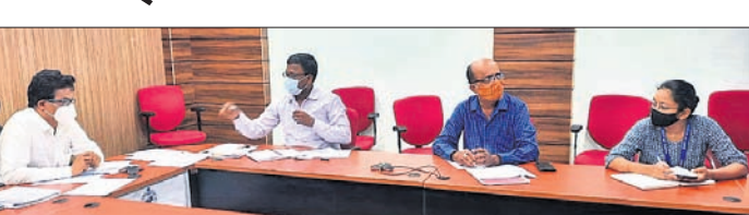
ବୈଠକରେ ଉପସ୍ଥିତ ଉପଜିଲ୍ଲାପାଳ ଓ ଅନ୍ୟମାନେ ।

ଅଭିଯୋଗ ପତ୍ର ଦାଖଲ କରିପାରିବେ ସେଥିପ୍ରତି ଦୃଷ୍ଟି ଦେବାକୁ ଉପଜିଲ୍ଲାପାଳ ପୃଷ୍ଟି କହିଛନ୍ତି । ଯେଉଁ ମାନଙ୍କ ପକ୍ଷା ହୋଇଯାଇଛି ସେମାନଙ୍କ ଘରକୁ ଯାଇ ପକ୍ଷା ପ୍ରଦାନ, ସମସ୍ତ ଲଘୁ ଖଣିଜ ଖାନକୁ ଯାଇ ତଦନ୍ତ କରି ଧାର୍ଯ୍ୟ ଖଣିଜଠାରୁ ଅଧିକ ନେଉଛନ୍ତି କି ଏହା ଉପରେ କଡ଼ା ନଜର ରଖିବାକୁ କୁହାଯାଇଛି । ଏହି ସମସ୍ତ ତଦାରଖ କରିବା ପାଇଁ ଜିଲ୍ଲାସ୍ତରୀୟ ଏକ ଚିମ୍ପ ଗଠନ କରାଯାଇଛି । ସମାକ୍ଷୀ