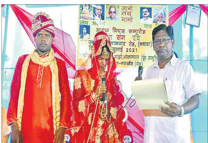
ଜୀବନ ସାଥୀ ଚୟନ କରିଛନ୍ତି। ସ୍ଥାନୀୟ ଅଞ୍ଚଳରେ ଥିବା ଅର୍ଜକ ସଂଘ ସଂସ୍କୃତିକ ସମିତି ମାଧ୍ୟମରେ ସେ ବିବାହ କରିଛନ୍ତି।

ପାଟ୍ଟନା: ଏମିତି ଏକ ବାହାଘର, ଯେଉଁଠି ନା ଅଛି କୌଣସି ପୁରୋହିତଙ୍କର ମନ୍ତ୍ରେଚାରଣ ନା ବେଦି ନା ହୋମ ନିଆଁ। ବରକନ୍ୟା ଅଭିଭାବିକା ସାଥୀ ରଖି ଜନ୍ମ ଜନ୍ମର ଶପଥ ଦି ନେବାର ଆବଶ୍ୟକତା ନାହିଁ।