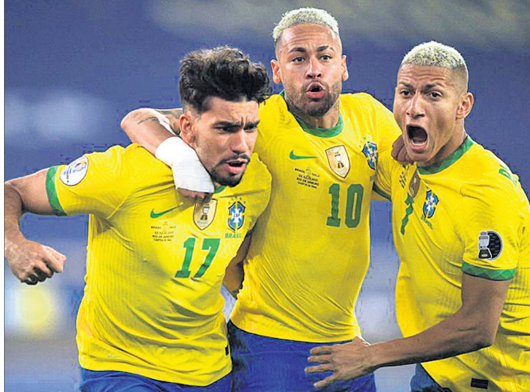
ଚିଲି ବିପକ୍ଷରେ ଗୋଲ ଖେଳିବା ପରେ ଖୁସି ପୂର୍ଣ୍ଣରେ ବ୍ରାଜିଲର ଲୁକାସ ପାକ୍ୱାଟା (ବାମ), ନେମାର (ମଝି) ଓ ରିଚାର୍ଡସନ।

କୋପା ଆମେରିକା ଫୁଟ୍‌ବଲ ଟୁର୍ନାମେଣ୍ଟରେ ଗତଥରର ଚାମ୍ପିୟନ ବ୍ରାଜିଲ ସେମିଫାଇନାଲରେ ପ୍ରବେଶ କରିଛି। ସ୍ଥାନୀୟ ଅଲିମ୍ପିକ୍ କୋପା ଆମେରିକା ଫୁଟ୍‌ବଲ ଟୁର୍ନାମେଣ୍ଟରେ ଗତଥରର ଚାମ୍ପିୟନ ବ୍ରାଜିଲ ସେମିଫାଇନାଲରେ ପ୍ରବେଶ କରିଛି। ସ୍ଥାନୀୟ ଅଲିମ୍ପିକ୍ କୋପା ଆମେରିକା ଫୁଟ୍‌ବଲ ଟୁର୍ନାମେଣ୍ଟରେ ଗତଥରର ଚାମ୍ପିୟନ ବ୍ରାଜିଲ ସେମିଫାଇନାଲରେ ପ୍ରବେଶ କରିଛି। ସ୍ଥାନୀୟ ଅଲିମ୍ପିକ୍ କୋପା ଆମେରିକା ଫୁଟ୍‌ବଲ ଟୁର୍ନାମେଣ୍ଟରେ ଗତଥରର ଚାମ୍ପିୟନ ବ୍ରାଜିଲ ସେମିଫାଇନାଲରେ ପ୍ରବେଶ କରିଛି।