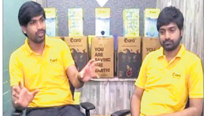
ଚାକିରି ଛାଡ଼ି ଦେଇଛନ୍ତି। ଏହାକୁ ନେଇ ସୁନିତ କୁହନ୍ତି ଯେତେବେଳେ ଜଣେ ବ୍ୟକ୍ତି କୌଣସି ଦୂର ସ୍ଥାନକୁ ଯାତ୍ରା କରୁଛନ୍ତି ସେତେବେଳେ ସେ ୪-୫ ବୋତଲ ପାଣି ନେଇ ଯାଆନ୍ତି। ଏଥିରୁ ୧ ବୋତଲକୁ କମ ରିସାଇକ୍ଲିଂ ହେଉଥିବା ବେଳେ ଅନ୍ୟ ୩ ରୁଟିକ ପରିବେଶ ଉପରେ କୁପ୍ରଭାବ ପକାଉଛି, ଯାହା ଏବେ ଏକ ବଡ଼ ସମସ୍ୟା ହୋଇ ପୁଣି ତେଜିଛି।

ହାଇଦ୍ରାବାଦ: ସାରା ବିଶ୍ୱରେ ବଡ଼ ଚାଲିଥିବା ପ୍ରତ୍ୟୁଷଣକୁ ଦୃଷ୍ଟିରେ ରଖି ଏହାକୁ ନିୟନ୍ତ୍ରଣ କରିବାକୁ ଏବେ ପ୍ରାୟ ସବୁଠି ପ୍ରୟାସ କାରି ରହିଛି। ଏହି କ୍ରମରେ ହାଇଦ୍ରାବାଦରେ ଥିବା ଏକ ସ୍ମାର୍ଟ ଅପ ପରିବେଶ ସୁରକ୍ଷା ଦିଗରେ ଆଗେଇ ଆସିଛି।