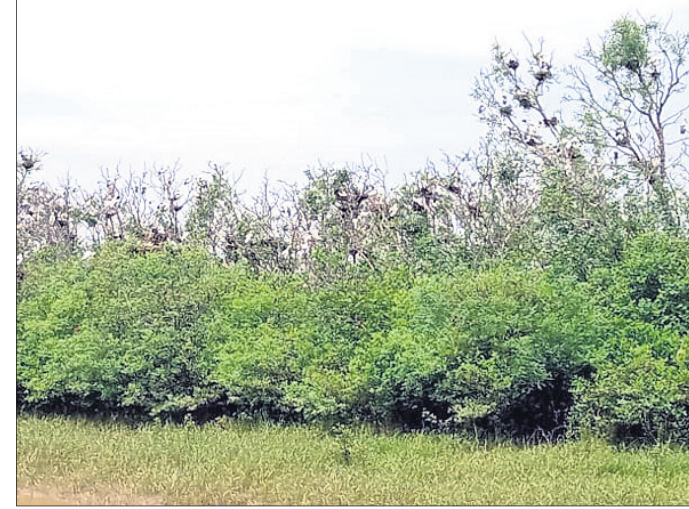
ଗଛ ଉପରେ ଦେଶୀ ପକ୍ଷୀଙ୍କ ଭିଡ଼।

■ ଭିତରକନିକାରେ ୬୦ ହଜାର ପକ୍ଷୀଙ୍କ ଭିଡ଼ ■ ଜୈବ ବିବିଧତା ପ୍ରଭାବିତ ଯୋଗୁ ସ୍ଥାନ ପରିବର୍ତ୍ତନ