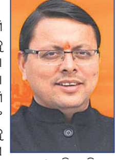
ପୁଷ୍କର ସିଂ ଧାମି

ଭାଜପା ବିଧାୟକ ପୁଷ୍କର ସିଂ ଧାମି ଉତ୍ତରାଖଣ୍ଡର ପରବର୍ତ୍ତୀ ମୁଖ୍ୟମନ୍ତ୍ରୀ ହେବାକୁ ଯାଉଛନ୍ତି। ଶନିବାର ତେରାହୁନ୍ଦରେ ଭାଜପା ବିଧାୟକ ଦଳ ବୈଠକ ବସି ତାଙ୍କୁ ନେତା ନିର୍ବାଚନ କରାଯାଇଛି। ୪ ମାସ ମଧ୍ୟରେ ଧାମି ହେବେ ରାଜ୍ୟର ତୃତୀୟ ମୁଖ୍ୟମନ୍ତ୍ରୀ। ତିନିଥର ବି ରାଜ୍ୟ ଧାର୍ଯ୍ୟ ସମୟ ମଧ୍ୟରେ ବିଧାନସଭାକୁ ନିର୍ବାଚିତ ହେବା ସମ୍ଭବନା ନ ଥିବାରୁ ସେ ଶୁକ୍ରବାର ମୁଖ୍ୟମନ୍ତ୍ରୀ ପଦରୁ ଇସ୍ତଫା