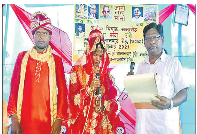
ଜୀବନ ସାଥୀ ଚୟନ କରିଛନ୍ତି। ଗ୍ଲୋବାଲ ସଂସ୍ଥାରେ ଥିବା ଅର୍ଜକ ସଂସ୍ଥା ସାଂସ୍କୃତିକ ସମିତି ମାଧ୍ୟମରେ ସେ ବିବାହ କରିଛନ୍ତି। ଯେଉଁଠାରେ କୌଣସି ବ୍ରାହ୍ମଣଙ୍କର