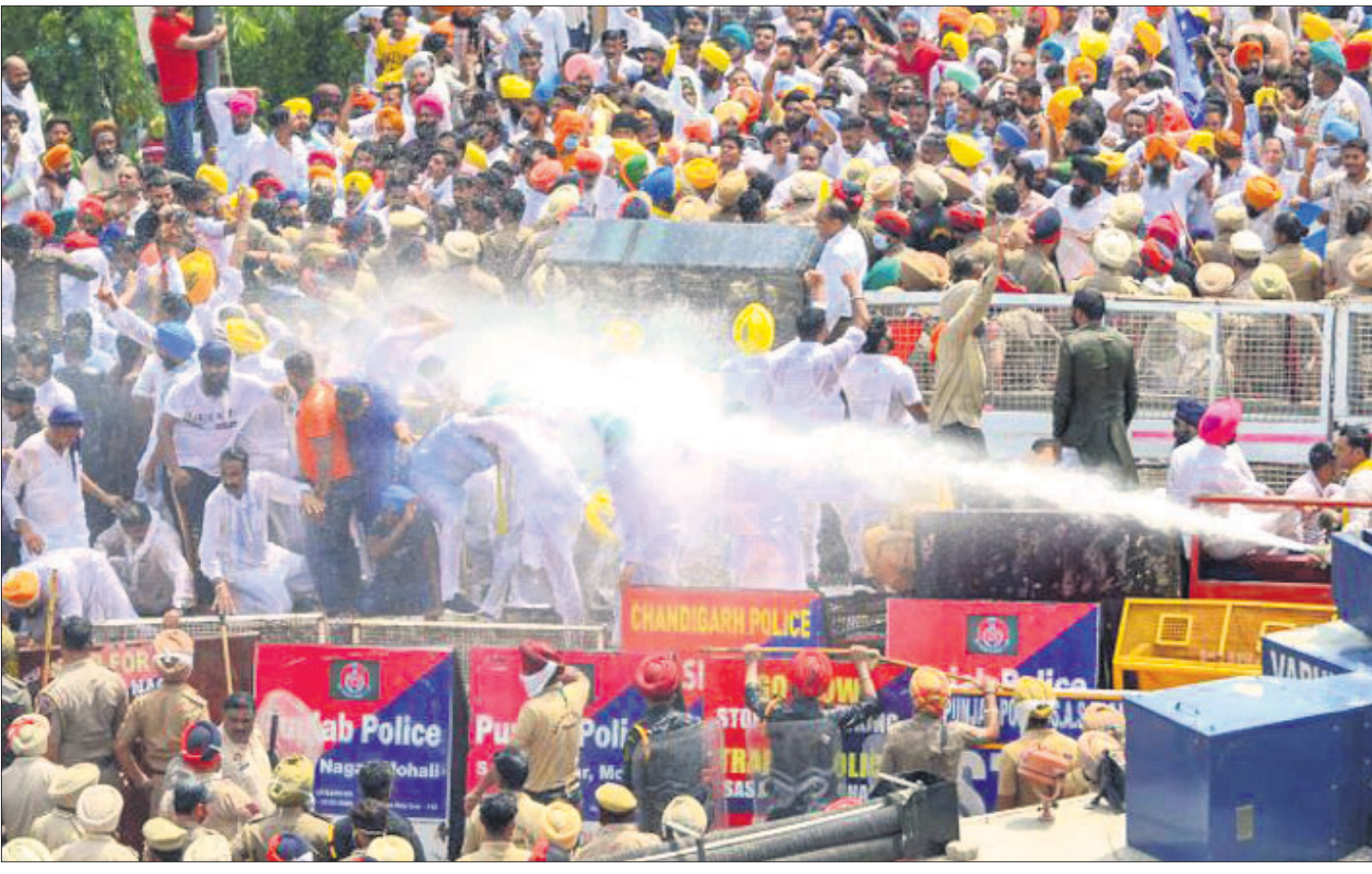
ପଞ୍ଜାବରେ ବିଦ୍ୟୁତ୍ କାଟ୍ ପ୍ରତିବାଦରେ ଆନ୍ ଆର୍ମା ପାର୍ଟି (ଏଏପି) ପକ୍ଷରୁ ମୁଖ୍ୟମନ୍ତ୍ରୀ ଅମରିନ୍ଦର ସିଂହଙ୍କ ମୋହାଲିସ୍ଥିତ ବାସଭବନ ଘେରାଇ ବେଳେ ପୋଲିସର ଲାଠିମାର୍ଚ୍ଚ ଓ ପାଣିବର୍ଷା।

ଦେଇଥିଲେ। ୪୫ ବର୍ଷୀୟ ଧାମି ଦୁଇଥର ବିଧାନସଭାକୁ ନିର୍ବାଚିତ ହୋଇଥିଲାବେଳେ କେବେ ମନ୍ତ୍ରୀ ହୋଇ ନାହାନ୍ତି। ସେ ଉତ୍ତରାଖଣ୍ଡର ପୂର୍ବତନ ମୁଖ୍ୟମନ୍ତ୍ରୀ ଭଗତ ସିଂ କୋଣ୍ଡାୟାଙ୍କର ଓଷଧି ଭାବେ କାର୍ଯ୍ୟ କରିଥିଲେ। ସେ ରବିବାର ଅପରାହ୍ଣ ୫ଟାରେ ଶପଥ ଗ୍ରହଣ କରିବେ ବୋଲି ରାଜଭବନ ପକ୍ଷରୁ ସ୍ୱସ୍ତ କରାଯାଇଛି।