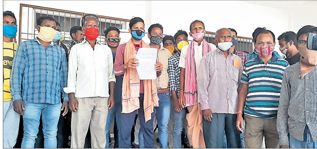
ଜିଲ୍ଲାପାଳଙ୍କ ଅଭିଯୋଗ ପାଇଁ ଆସିଥିବା ଗ୍ରାମବାସୀ । ସେମାନେ ରୋଜଗାର ନ ପାଇ ଶୋଷଣର ଶିକାର ହେଉଛନ୍ତି ।

ଝାରସୁଗୁଡ଼ା ଜିଲ୍ଲାରେ ପଞ୍ଚାୟତ ସରପଞ୍ଚଙ୍କ ନାମରେ ଦୁର୍ନୀତି ଅଭିଯୋଗ ଆଣିଛନ୍ତି ।