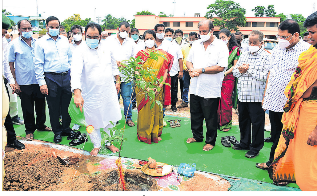
ରାଜ୍ୟପ୍ରଧାନଙ୍କୁ ବନ ମହୋତ୍ସବର ଚାରାରୋପଣ କାର୍ଯ୍ୟକ୍ରମରେ ମନ୍ତ୍ରୀ ବିକ୍ରମକେଶରୀ ଆରୁଖ ଏବଂ ଅନ୍ୟ ଅତିଥିମାନେ।

୨୦୨୧-୨୨ ଆର୍ଥିକ ବର୍ଷରେ ଜଙ୍ଗଲ, ପରିବେଶ ଓ ଜଳବାୟୁ ପରିବର୍ତ୍ତନ ବିଭାଗ ପକ୍ଷରୁ ରାଜ୍ୟରେ ବ୍ୟାପକ ବନୀକରଣ କାର୍ଯ୍ୟକ୍ରମ ହାତକୁ ନିଆଯାଇଛି।