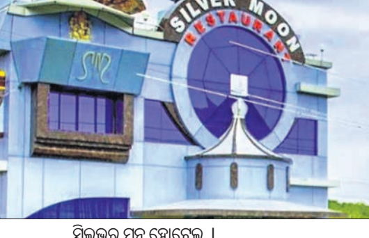
ସିଲଭର୍ ମୁନ୍ ହୋଟେଲ ।

ହୋଟେଲ ମାଲିକଙ୍କୁ ମଧ୍ୟ ଏ ନେଇ ଚିଠି କରାଯାଇଛି । ହୋଟେଲ ବନ୍ଦ ନ କଲେ ଆଇନଗତ କାର୍ଯ୍ୟାନୁଷ୍ଠାନ ଗ୍ରହଣ କରାଯିବ ବୋଲି ଚାରିବ କରାଯାଇଛି । ଏହାର ନକଲ ସମଲପୁର ଜିଲ୍ଲାପାଳ, ଏସ୍‌ପି ଓ ବୁଲ୍‌ଗା ବିଦ୍ୟୁତ୍ ବିଭାଗକୁ ପଠାଯାଇଛି । ବିଦ୍ୟୁତ୍ ବିଭାଗକୁ ଶୀଘ୍ର ବିଦ୍ୟୁତ୍ ସଂଯୋଗ ବିଚ୍ଛିନ୍ନ କରିବାକୁ ନିର୍ଦ୍ଦେଶ ଦିଆଯାଇଛି । ସୂଚନାଯୋଗ୍ୟ ସିଲଭର୍ ମୁନ୍ ହୋଟେଲରୁ ନିର୍ଗତ ହେଉଥିବା ପାଣି ସିଧାସଳଖ ଲୋକଙ୍କ ଜମି ଓ କଟା (ଜଳାଶୟ)ରେ ପ୍ରବେଶ କରୁଥିଲା । ଏହାସହ ସ୍ୱରୋଧ ଖାତର, ରୋଷେଇ ଘରର ଆବର୍ଜନା ମଧ୍ୟ ପକାଯାଉଥିଲା । ଏ ନେଇ ସ୍ଥାନୀୟ ପ୍ରଶାସନର ସୁରକ୍ଷା ସମିତି ପକ୍ଷରୁ ଅଭିଯୋଗ କରାଯାଇଥିଲା । ସ୍ଥାନୀୟ