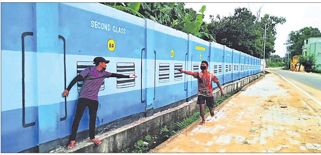
ନବରଙ୍ଗପୁରରୁ ରେଳପଥ ନ ଥିବାବେଳେ ଚିଲାପାଳକ ଆବାସିକ କାର୍ଯ୍ୟକ୍ରମ କାଳରେ ଅକାୟାଳିଆ ଟ୍ରେନ୍ ଚିତ୍ର ଆଗରେ ଲୋକେ ଫଟୋ ଉଠାଉଛନ୍ତି ।