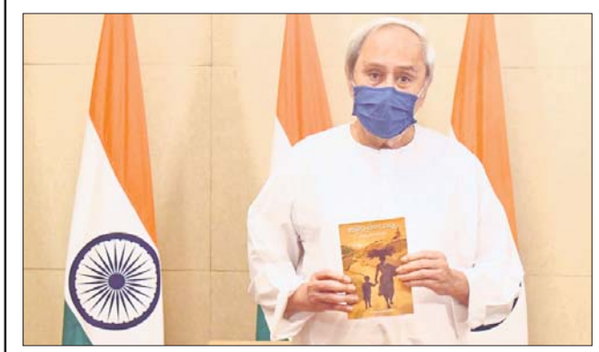
ପୁସ୍ତକ 'ଆଜିର ଦିନ ମୋର'କୁ ଉନ୍ମୋଚନ କରୁଛନ୍ତି ମୁଖ୍ୟମନ୍ତ୍ରୀ ନବୀନ ପଟ୍ଟନାୟକ ।

ବିଚାରାଧୀନ ଥିବା ଦୃଷ୍ଟିରୁ ଟ୍ରିବ୍ୟୁନାଲଙ୍କ ୨୦୧୭ ସେପ୍ଟେମ୍ବର ୧୩ ଓ ୨୦୨୧ ଜୁନ ୨୧ରେ ପ୍ରଦତ୍ତ ରାୟକୁ ଆନ୍ଧ୍ର ରାଜ୍ୟ ନବୀନ ବିବାଦ ଆଇନ ୧୯୫୬ ର ଧାରା ୬(୧) ଅନୁସାରେ ସରକାରୀ ରାଜପତ୍ର (ଗେଜେଟ)ରେ ପ୍ରକାଶିତ କରାଯାଇ ପାରିବ ନାହିଁ। ସରକାରୀ ଗେଜେଟରେ ଟ୍ରିବ୍ୟୁନାଲଙ୍କ ରାୟ ପ୍ରକାଶିତ ନ ହେଲେ ତାହାକୁ କାର୍ଯ୍ୟକାରୀ କରାଯାଇ ପାରିବ ନାହିଁ। ସର୍ବୋଚ୍ଚ ନ୍ୟାୟାଳୟଙ୍କ ଦ୍ୱାରା ସ୍ୱତନ୍ତ୍ର ଲିଟ୍ ପିଟିଗନର ରୂପାନ୍ତ ରାୟ ପ୍ରକାଶ ନ ପାଇବା ଯାଏ ବଂଶଧାରା ଜଳ ବିବାଦ ଟ୍ରିବ୍ୟୁନାଲଙ୍କ ରାୟକୁ ଗେଜେଟରେ ପ୍ରକାଶନ ପାଇଁ ଆନ୍ଧ୍ର ପକ୍ଷରୁ ସହମତି ପ୍ରଦାନ ନିମନ୍ତେ କରାଯାଇଥିବା ଅନୁରୋଧକୁ ଓଡ଼ିଶା ସରକାର ଅଗ୍ରାହ୍ୟ କରିଦେଇଛନ୍ତି।