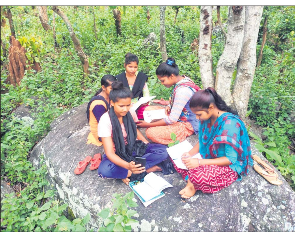
କୃଷିମାନ ଜିଲ୍ଲା ରାଜକିଆ ବୁକ ଲାଉଟି ଗ୍ରାମ ପାହାଡ଼ ଉପରେ ସରକାରୀ ଓ ବେସରକାରୀ ସ୍କୁଲର ଛାତ୍ରାଛାତ୍ରୀ ମଙ୍ଗଳବାର ଅନୁରୋଧରେ ପାଠ ପଢୁଛନ୍ତି ।

ନ୍ୟାୟାଳୟ ଟେଣ୍ଟ୍ ଏକେଡ୍ରି (ଏନ୍‌ଟିଏ)ଦ୍ୱାରା ପରିଚାଳିତ ଜେଇଇ ମେନ୍‌ର ତୃତୀୟ ଓ ଚତୁର୍ଥ ପର୍ଯ୍ୟାୟ ପରୀକ୍ଷା ତାରିଖ ଘୋଷଣା ହୋଇଛି। ଏପ୍ରିଲ ଓ ମେ ମାସରେ ଘୃଷ୍ଣିତ ହୋଇଥିବା ଏହି ପରୀକ୍ଷା ଜୁଲାଇ ଓ ଅଗଷ୍ଟରେ ଅନୁଷ୍ଠିତ ହେବ। ଏ ନେଇ ମଙ୍ଗଳବାର କେନ୍ଦ୍ର ଶିକ୍ଷା ମନ୍ତ୍ରୀ ରମେଶ ଚୋଖରିୟାଙ୍କ ନିର୍ଦ୍ଦେଶ ଘୋଷଣା କରିଛନ୍ତି। ଜେଇଇ ମେନ୍ ପରୀକ୍ଷାର ତୃତୀୟ ସେସନ୍ ଜୁଲାଇ ୨୦ରୁ ୨୫ ତାରିଖ ଯାଏ ଏବଂ ଚତୁର୍ଥ ସେସନ୍ ଜୁଲାଇ ୨୭ରୁ ୩୧ ତାରିଖ ପର୍ଯ୍ୟନ୍ତ ଅନୁଷ୍ଠିତ ହେବ। କରୋନା ଯୋଗୁ ଯେଉଁ ଛାତ୍ରାଛାତ୍ରୀମାନେ ଆବେଦନ କରିପାରି ନ ଥିଲେ, ସେମାନଙ୍କ ପାଇଁ ଆଉଥରେ ସୁଯୋଗ ଦିଆଯାଇଛି। ତୃତୀୟ ସେସନ୍ ପାଇଁ ଜୁଲାଇ ୨୭ରୁ ୩୧ ତାରିଖ ଏବଂ ଚତୁର୍ଥ ସେସନ୍ ଜୁଲାଇ ୨୭ରୁ ୩୧ ତାରିଖ ଭିତରେ