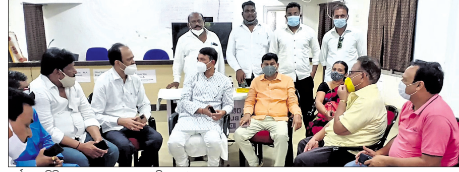
ଭାର୍ତ୍ତୀୟାଲ ମିଟିଂରେ ଯୋଗଦେଇଥିବା ଶକ୍ତିମନ୍ତ୍ରୀ ଓ ଚାଷୀମାନେ ।