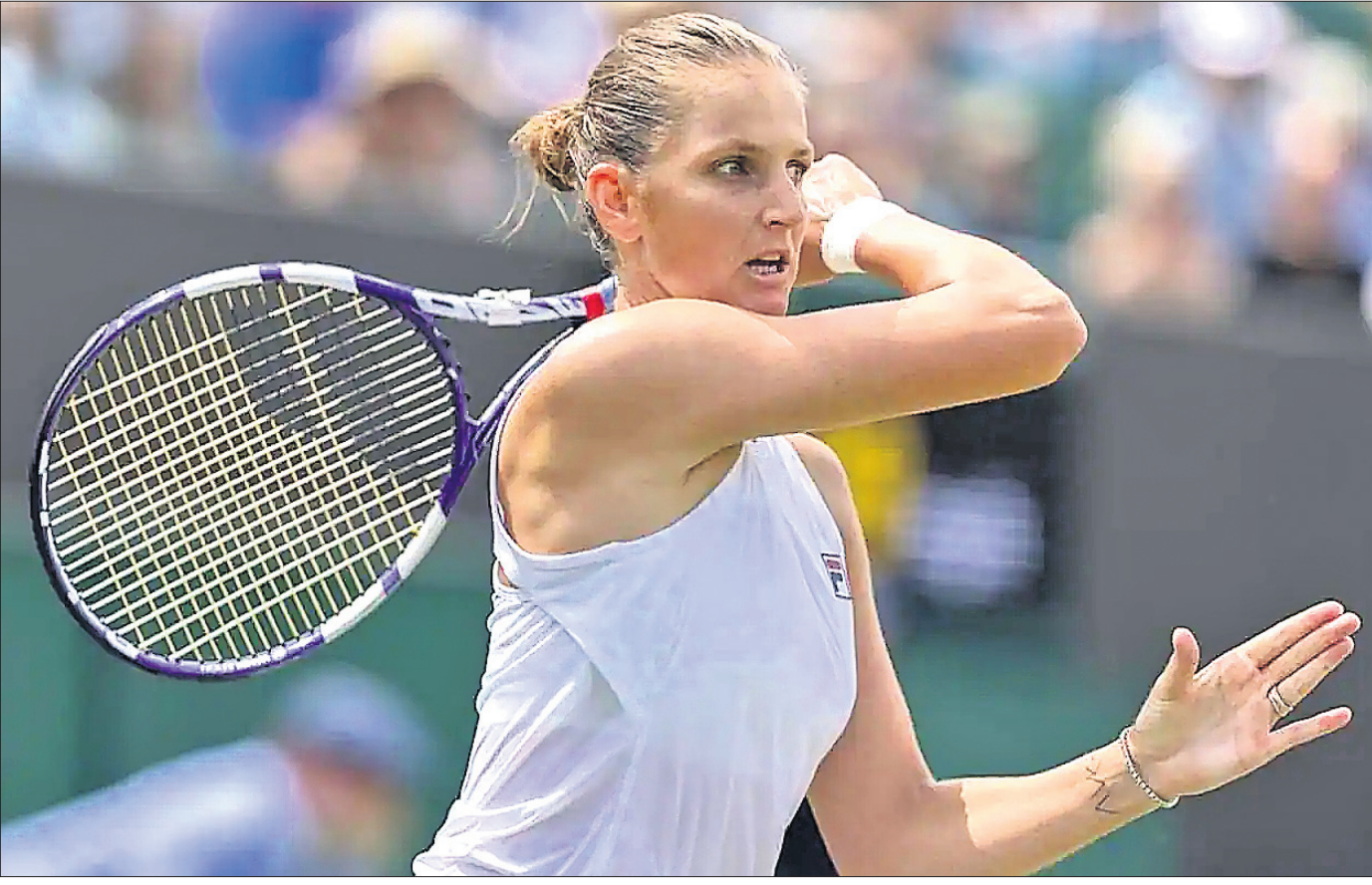
ଫ୍ରେଲଡନ ଗ୍ରାଣ୍ଡସ୍ଲାମ ଚେନିସ ମହିଳା ସିଙ୍ଗଲ୍ କ୍ୱାର୍ଟର ଫାଇନାଲ ଅବସରରେ ଚେକ୍ ରିପବ୍ଲିକର କାରୋଲିନ୍ ପ୍ଲିସ୍କୋଭା।