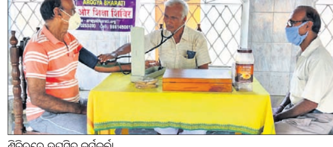
ଶିବିରରେ ଉପସ୍ଥିତ କର୍ମକର୍ତ୍ତା

ବ୍ରହ୍ମପୁର ଅଫିସ୍, ୨୭ ବ୍ରହ୍ମପୁର ହରିହର ନଗର ସ୍ଥିତ ହରିହର ଭେଟ ମନ୍ଦିର କମିଟି ପକ୍ଷରୁ ସ୍ଵାଗତ ପତ୍ର ପ୍ରଦାନ କରାଯାଇଛି। ଘରୋଇ ଶିକ୍ଷାନୁଷ୍ଠାନ ରୂପିକରେ ଆର୍ଡିଏ (ରାଜ୍ୟ ନୂ ଏକ୍ସକ୍ୟୁଟିଭ ଆକ୍ଟ) ଅନୁଯାୟୀ ଆର୍ଥିକ ଓ ସାମାଜିକ ଭାବେ ଦୁର୍ବଳ ଛାତ୍ରାଛାତ୍ରୀଙ୍କୁ ୨୫% ସଂରକ୍ଷଣ ସ୍ଥାନରେ ନାମଲେଖା ପାଇଁ ସିପିଏମ୍ ପକ୍ଷରୁ ଦାବି ହୋଇଛି। ଏହି ସ୍ଵାଗତ ପତ୍ର ପ୍ରଦାନ ଶିକ୍ଷାନୁଷ୍ଠାନ ଏଭଳି ନିୟମକୁ ଉଲ୍ଲଙ୍ଘନ କାର୍ଯ୍ୟାନୁଷ୍ଠାନ ଗ୍ରହଣ ପାଇଁ ସିପିଏମ୍ ଦାବି କରିଛି। ଏଥିସହ ଏହି ଆଇନରେ