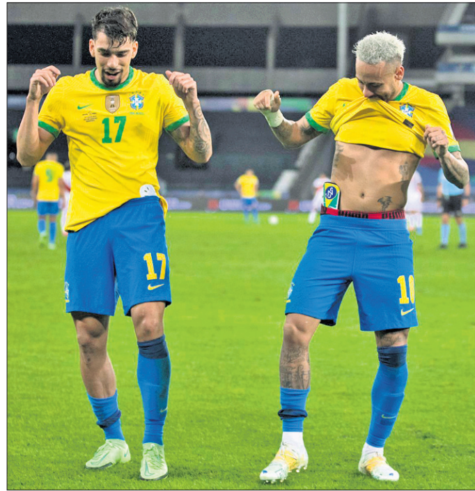
ଗୋଲ ଷ୍ଟୋର କରିବା ପରେ ବ୍ରାଜିଲର ଲୁକାସ ପାକ୍ୱେଟା ଓ ନେମାର।

କୋପା ଆମେରିକା ଚୁନାମରେ ଦକ୍ଷିଣ ଆମେରିକା ଯୁଗଳ ପାଞ୍ଚା ହାଉସ୍ ବ୍ରାଜିଲ ପୁଣି ଥରେ ଫାଇନାଲରେ ପ୍ରବେଶ କରିଛି। ଯୋମବାର ଅନୁଷ୍ଠିତ ସଂଘର୍ଷପୂର୍ଣ୍ଣ ପ୍ରଥମ ସେମିଫାଇନାଲ ମ୍ୟାଚରେ ବ୍ରାଜିଲ ୧-୦ ଗୋଲରେ ପେରୁକୁ ପରାସ୍ତ କରି ଫାଇନାଲ ଚିକେଟ୍ ହାସଲ କରିଛି। ୧୧ ଡାରିଙ୍ଗ ରବିବାର ବ୍ରାଜିଲ ଐତିହାସିକ ମରାକାନା ଷ୍ଟାଡିୟମରେ ବିତାଣ ସେମିଫାଇନାଲ ବିଜେତା ଆର୍ଜେଣ୍ଟିନା କିମ୍ବା କଲମ୍ବିଆକୁ ଭେଟିବ। ମଙ୍ଗଳବାର ବିତାଣ ସେମିଫାଇନାଲରେ ଏଥର ସଫଳ ହେଲେ ବ୍ରାଜିଲ ଦଶମଥର ପାଇଁ କୋପା ଆମେରିକା ଗାଲଡେଲ ହାସଲ କରିବ। ଫାଇନାଲରେ ଆମେ ଆର୍ଜେଣ୍ଟିନାକୁ ଭେଟିବାକୁ ଚାହୁଁଛୁ ବୋଲି ବ୍ରାଜିଲ ଚାରକା ଷ୍ଟାଡିୟମ ନେମାର କହିଛନ୍ତି। ସ୍ଥାନୀୟ ଅଲିମ୍ପିକ୍ ଚମ୍ପା ନିଲଗୋନ ସାଣ୍ଡୋସ ଷ୍ଟାଡିୟମରେ ଖେଳାଯାଇଥିବା ସେମିଫାଇନାଲରେ ହେବା ପାଇଁ ବ୍ରାଜିଲକୁ ଅବଶ୍ୟ ସଂଘର୍ଷ କରିବାକୁ ପଡିଥିଲା।