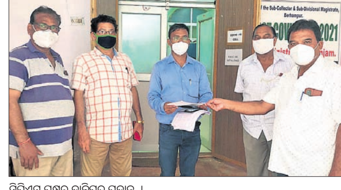
ସିପିଏମ୍ ପକ୍ଷରୁ ଦାବିପତ୍ର ପ୍ରଦାନ ।

ବ୍ରହ୍ମପୁର ଅଫିସ୍, ୨୭ ସିପିଏମ୍ ଆଞ୍ଚଳିକ କମିଟି ପକ୍ଷରୁ ମଙ୍ଗଳବାର ବ୍ରହ୍ମପୁର ଉପଜିଲ୍ଲାପାଳଙ୍କୁ ସ୍ଵାଗତ ପତ୍ର ପ୍ରଦାନ କରାଯାଇଛି। ଘରୋଇ ଶିକ୍ଷାନୁଷ୍ଠାନ ରୂପିକରେ ଆର୍ଡିଏ (ରାଜ୍ୟ ନୂ ଏକ୍ସକ୍ୟୁଟିଭ ଆକ୍ଟ) ଅନୁଯାୟୀ ଆର୍ଥିକ ଓ ସାମାଜିକ ଭାବେ ଦୁର୍ବଳ ଛାତ୍ରାଛାତ୍ରୀଙ୍କୁ ୨୫% ସଂରକ୍ଷଣ ସ୍ଥାନରେ ନାମଲେଖା ପାଇଁ ସିପିଏମ୍ ପକ୍ଷରୁ ଦାବି ହୋଇଛି। ଯେଉଁ ଶିକ୍ଷାନୁଷ୍ଠାନ ଏଭଳି ନିୟମକୁ ଉଲ୍ଲଙ୍ଘନ କାର୍ଯ୍ୟାନୁଷ୍ଠାନ ଗ୍ରହଣ ପାଇଁ ସିପିଏମ୍ ଦାବି କରିଛି। ଏଥିସହ ଏହି ଆଇନରେ