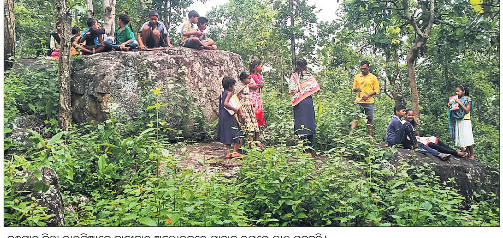
କନ୍ଧମାଳ ଜିଲ୍ଲା ରାଜକିଆରେ ଛାତ୍ରାଛାତ୍ର ଅନୁଲୋଚନରେ ପାଠପଢ଼ା ପଢୁଛନ୍ତି ।

ରାଜକିଆ, ୨୭(ଡି.ଏନ୍.ଏ.) କରୋନା ଯୋଗୁ ସବୁଠାରୁ ଅଧିକ ପ୍ରଭାବିତ ହେଉଛନ୍ତି ଛାତ୍ରାଛାତ୍ର । ଏକ ଯୁବକକୁ କୋର୍ଟ ଚାଲାଇ କରିଛି ଅଭିଯୁକ୍ତ ଜଣକ ଗୋଲହରା ଥାନା ରକାବାର ବୋଲି ଜଣାପଡିଛି। ଏ ନେଇ ନଂ. ୧୫୫/୨୧ରେ ମାମଲା ରୁଜୁ କରାଯାଇଛି। ପ୍ରକାଶ ଯେ, ୨ ବର୍ଷ ପୂର୍ବେ ଭଲଯୁକ୍ତ ବନ୍ଧୁକ ସମ୍ପର୍କ ଆରମ୍ଭ ହୋଇଥିଲା। ଯୁବକ ଜଣକ ବିଭିନ୍ନ ସ୍ଥାନକୁ ମହିଳା ତାଙ୍କ ନେଇ ତାକୁ ନିଶାଶକ୍ତ କରାଇ ଅଶ୍ଵାଳ ଫୋଟ ଓ ଭିଡିଓ କରୁଥିଲେ। ଏହି ଭିଡିଓ ଦେଖିବା ମହିଳାଙ୍କୁ ବହୁବାର ଲକ୍ଷ୍ୟାଧିକ ଟଙ୍କା ମାଗି ନେଉଥିଲେ। ପରେ ମହିଳା ଜଣକ ବାଧ୍ୟ ହୋଇ ଥାନାରେ ଜଣାଇଥିଲେ। ମଙ୍ଗଳବାର ଭଲଯୁକ୍ତ ତତ୍ତ୍ଵର ମାମଲା କରାଯାଇଛି।