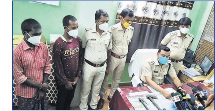
ଖବରଦାତା ସମ୍ମିଳନୀରେ ପୋଲିସ୍ ହତ୍ୟାକାରୀଙ୍କ ସମ୍ପର୍କରେ ସୂଚନା ଦେଇଛି।