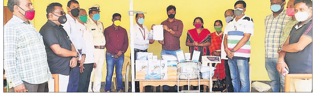
ବଇଞ୍ଚା ମେଡିକାଲକୁ ବିଭିନ୍ନ ଉପକରଣ ପ୍ରଦାନ କରାଯାଇଛି।