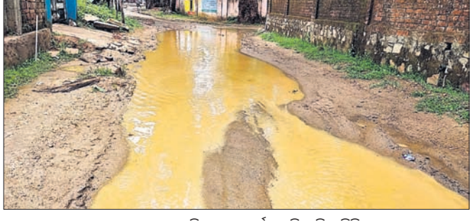
ରଞ୍ଜା ସ୍କୁଲ ଛକ ନିକଟରେ ବର୍ଷା ପାଣି ଜମି ରହିଛି।