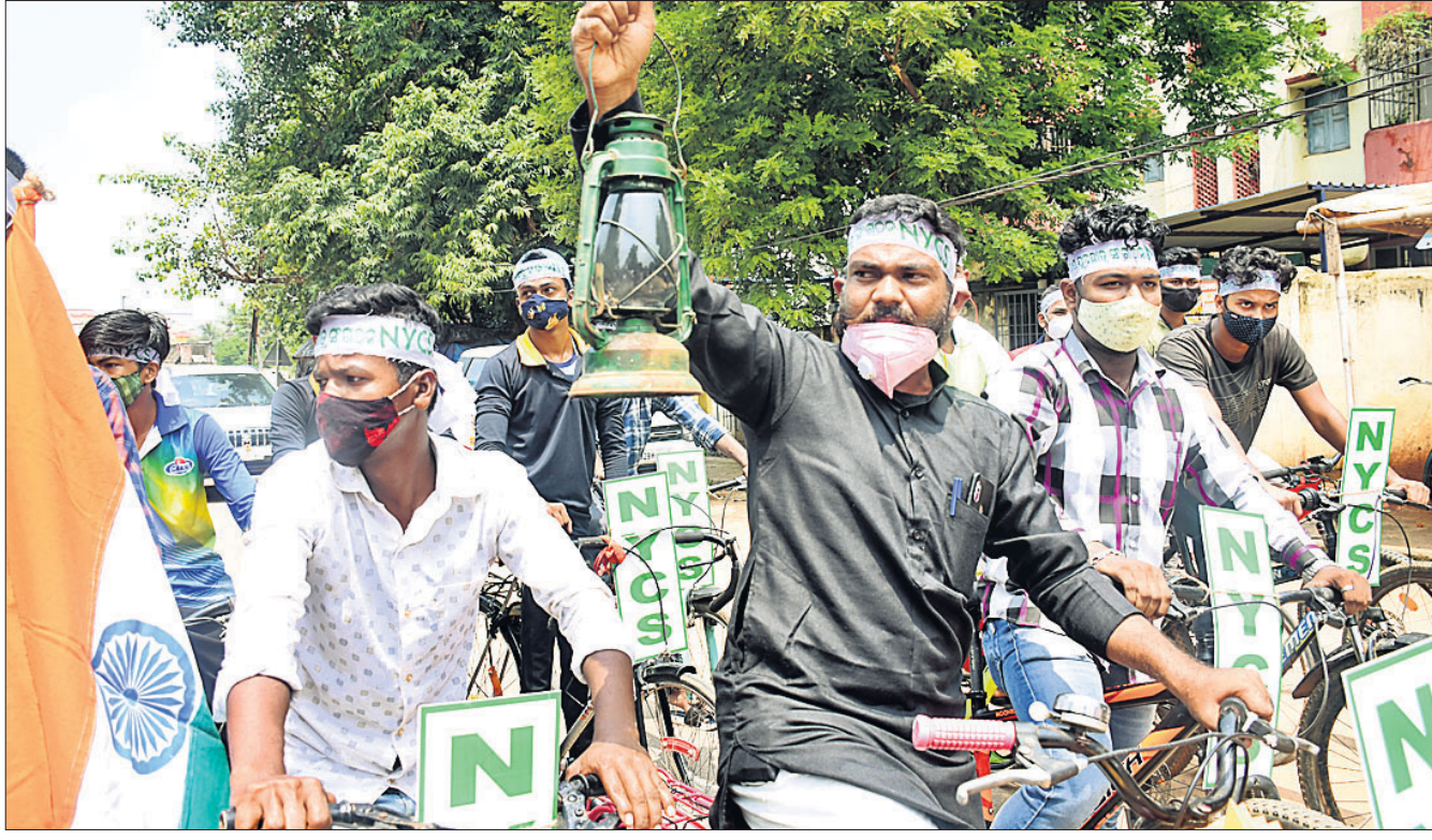
ପେଟ୍ରୋଲ ଓ ଡିଜେଲ ବର ବୃଦ୍ଧି ବିରୋଧରେ ଆସନ୍ତା ୧୩ ତାରିଖରେ ରାଜ୍ୟର ସମସ୍ତ ପେଟ୍ରୋଲ ପମ୍ପ ବନ୍ଦ ରଖିବାକୁ ଆହ୍ଵାନ କରି ନ୍ୟାଶନାଲ ଯୁବ କୋଅପରେଟିଭ ସୋସାଇଟି (ଏନ୍.ସି.ଏସି.ଏସି.ଏସି) ପକ୍ଷରୁ ମଙ୍ଗଳବାର ଭୁବନେଶ୍ଵର ଲକ୍ଷ୍ମୀସାଗରରୁ ବାହାରିଥିବା ସାଲକେଲ ଶୋଭାଯାତ୍ରା।