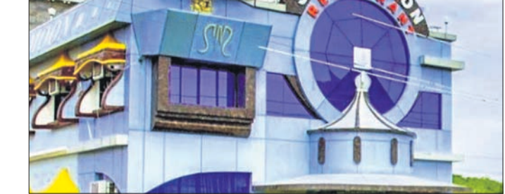
ସିଲଭର୍ ମୁନ୍ ହୋଟେଲ ।