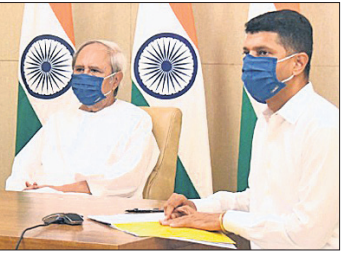
ଉଚ୍ଚପ୍ରମାଣ କ୍ଷ୍ମିରାଜ୍ଞ କମିଟି ବୈଠକରେ ପୁଞ୍ଜିମନ୍ତ୍ରୀ ନବୀନ ପଟ୍ଟନାୟକ, ୫-ଟି ବୃହତ୍ ଇସ୍ତାତ ଅନୁମୋଦନ କଲେ।

ରାଜ୍ୟରେ ୫ଟି ବୃହତ୍ ଇସ୍ତାତ ଶିଳ୍ପ ପ୍ରକଳ୍ପ ପ୍ରତିଷ୍ଠା ହେବ। ଏଥିରେ ୧ ଲକ୍ଷ ୪୬ ହଜାର ୧୭୨ କୋଟି ଟଙ୍କାର ପୁଞ୍ଜି ବିନିଯୋଗ ହେବ।