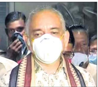
ଗଜପତି ମହାରାଜ ଦିବ୍ୟସିଂହ ଦେବ

ଚଳିତବର୍ଷର ରଥଯାତ୍ରାରେ ଛେରାପହରା କରିବାକୁ ନେଇ ଚାଲିଥିବା କଳ୍ପନାକଳ୍ପନାର ଅନ୍ତ ଘଟିଛି। ପୂର୍ବବର୍ଷ ଭଳି ଏଥର ମଧ୍ୟ ରଥଯାତ୍ରାରେ ଗଜପତି ମହାରାଜ ଛେରାପହରା କରିବେ ବୋଲି ଘୋଷଣା କରିଛନ୍ତି।