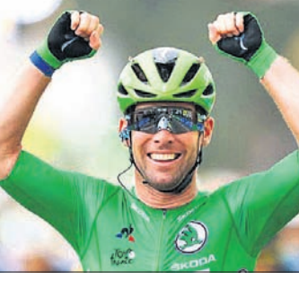
ଚତୁର୍ଥ ଓ ୬ଷ୍ଠ ଷ୍ଟେଜ୍ ଜିତିସାରିଛନ୍ତି। କାହ୍ନର ଫିଲିପସେନ୍ ଯଥାକ୍ରମେ ୧୯୦.୭ କିଲୋମିଟର ବିଶିଷ୍ଟ ଏହି

ପ୍ୟାରିସ, ୬/୭: ଗ୍ରେଟ୍ ବ୍ରିଟେନର ମାକ୍ କାଭେଣ୍ଡିସ୍ ଚୁରୁ ଡି'ପ୍ରାନ୍ସର ୧୦ମ ଷ୍ଟେଜ୍ ବିଜେତା ହୋଇଛନ୍ତି। ତାଙ୍କ କ୍ୟାରିୟରର ଏହା ହେଉଛି ୩୩ତମ ଷ୍ଟେଜ୍ ବିଜୟ। ବେଲଜିୟମ କିରଦନ୍ତା ଏତି ମର୍ଟ୍ଟୁକ୍ ସର୍ବକାମାନ ରେକର୍ଡ୍ ସମକକ୍ଷ ହେବା ଲାଗି ସେ ଆଉ ଗୋଟିଏ ବିଜୟ ପଛରେ ରହିଛନ୍ତି। ଚଳିତବର୍ଷ ଡେସିଭିଜି କିକ୍ ଷ୍ଟେସ୍‌ର ଏହି ରାଇଡର ଏହା ପୂର୍ବରୁ