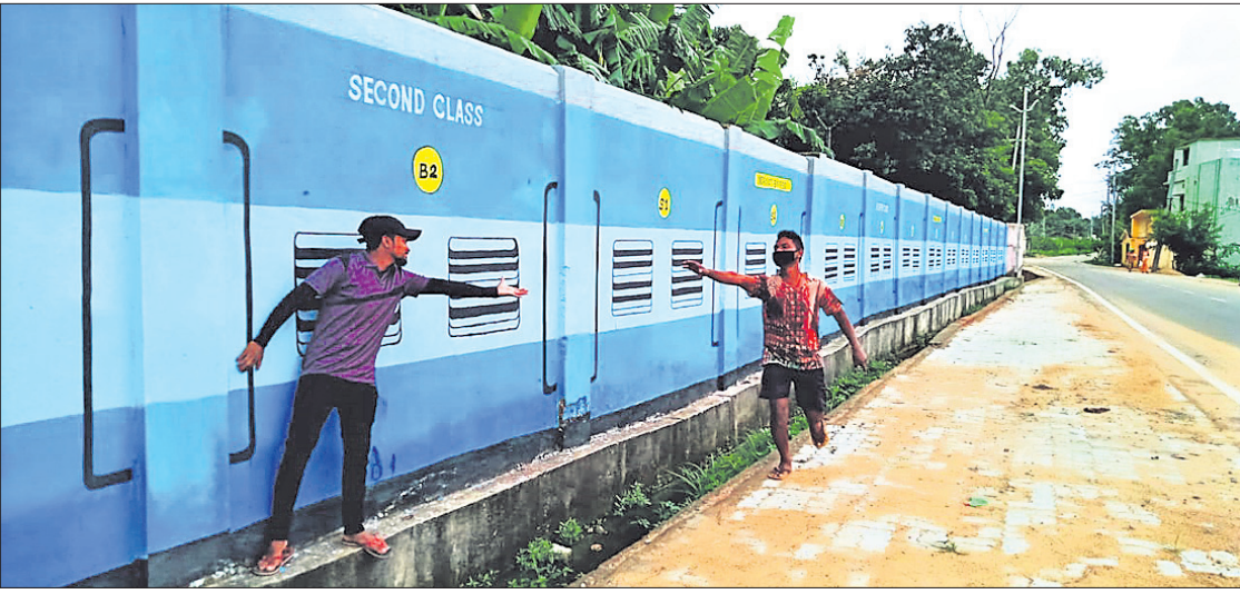
ନବରଙ୍ଗପୁରକୁ ରେଳପଥ ନ ଥିବାବେଳେ ଜିଲ୍ଲାପାଳଙ୍କ ଆବାସିକ କାର୍ଯ୍ୟାଳୟ କାନ୍ଧରେ ଅକାୟାଳିଆ ଟ୍ରେନ୍ ଚିତ୍ର ଆଗରେ ଲୋକେ ଫଟୋ ଉଠାଉଛନ୍ତି।