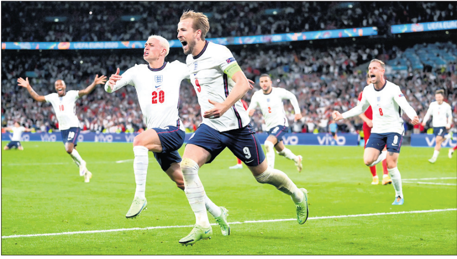
ହ୍ୟାରି କେନ୍ଦ୍ର ବିଜୟ ପୂର୍ବକ ଗୋଲ ପରେ ଇଂଲଣ୍ଡ ଖେଳାଳି ଖୁସି ମନାଉଛନ୍ତି।

ବାର୍ଷିକ ୫୫ ବର୍ଷ ପରେ ଇଂଲଣ୍ଡ କୋଣସି ମେଜର ଟୁର୍ନାମେଣ୍ଟର ଫାଇନାଲରେ ପ୍ରବେଶ କରିଛି। ବୁଧବାର ବିଜୟ ରାତିରେ ସ୍ଥାନୀୟ ଫ୍ରିଲେଣ୍ଡରମେଣ୍ଟର ଖେଳାଯାଇଥିବା ସଂଘର୍ଷପୂର୍ଣ୍ଣ ବିପକ୍ଷରେ ସେମିଫାଇନାଲ ମ୍ୟାଚ୍ରେ ଇଂଲଣ୍ଡ ୨-୧ ଗୋଲରେ ଟେନ୍ଦ୍ରାକକୁ ହରାଇ ପାଇନାଲରେ ପ୍ରବେଶ କରିଛି। ପ୍ରଥମ ପହଚରେ ଥିଲେ ମଧ୍ୟ ଇଂଲଣ୍ଡ ପ୍ରତ୍ୟାବର୍ତ୍ତନ କରି ବିଜୟୀ ହେବା ସହ ବାର୍ଷିକ ପ୍ରତ୍ୟାକ୍ଷର ଅଞ୍ଚଳ ଗଢ଼ାଇଛି। ରବିବାର ପାଇନାଲ ମ୍ୟାଚ୍ରେ ଇଂଲଣ୍ଡ ଓ ଇଟାଲୀ ପ୍ରତ୍ୟାକ୍ଷ ହେବେ। ୧୯୬୬ ବିଶ୍ୱକପରେ ଚାମ୍ପିୟନ ହୋଇ ଇଂଲଣ୍ଡ ପ୍ରଥମଥର ପାଇଁ କୋଣସି ଅନ୍ତର୍ଜାତୀୟ ଚାଳଚଳ ହାସଲ କରିଥିଲା। ଏହାପରେ ଇଂଲଣ୍ଡ ମଧ୍ୟ ପ୍ରଥମଥର ପାଇଁ ଯୁରୋକପ୍ ପାଇନାଲ ପୁନାବଳୀରେ ଅବତୀର୍ଣ୍ଣ ହେବା। ଏହାପୂର୍ବରୁ ଇଂଲଣ୍ଡ ବିଶ୍ୱକପ୍ କ୍ରମେ ଯୁରୋକପ୍ରେ ୪ଟି ସେମିଫାଇନାଲରେ ପରାସ୍ତ ହୋଇଥିଲା। ତେଣୁ ଏହି ବିଜୟ ଏବେ ଇଂଲଣ୍ଡ ପାଇଁ ଐତିହାସିକ ସାବ୍ୟସ୍ତ ହୋଇଛି। ୧୯୯୦,