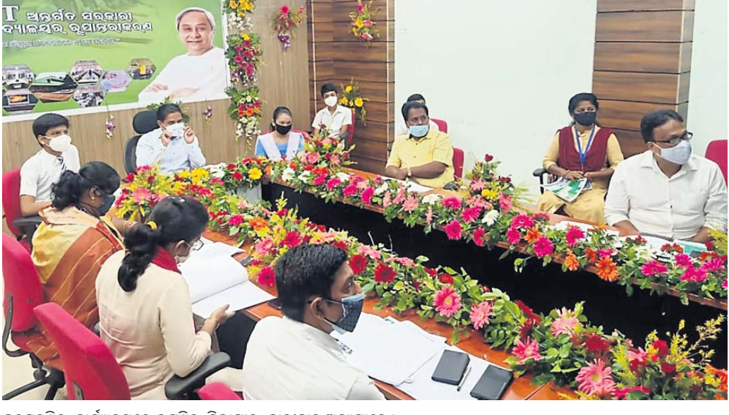
ଛତ୍ରପୁରସ୍ଥିତ କାର୍ଯ୍ୟାଳୟରେ ଉପସ୍ଥିତ ଜିଲ୍ଲାପାଳ, ଛାତ୍ରୀଛାତ୍ର ଅନ୍ୟମାନେ ।