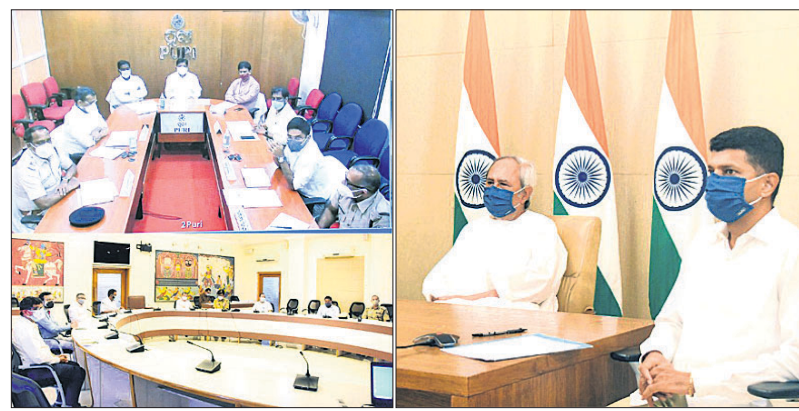
ଭିଡିଓ କନଫରେନ୍ସରେ ମୁଖ୍ୟମନ୍ତ୍ରୀଙ୍କ ଦ୍ୱାରା କରାଯାଇଥିବା ରଥଯାତ୍ରା ପ୍ରସ୍ତୁତି ସମୀକ୍ଷା ବୈଠକରେ ଉପସ୍ଥିତ ଅଧିକାରୀ।