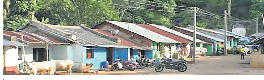
ବିନ୍ୟାସରୁ ଗ୍ରାମ ।

ସରକାର । ସେମାନଙ୍କ ବ୍ୟବସାୟ ପାଇଁ ସହାୟକ ଗାଁ ପାହାଡ଼ଠାରେ ନିର୍ମାଣ ଚାଲିଛି । ବିନ୍ୟାସରୁ ଜଳୋନୀ ନାମକ ଅନ୍ୟ ଏକ ଗ୍ରାମ । ବିନ୍ୟାସରୁରେ ବ୍ୟବସାୟ କରୁଥିବା ଆଦିବାସୀ ସମ୍ପ୍ରଦାୟର ଲୋକେ ବିଗତ ୬୦ ବର୍ଷ ହେବ ଏଠାରେ ଗଣ୍ୟବସ କରି ଚଳି ଆସୁଥିଲେ । ପ୍ରକଳ୍ପ ଯୋଗୁ ଶିକ୍ଷିତ ହେଉଥିବା ଲୋକଙ୍କୁ ପରିବାର