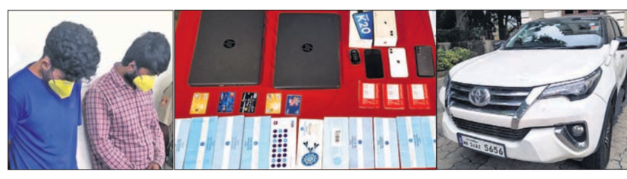
ଗିରଫ ଅଭିଯୁକ୍ତ, କଟକ ପାସପୁର, ମୋବାଇଲ୍ ଓ କାର।