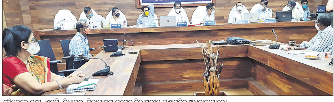
ଦେଶାନ୍ତ ଅଫିସ୍, ୮୭

ବୈଠକରେ ମନ୍ତ୍ରୀ, ଏମ୍ପି, ବିଧାୟକ, ଜିଲ୍ଲାପାଳଙ୍କ ସମେତ ଜିଲ୍ଲାସ୍ତରୀୟ ପ୍ରଶାସନିକ ଅଧିକାରୀମାନେ।