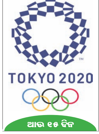
ଆଉ ୧୫ ଦିନ

ଟୋକିଓ, ୮୭ (ଏପି): ଟୋକିଓ ଅଲିମ୍ପିକ୍ସରେ ଦର୍ଶକଙ୍କୁ ସମ୍ପୂର୍ଣ୍ଣ ନିଷିଦ୍ଧ କରାଯାଇଛି। ଗୁରୁବାର ଜରୁରିକାଳୀନ ପରିସ୍ଥିତି ଜାରି ପରେ ଅଲିମ୍ପିକ୍ ମନ୍ତ୍ରୀ ଚାମାୟୋ ମାତୁକାଓ ଏକ ଜାପାନିକ୍ ସ୍ପୀଚ୍ ଏକେମ୍ପ୍ଟ୍ ସହା କହିଛନ୍ତି। ଅନ୍ତର୍ଜାତୀୟ ଅଲିମ୍ପିକ୍ କମିଟି ଓ ଜାପାନର ଆୟୋଜକଗଣ ତରଫରୁ ନିଜିତ ଭାବେ ନିଷ୍ପତ୍ତି ନିଆଯାଇଛି। ଫଳରେ ଏଥର ଗସ୍ତ ଏକ ଚିଲି ଇତିହାସରେ ପରିଣତ ହୋଇଛି। କିଛିମାସ ପୂର୍ବରୁ ବିଦେଶୀ ଦର୍ଶକଙ୍କ ଉପରେ କଟକଣା ଜାରି ହୋଇସାରିଛି। ଜାପାନ ପ୍ରଧାନମନ୍ତ୍ରୀ ଯୋଶିଦେ ସୁଗା କ୍ଷୟ କରିଛନ୍ତି ଯେ ଇନ୍ଦୋର ହେଉ ଅବା ଆଉଟ୍ରେଟାର୍ ବିନା ଦର୍ଶକରେ ପ୍ରତିଯୋଗିତା ହେବ। ଅନ୍ତର୍ଜାତୀୟ