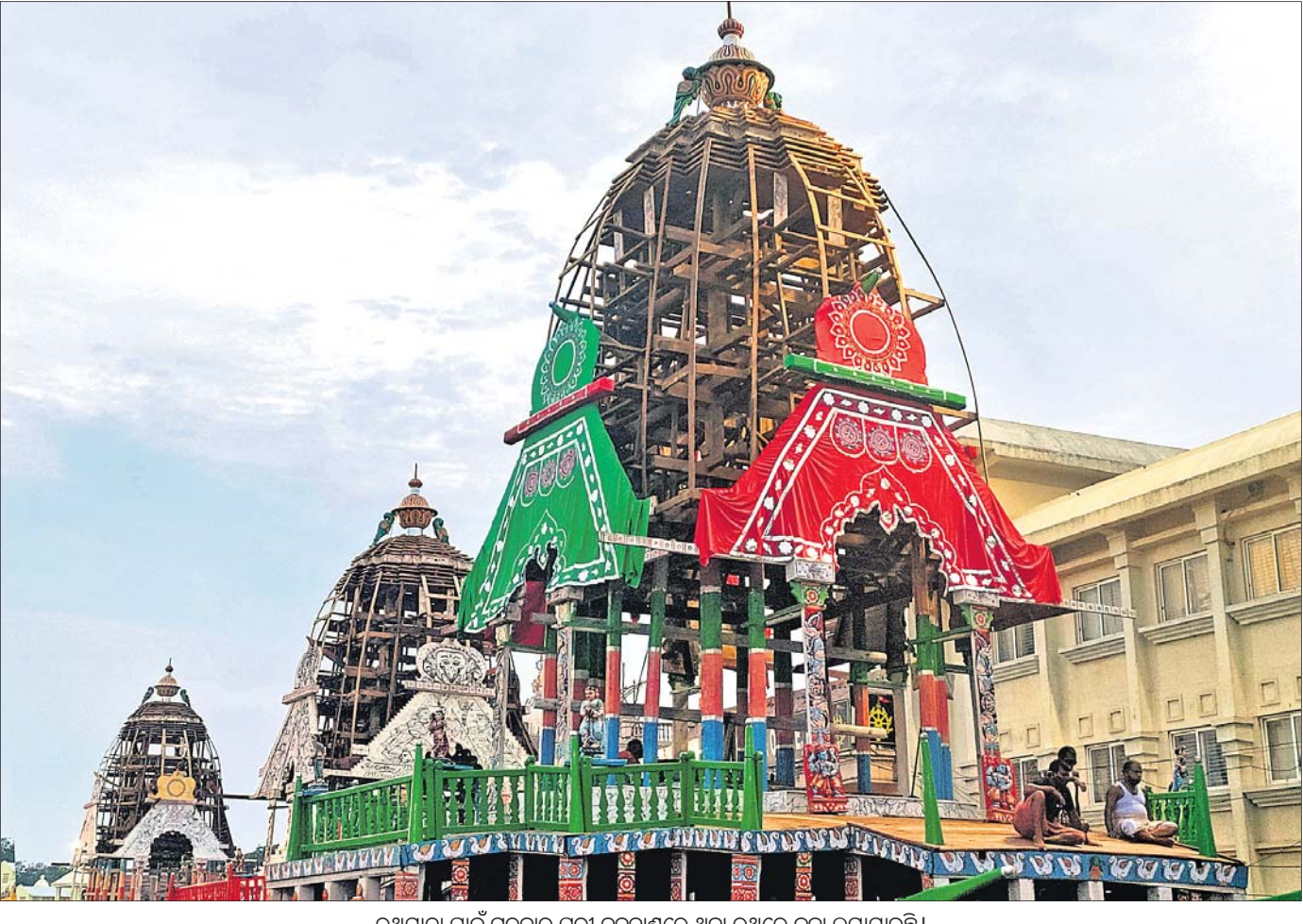
ରଥଯାତ୍ରା ପାଇଁ ଗୁରୁବାର ପୁରୀ ବଡ଼ଦାଣ୍ଡରେ ଥିବା ରଥରେ କମା ଲଗାଯାଇଛି।