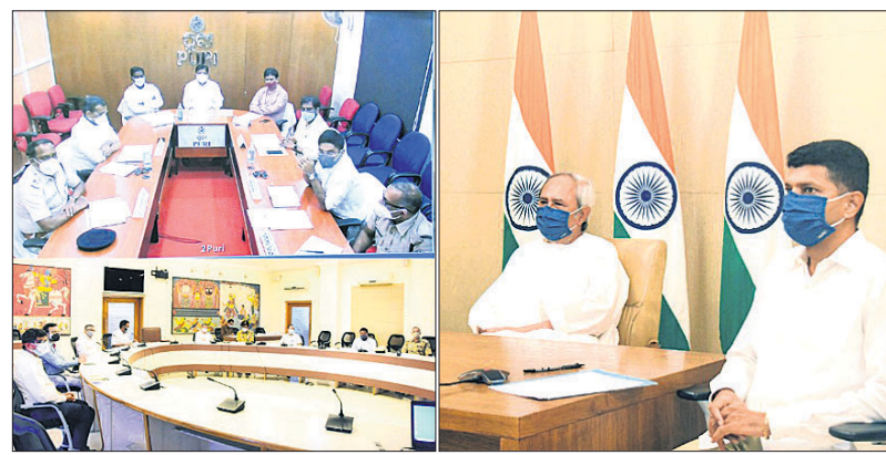
ଭିଡିଓ କନଫରେନ୍ସରେ ମୁଖ୍ୟମନ୍ତ୍ରୀଙ୍କ ସ୍ୱାଗତା କରାଯାଇଥିବା ରଥଯାତ୍ରା ପ୍ରସ୍ତୁତି ସମୀକ୍ଷା ବୈଠକରେ ଉପସ୍ଥିତ ଅଧିକାରୀ।