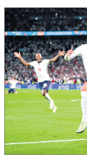
ହ୍ୟାରି କେନ୍‌ଙ୍କ ବିଜୟ ସ୍ୱତନ୍ତ୍ର ଗୋଲ ପରେ ଇଂଲଣ୍ଡ ଖେଳାଳି ଖୁସି ମନାଉଛନ୍ତି।

ଲଣ୍ଡନ, ୮୮ ଦୀର୍ଘ ୫୫ ବର୍ଷ ପରେ ଇଂଲଣ୍ଡ କୌଣସି ମେଜର ଚୁନାମେଣ୍ଟର ପାଇନାଲରେ ପ୍ରବେଶ କରିଛି।