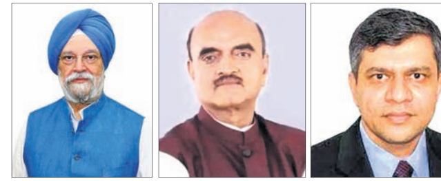
ହରଦୀପ ସିଂ ପୁରୀ, ଭାରତ ଚିନ୍ତନ ରାଓ କରାଡ, ଅଶ୍ୱିନୀ ବୈଷ୍ଣବ

ହରଦୀପ ସିଂ ପୁରୀ ଗୁରୁବାର ପେଟ୍ରୋଲିୟମ ମନ୍ତ୍ରଣାଳୟର କାର୍ଯ୍ୟଭାର ସମ୍ଭାଳିଛନ୍ତି। ସେ ପୂର୍ବରୁ ରାଷ୍ଟ୍ରମନ୍ତ୍ରୀ ପଦରେ ଥିଲେ। ତାଙ୍କ କାର୍ଯ୍ୟ ଉପରେ ପ୍ରଧାନମନ୍ତ୍ରୀ ନରେନ୍ଦ୍ର ମୋଦି ସତର୍କତା ଦେଖାଇଛନ୍ତି।