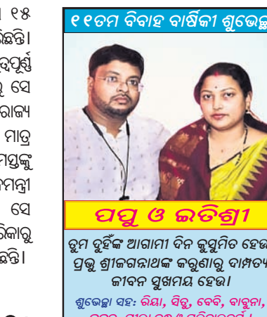
ପପୁ ଓ ଜର୍ଜିନୀ

କରୋନା ସଂକ୍ରମଣ ସଂଖ୍ୟା ବର୍ଦ୍ଧମାନ ହୁଏ ହେଉଥିବାରୁ ଅତ୍ୟାବଶ୍ୟକ କରକଣା ଚାହିଦା ହେଉଥିବାରୁ ଗାଡି ବିକ୍ରି ବୃଦ୍ଧି ହେଉଥିବା ନଜରକୁ ଆସିଛି।