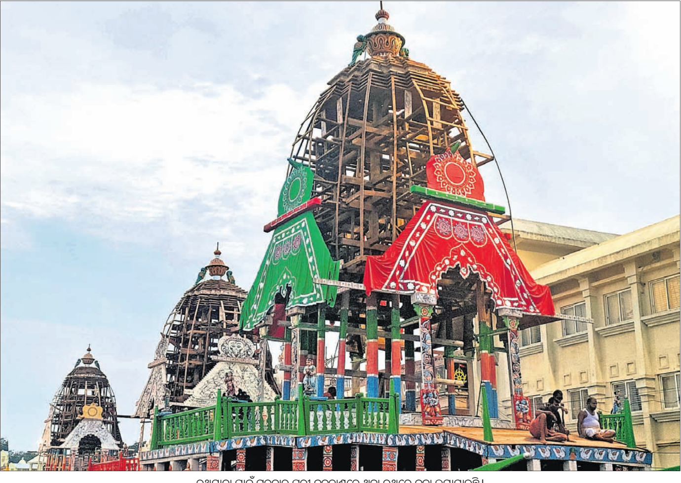
ରଥଯାତ୍ରା ପାଇଁ ଗୁରୁବାର ପୁରୀ ବଡ଼ଦାଣ୍ଡରେ ଥିବା ରଥରେ କନା ଲଗାଯାଇଛି।