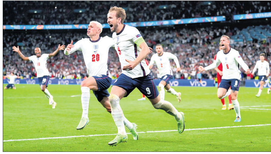
ହ୍ୟାରି କେନ୍ସ୍ ବିଜୟ ସ୍ୱତନ୍ତ୍ର ଗୋଲ ପରେ ଇଂଲଣ୍ଡ ଖେଳାଳି ଖୁସି ମନାଉଛନ୍ତି।

ବାର୍ଷିକ ୫୫ ବର୍ଷ ପରେ ଇଂଲଣ୍ଡ କୌଣସି ମେଜର ଟୁର୍ନାମେଣ୍ଟର ଫାଇନାଲରେ ପ୍ରବେଶ କରିଛି। ବୁଧବାର ବିଜୟ ରାତିରେ ସ୍ଥାନୀୟ ଫ୍ରିୟେଲଡନରେ ଖେଳାଯାଇଥିବା ସଂଘର୍ଷପୂର୍ଣ୍ଣ ବିପତୀୟ ସେମିଫାଇନାଲ ମ୍ୟାଚ୍ରେ ଇଂଲଣ୍ଡ ୨-୧ ଗୋଲରେ ଡେହଳି ହୋଇଥିଲା। ପ୍ରଥମ ପହରେ ଥିଲେ ମଧ୍ୟ ଇଂଲଣ୍ଡ ପ୍ରତ୍ୟାବର୍ତ୍ତନ କରି ବିଜୟୀ ହେବା ସହ ବାର୍ଷିକ ପ୍ରଥମଥର ଅଧିକାରୀ ହୋଇ ଫାଇନାଲ ମ୍ୟାଚ୍ରେ ଇଂଲଣ୍ଡ ଓ ଜର୍ମାନୀ ମୁହାଁମୁହିଁ ହେବେ। ୧୯୬୬ ବିଶ୍ୱକପରେ ଚାମ୍ପିୟନ ହୋଇ ଇଂଲଣ୍ଡ ପ୍ରଥମଥର ପାଇଁ କୌଣସି ଅନ୍ତର୍ଜାତୀୟ ଚାଲଚଳ ହାସଲ କରିଥିଲା। ଏହାପରେ ଇଂଲଣ୍ଡ ମଧ୍ୟ ପ୍ରଥମଥର ପାଇଁ ଯୁରୋକପ୍ ଫାଇନାଲ ପୁନାବିଲରେ ଅବତୀର୍ଣ୍ଣ ହେବା। ଏହାପୂର୍ବରୁ ଇଂଲଣ୍ଡ ବିଶ୍ୱକପ୍ କ୍ରମେ ଯୁରୋକପ୍ରେ ୪ଟି ସେମିଫାଇନାଲରେ ପରାସ୍ତ ହୋଇଥିଲା। ତେଣୁ ଏହି ବିଜୟ ଏବେ ଇଂଲଣ୍ଡ ପାଇଁ ଐତିହାସିକ ସାବ୍ୟସ୍ତ ହୋଇଛି। ୧୯୯୦,