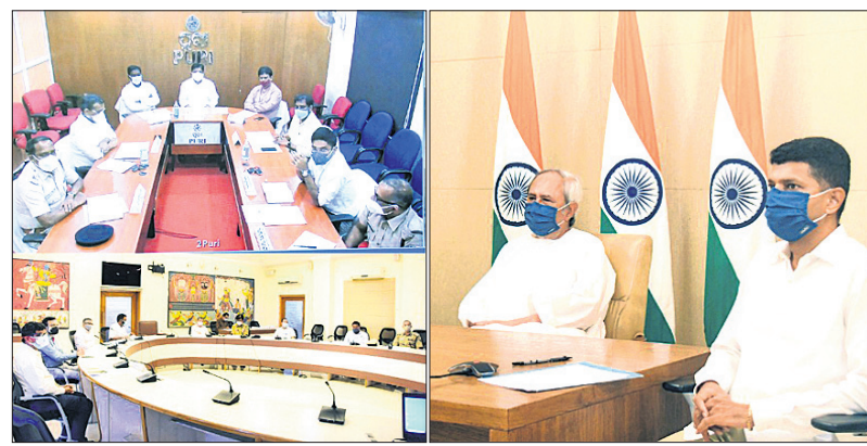
ଭିଡ଼ିଓ କନଫରେନ୍ସରେ ମୁଖ୍ୟମନ୍ତ୍ରୀଙ୍କ ଦ୍ୱାରା କରାଯାଇଥିବା ରଥଯାତ୍ରା ପ୍ରସ୍ତୁତି ସମୀକ୍ଷା ବୈଠକରେ ଉପସ୍ଥିତ ଅଧିକାରୀ।

ପୁରୀ ଅଧିକାରୀ/କୁବେରଶର (ସ୍ୱାଭାବ), ୮୭ ଶ୍ରୀକ୍ଷେତ୍ରର ବିଶ୍ୱପ୍ରସିଦ୍ଧ ରଥଯାତ୍ରା ପାଇଁ ପ୍ରସ୍ତୁତି ଶେଷ ପର୍ଯ୍ୟାୟରେ ପହଞ୍ଚିବାବେଳେ ଗୁରୁବାର ମୁଖ୍ୟମନ୍ତ୍ରୀ ନବୀନ ପଟ୍ଟନାୟକ ଭିଡ଼ିଓ କନଫରେନ୍ସ ମାଧ୍ୟମରେ ଏ ନେଇ ସମୀକ୍ଷା କରିଛନ୍ତି। ଗତବର୍ଷ ବିନା ଭକ୍ତରେ ରଥଯାତ୍ରା ସୁରୁଖୁରୁରେ ସମ୍ପନ୍ନ ହୋଇଥିବାରୁ ମୁଖ୍ୟମନ୍ତ୍ରୀ ସମସ୍ତଙ୍କୁ ଧନ୍ୟବାଦ ଦେଇଛନ୍ତି। ଚଳିତ ବର୍ଷ ମଧ୍ୟ କୋଭିଡ୍ କଟକଣା ମଧ୍ୟରେ ବିନା ଭକ୍ତରେ କିଭଳି ଭାବେ ରଥଯାତ୍ରା ସୁରୁଖୁରୁରେ ସମ୍ପନ୍ନ ହେବ ଏବଂ ଶ୍ରଦ୍ଧାଳୁମାନେ ଘରେ ରହି ଘୋଷଯାତ୍ରା ଦେଖିପାରିବେ ସେନେଇ ମୁଖ୍ୟମନ୍ତ୍ରୀ ପୁରୀ ସହରବାସୀ ଓ ସେବାୟତମାନଙ୍କ ସହଯୋଗ କାମନା କରିଛନ୍ତି। ଧାର୍ଯ୍ୟ ସମୟରେ ସମସ୍ତ ନୀତିକାନ୍ତି ସହ ରଥଯାତ୍ରାକୁ ସୁତାରୁ ରୂପେ ସମ୍ପନ୍ନ କରାଯିବାରୁ ଉପରେ ମୁଖ୍ୟମନ୍ତ୍ରୀ ଗୁରୁତ୍ୱ ଦେଇଛନ୍ତି। ବୈଠକରେ ଅଧ୍ୟକ୍ଷତା କରି ମୁଖ୍ୟମନ୍ତ୍ରୀ କହିଛନ୍ତି, ଗତବର୍ଷ ପରି ଚଳିତ ବର୍ଷ ମଧ୍ୟ ମହାପ୍ରଭୁଙ୍କ