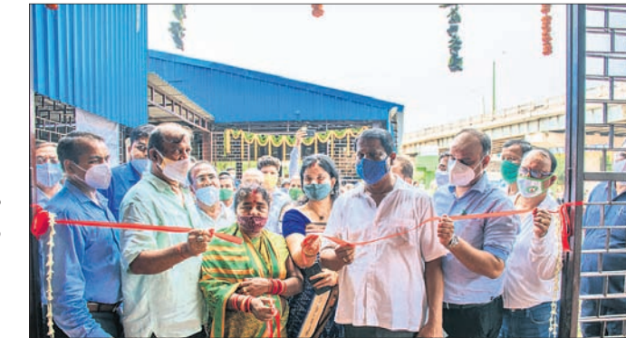
ପାଇଲଟ ପ୍ରୋଜେକ୍ଟରେ ଆରମ୍ଭ ହୋଇଥିବା ଏହି ପ୍ରକଳ୍ପରେ ବର୍ତ୍ତମାନ ସମ୍ପୂର୍ଣ୍ଣ ପ୍ରକଳ୍ପର ଉଦ୍‌ଘାଟନ ହେବ।

ପଞ୍ଚା ଉଦ୍‌ଘାଟନ କରିଛନ୍ତି। ଏଥିସହ 'ସଫେଇ ଗାଡ଼ି' ମଧ୍ୟ ଉଦ୍‌ଘାଟନ କରିଥିଲେ। ସହରରେ ୪୩ ଏମ୍.ସି.ସି ଓ ୧୦ ଏମ୍.ଆର୍.ଏମ୍. ସ୍ଥାପନ ଯୋଜନା ରହିଥିବାବେଳେ ଲିମିଟସରେ ୧୮ ଏମ୍.ସି.ସି ଓ ୨ ଏମ୍.ଆର୍.ଏମ୍. କାର୍ଯ୍ୟକାରୀ ହୋଇଛି।