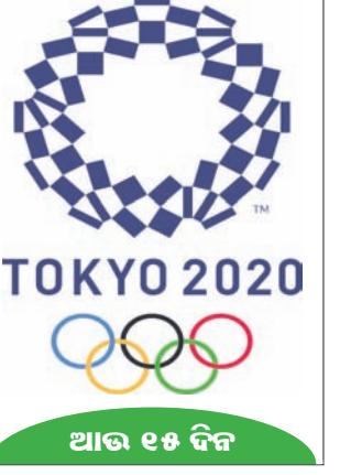
ଆଉ ୧୫ ଦିନ