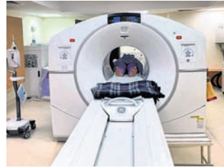
ରୁକ୍ଷିଆ ପିଇଟି ସିଟି ଖାନ ସ୍ଥାପନ ନେଇ ହାଇକୋର୍ଟରେ ଏକ ମାମଲା ଦାଏର

କରିଥିଲେ। ଏନେଇ ରାଜ୍ୟ ସରକାର ହାଇକୋର୍ଟରେ ଦାଖଲ କରିଥିବା ସତ୍ୟପାଠରେ ଦର୍ଶାଯାଇଛି, ଏବେ ରାଜ୍ୟରେ କେଉଁଠି ପିଇଟି ସିଟି ଖାନ ଖୋଲିବାକୁ ସର୍ତ୍ତାବଳୀ ସମ୍ପୂର୍ଣ୍ଣ ଭାବେ ଉପଲବ୍ଧ ନୁହେଁ।