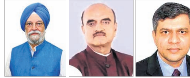
ହରଦୀପ ସିଂ ପୁରୀ, ଭାରତର କିଶନ ରାଓ କରାଟ, ଅଶ୍ୱିନୀ ବୈଷ୍ଣବ

ହରଦୀପ ସିଂ ପୁରୀ ଗୁରୁବାର ପେଟ୍ରୋଲିୟମ ମନ୍ତ୍ରଣାଳୟର କାର୍ଯ୍ୟଭାର ସମ୍ଭାଳିଛନ୍ତି।