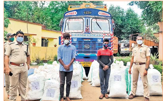
ଜବତ ଗଞ୍ଜେଇ ଓ ଗିରଫ ଅଭିଯୁକ୍ତମାନେ।