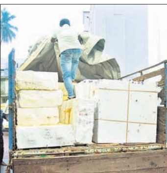
ଦ୍ୱି-ପହ ଏ ଓ ଚର୍ଚ୍ଚିତ ଭୋଗମଣ୍ଡପ ହାର ରୂପା ଛାଉଣି କରାଯିବାକୁ ଶ୍ରୀମନ୍ଦିର ପ୍ରଶାସନ ପକ୍ଷରୁ ନିଶ୍ଚିତ ନିଆଯାଇଛି।