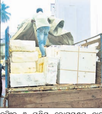
ଶ୍ରୀମନ୍ଦିରର ୮ ଦ୍ୱାର ହେବ ରୂପା ଛାଉଣି

ଏଥିପାଇଁ ନୀଳାଦ୍ରି ଉତ୍ତରୀୟରେ ପ୍ରାଥମିକ ପର୍ଯ୍ୟାୟରେ ୩ ଦ୍ୱାରର କାର୍ଯ୍ୟ ଆରମ୍ଭ ହୋଇଛି।