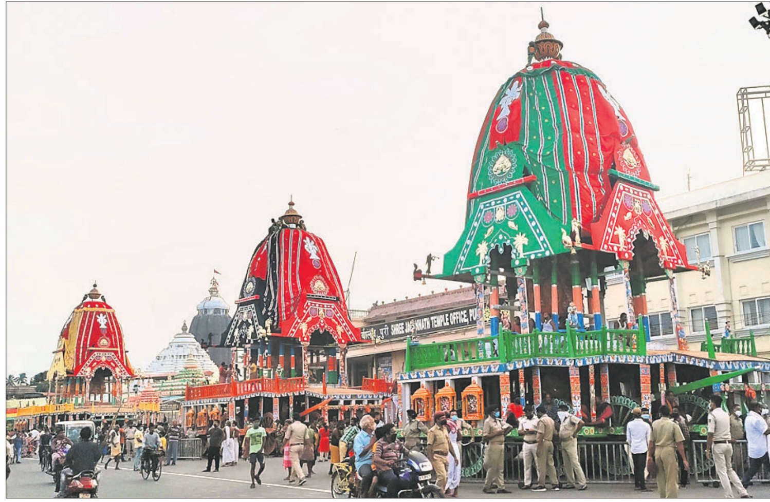
ଦିନକ ପରେ ଘୋଷଯାତ୍ରା: ପୁରୀ ରଥଖଳାରେ ପ୍ରସ୍ତୁତ ତିନି ରଥ ।