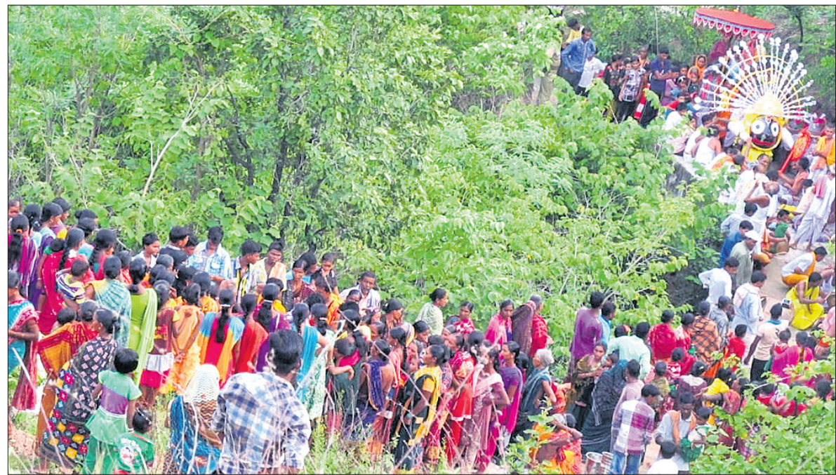
କୋଟପଲାଇଭିତ ପାତାଳି ଶ୍ରୀକ୍ଷେତ୍ରରେ ଠାକୁରଙ୍କ ପହଣ୍ଡି।