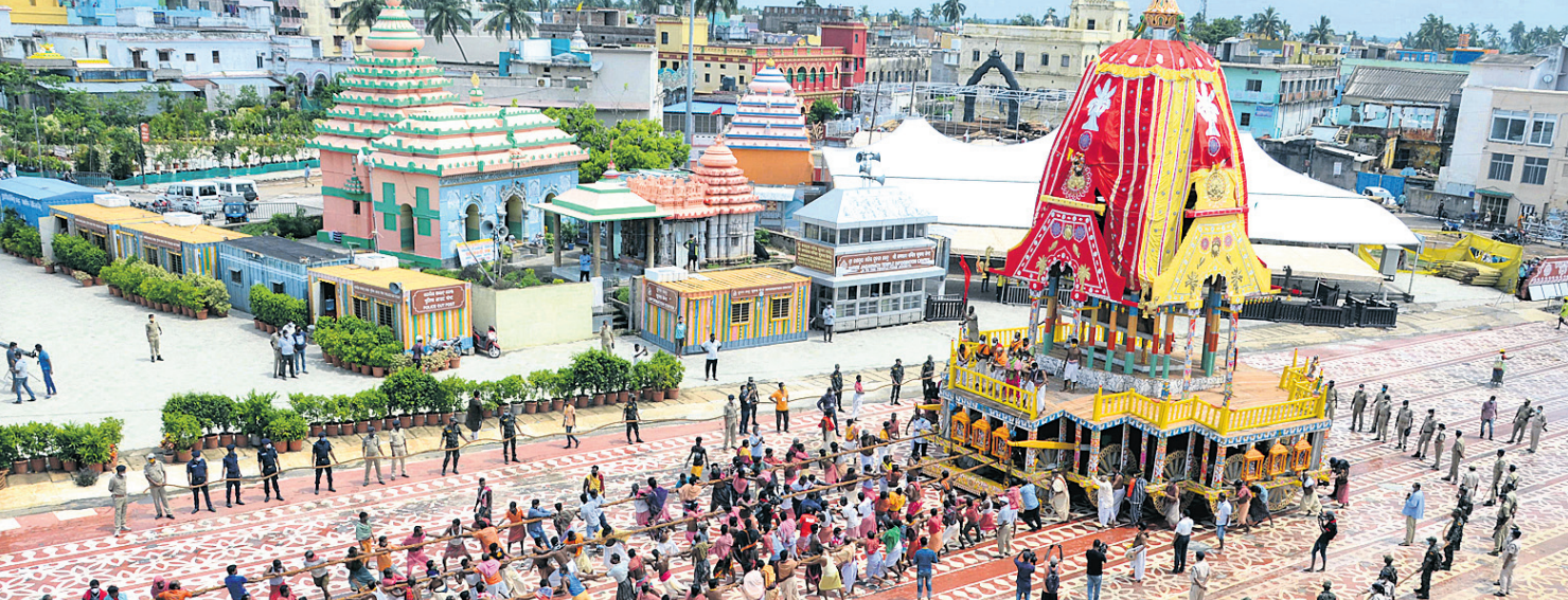
ଘୋଷଯାତ୍ରା ପାଇଁ ବଡ଼ବାଣ୍ଡରେ ନିର୍ଦ୍ଦେଶ ଦେଖିବାକୁ ରହିବାର ଦକ୍ଷିଣମୋଡ଼ କରାଯାଇ ସିଂହଦ୍ୱାର ସମ୍ମୁଖକୁ ସେବାୟତମାନେ ଚାଣି ନେଉଛନ୍ତି ।