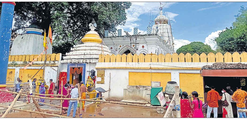
ସିଂହଦ୍ୱାର ନିକଟରେ ଶ୍ରୀକ୍ଷେତ୍ରରେ ଦିଅଁ ଦର୍ଶନ କରୁଛନ୍ତି।