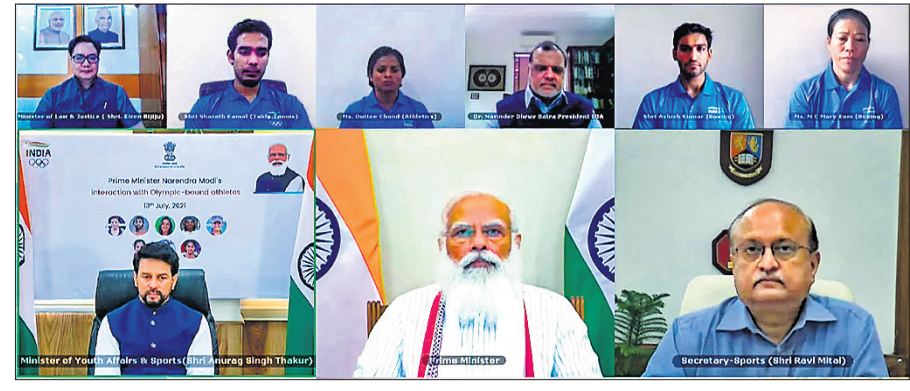
ଆଧିକାରୀଙ୍କ ସହ କଥାହେବା ଅବସରରେ ପ୍ରଧାନମନ୍ତ୍ରୀ ନରେନ୍ଦ୍ର ମୋଦି, କ୍ରୀଡ଼ାମନ୍ତ୍ରୀ ଅରୁଣା ଠାକୁର ଓ ଅନ୍ୟମାନେ।

ରଞ୍ଜିତ ସମୟରେ ମାନସିକ ପ୍ରସ୍ତୁତି ପ୍ରଦାନ କରିବାକୁ ପଡ଼ିଥାଏ। ପୂର୍ବ ଯୋଗ୍ୟତା ଜାଣିବା ପାଇଁ ଉତ୍ସାହ ପ୍ରକାଶ କରିଛନ୍ତି।