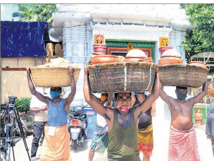
ଗୁଣ୍ଡିଚା ମନ୍ଦିରରୁ ଆଡ଼ପ ଅବତ୍ତା ଅଣାଯାଇଛି।