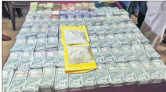
ଜବତ ବ୍ରାଉନସୁଗାର ଓ ଚଢ଼ା ।

କୋଲକାତାରୁ ଭାୟା ବାଲେଶ୍ୱର ଦେଇ ଭୁବନେଶ୍ୱର ଆସୁଥିବା ବ୍ରାଉନସୁଗାର ଓ ଚଢ଼ା ଜବତ ହୋଇଛି। କୋଲକାତାରେ ଏକାଧିକ ଡିଲର ଚଢ଼ା କାରବାର କରିବାରେ ଲାଗିପାରିଥିବା ଜଣାପଡ଼ିଛି। ଭୁବନେଶ୍ୱରରେ ମଧ୍ୟ ଚଢ଼ା କାରବାର ଚାଲିଥିବା ଜଣାପଡ଼ିଛି। ଏହି ଚଢ଼ା କାରବାରର ମାଧ୍ୟମରେ ଭୁବନେଶ୍ୱରରେ ଚଢ଼ା କାରବାର ଚାଲିଥିବା ଜଣାପଡ଼ିଛି। ଏହି ଚଢ଼ା କାରବାରର ମାଧ୍ୟମରେ ଭୁବନେଶ୍ୱରରେ ଚଢ଼ା କାରବାର ଚାଲିଥିବା ଜଣାପଡ଼ିଛି। ଏହି ଚଢ଼ା କାରବାରର ମାଧ୍ୟମରେ ଭୁବନେଶ୍ୱରରେ ଚଢ଼ା କାରବାର ଚାଲିଥିବା ଜଣାପଡ଼ିଛି।