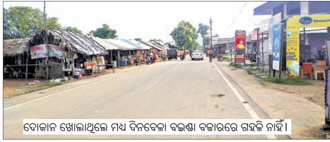
ବୋକାନ ଖୋଲାଥିଲେ ମଧ୍ୟ ଦିନବେଳା ବଜଣା ବଜାରରେ ଗହଳ ନାହିଁ।

ହେଁ ସବୁ କାରବାର ସାଧାରଣତଃ ସନ୍ଧ୍ୟା ସମୟରେ ବେଶି ହୋଇଥାଏ। ଦିନବେଳା ଚଟାପଟା ଖାଦ୍ୟ ପ୍ରତି ଲୋକଙ୍କ ମନରେ ସେତେଟା ଆଗ୍ରହ ଆସି ନ ଥାଏ।