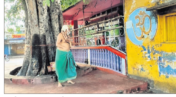
ଏମ୍.ଡି. ମହମ୍ମଦଙ୍କୁ ଉଦ୍ଧାର କରିଥିବା ପୂଜକ ।

ବର୍ତ୍ତମାନ ପଞ୍ଚାୟତ ସମିତି ବୈଠକ ରୁପ୍ତ ହେବା ପରେ ପରିସରରେ ଅନୁଷ୍ଠିତ ହୋଇଯାଇଛି ।