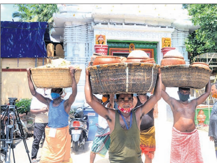
ଗୁଣ୍ଡିଚା ମନ୍ଦିରରୁ ଆଡ଼ପ ଅବତ୍ତା ଅଣାଯାଇଛି। ଶେଷ ହୋଇଥିଲା। ଫଳରେ ପହୁଡ଼ ପାଇଁ କରାଯିବା ପରେ ୪ଟା ୩୫ରେ ମହାପ୍ରଭୁ ସରିଥିଲା। ଏହାପରେ ବେଶ ପାଇଁ ପ୍ରସ୍ତୁତି କରାଯାଇ ପାଖାପାଖି ୫ଟା ୨୦ରେ ବେଶ ନାଗ ସାପ ଦଂଶନ କରିବା ପରେ ପରିବାର ଲୋକେ ତାଙ୍କୁ ରାଜସାପରୁ ଚିକିତ୍ସା କେନ୍ଦ୍ରକୁ ନେଇଥିଲେ।

ପୁରୀ ଅଫିସ, ୧୪୭ ରଥପାତ୍ରାଠାରୁ ଆରମ୍ଭ କରି ଆଡ଼ପମଣ୍ଡପ ବିଜେ ପର୍ଯ୍ୟନ୍ତ ସମସ୍ତ ନାଟକାନ୍ତ ନିର୍ଦ୍ଧାରିତ ସମୟ ପୂର୍ବରୁ ହୋଇଥିଲେ ମଧ୍ୟ ମଙ୍ଗଳବାର ରାତ୍ର ପହୁଡ଼ ନାଟି ହୋଇପାରିନାହିଁ।