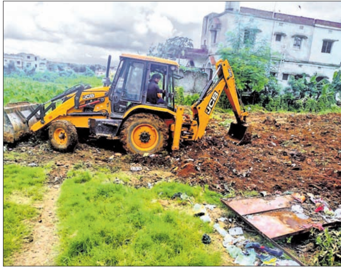
କୁଞ୍ଜକାନ୍ତ ମଧୁବନ ଅଞ୍ଚଳରେ ପ୍ରସ୍ତାବିତ ଶିଶୁ ଉଦ୍ୟାନ ।

ଅଞ୍ଚଳବାସୀଙ୍କ ଆନ୍ଦୋଳନ ଚେତାବନୀ ପ୍ରସ୍ତାବିତ ଜମିରେ ଶିଶୁ ଉଦ୍ୟାନ ଗଢ଼ି