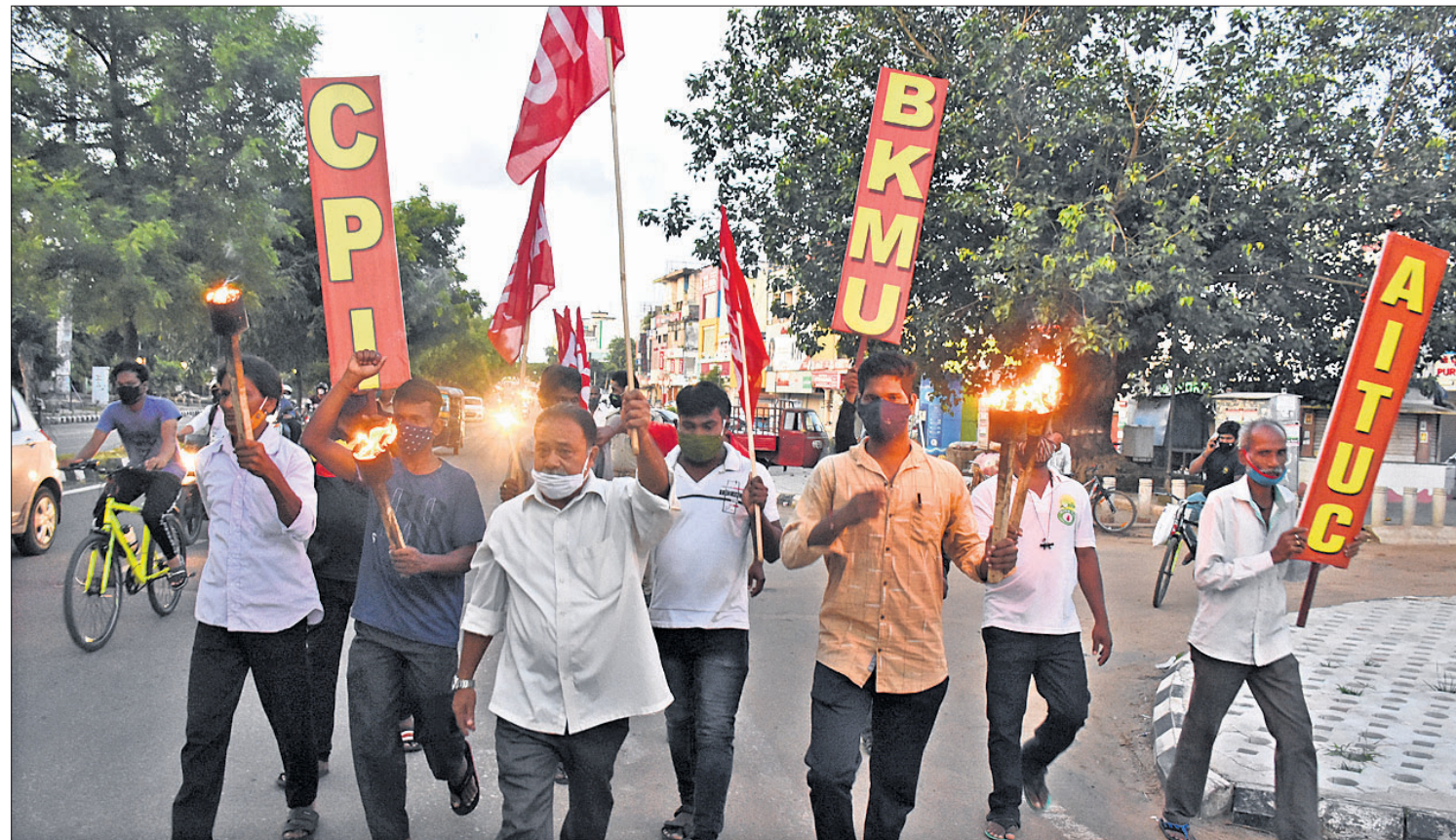
ଓଡ଼ିଶା ବନ୍ଦକୁ ସଫଳ କରିବା ପାଇଁ ବିଭିନ୍ନ ଦଳର ସମାଜ ସଭାରେ ଭୁବନେଶ୍ୱର ରାଜନେତାଙ୍କ ଛକକୁ ବାହାରିଥିବା ମଣ୍ଡଳ ରାଜି।