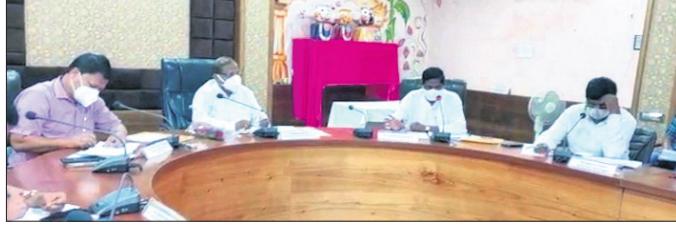
ବୈଠକରେ ଉପସ୍ଥିତ ମନ୍ତ୍ରୀ, ଲୋକ ପ୍ରତିନିଧି ଓ ଅଧିକାରୀମାନେ ।