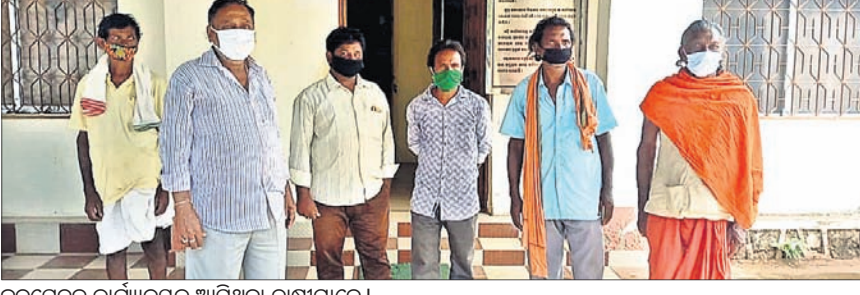
ଜଳସେଚନ କାର୍ଯ୍ୟକ୍ରମକୁ ଆସିଥିବା ଚାଷୀମାନେ।