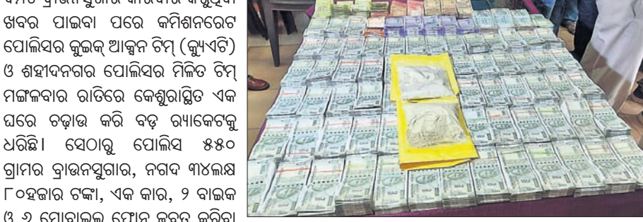
ଜବତ ବ୍ରାଉନସୁଗାର ଓ ଚକ୍କା ।

କୋଲକାତାରୁ ଭାରତୀୟ ବାଲେଶ୍ୱର ଦେଇ ଭୁବନେଶ୍ୱର ଆସୁଥିବା ବ୍ରାଉନସୁଗାର, ଚକ୍କା ଓ ଗାଞ୍ଜା ଜବତ ହୋଇଛି। ଗୋଟିଏ ଚକ୍କା ଡିଲରଙ୍କୁ ଗିରଫ କରାଯାଇଛି। ସେମାନେ ଭୁବନେଶ୍ୱର ସହରରେ ବ୍ରାଉନସୁଗାର ବ୍ୟବସାୟରେ ଯୋଗାଣ କରୁଥିବା ଜଣାପଡ଼ିଛି। ଏହାଛଡ଼ା ମହିଳାଙ୍କ ସମେତ ୨ ଜଣ ଗିରଫ ହୋଇଛନ୍ତି। ଏହାଛଡ଼ା ୨୦୦ କୋଟିରୁ ଅଧିକ ଚକ୍କା ଓ ଗାଞ୍ଜା ଜବତ ହୋଇଛି। ଏହାଛଡ଼ା ୨୦୦ କୋଟିରୁ ଅଧିକ ଚକ୍କା ଓ ଗାଞ୍ଜା ଜବତ ହୋଇଛି। ଏହାଛଡ଼ା ୨୦୦ କୋଟିରୁ ଅଧିକ ଚକ୍କା ଓ ଗାଞ୍ଜା ଜବତ ହୋଇଛି।