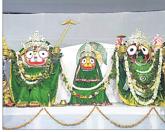
କୋରାପୁଟ ଶାବର ଶ୍ରୀକ୍ଷେତ୍ର ସମେତ ସୁନାବେଟା, କନ୍ଦପୁର ଏବଂ ଦାମନଯୋଡ଼ିଠାରେ ବୁଧବାର ଆପତ ମଞ୍ଚପରେ ମହାପ୍ରଭୁଙ୍କ ମସ୍ୟା, କଳ୍ପ ଓ ବରାହ ଅବତାର।