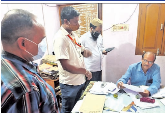
ସୁରକ୍ଷା କର୍ମୀମାନେ ସିଡିଏମ୍‌ଓଙ୍କୁ ଦାବିପତ୍ର ପ୍ରଦାନ କରୁଛନ୍ତି । ଦରମା ତୁରନ୍ତ ପ୍ରଦାନ କରିବା ପରି ଅନୁରୋଧ ଦ୍ୱାରା ଧାର୍ଯ୍ୟ ଦରମା ପ୍ରଦାନ କରିବାକୁ ଦାବି ରହିଛି । ସେହିପରି ଶ୍ରମ ବିଭାଗ ଦାବିପତ୍ରରେ ଉଲ୍ଲେଖ କରାଯାଇଛି ।