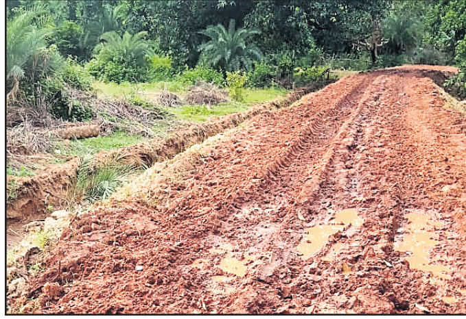
କାଦୁଅରେ ଭରି ବାଣିଗୋଛା ବନ୍ଧ-କାମିତିପଲ୍ଲା ରାସ୍ତା ।

ନୟାଗଡ଼ ଜିଲ୍ଲା ବନ୍ଧପଲ୍ଲା ବ୍ଲକ୍ ମହାମା ରାସ୍ତା ଜାତୀୟ ଗ୍ରାମୀଣ ନିରୀକ୍ଷିତ କର୍ମନିମ୍ନୁଲ୍ଲି ଯୋଜନା (ଏମ୍‌ଜିଏନ୍‌ଆର ଲଞ୍ଜିଏସ୍)ରେ ବାଣିଗୋଛା ବନ୍ଧଠାରୁ କାମିତିପଲ୍ଲା ରାସ୍ତାର ଉନ୍ନତୀକରଣ ପରେ ଆଦିବାସୀ ଓ ଦଳିତ ଲୋକ ଖୁସି ହୋଇଥିଲେ । ହେଲେ ବର୍ଷା ପରେ ଗାଁକୁ ଯାଉଥିବା ବନ୍ଧ ହୋଇଯିବା ପରେ କାମିତିପଲ୍ଲା, ପୁରୁଣାପାଣି, ବିରାପାଳୁ, କଙ୍କଣାମେଣ୍ଡି ଗାଁ ଆଦିବାସୀ ଓ ଦଳିତ ଲୋକ ଅସହାୟ ବ୍ୟକ୍ତି କରିଛନ୍ତି । ଗ୍ରାମୀଣ ଲୋକଙ୍କ ପୂରଣା ଅନୁଯାୟୀ, କାମିତିପଲ୍ଲା, ପୁରୁଣାପାଣି, ବିରାପାଳୁ, କଙ୍କଣାମେଣ୍ଡି ଗାଁକୁ ସବୁଦିନିଆ ରାସ୍ତା ନ ଥିଲା । ଫଳରେ ଗ୍ରାମୀଣ ବାସିନ୍ଦା ନାନା ସମସ୍ୟାର ସମ୍ମୁଖୀନ ହେଉଥିଲେ । ଗାଁକୁ ଭଲ ରାସ୍ତା