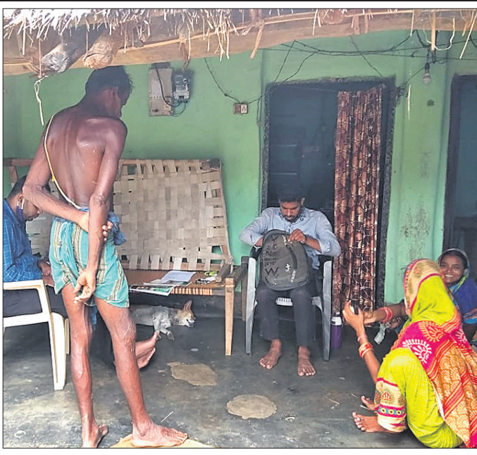
ଅର୍ଥ ଲଗାଣକାରୀ ସଂସ୍ଥାର କର୍ମଚାରୀ ରଣ ଆଦାୟ କରୁଛନ୍ତି।

ଏହାର ସୁସାଧନ ନେଇ ସେହି କରୁଥିବା ଅଭିଯୋଗ ହୋଇଛି। ସଂସ୍ଥାମାନେ ୨୧.୨୫% ସୂଧ ଆଦାୟ ସରକାରଙ୍କ ନିର୍ଦ୍ଦେଶ ତଥା କରୋନା