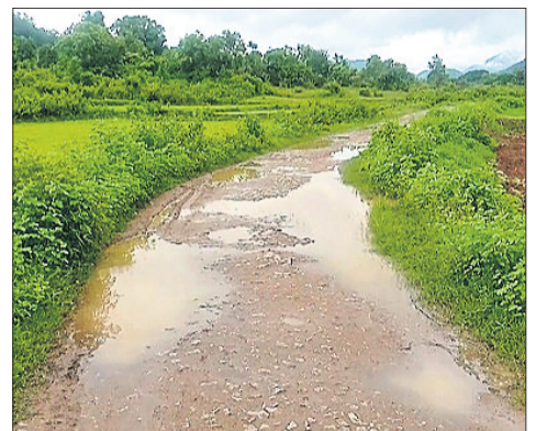
୫ ଗାଁକୁ ପଢ଼ିଥିବା ରାସ୍ତା ।

ରାଜନୈତିକ ବ୍ୟକ୍ତିମାନେ ଭୋଟରେ ବିଜୟୀ ପୂର୍ବରୁ ଅନେକ ପ୍ରତିଶ୍ରୁତି ଦିଅନ୍ତି । ବିଜୟ ପରେ ସବୁ ଭୁଲି ଯାଆନ୍ତି । ଆମେ ଭୋଟ ସମୟରେ ସବୁ ରାଜନେତାଙ୍କୁ ରାସ୍ତା ଓ ଅନ୍ୟ ସମସ୍ୟା ସମ୍ପର୍କରେ ଅବଗତ କରୁଛୁ । ହେଲେ ଆଜି ପର୍ଯ୍ୟନ୍ତ କୌଣସି କାର୍ଯ୍ୟାନୁଷ୍ଠାନ ଗ୍ରହଣ କରାଯାଇ ନାହିଁ ବୋଲି ସେ କହିଛନ୍ତି ।