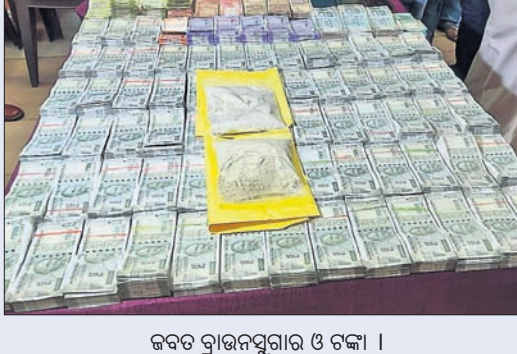
ଜବତ ବ୍ରାଉନସୁଗାର ଓ ଟଙ୍କା ।

କୋଲକାତାରୁ ଭାୟା ବାଲେଶ୍ୱର ଦେଇ ଭୁବନେଶ୍ୱର ଆସୁଥିବା ବ୍ରାଉନସୁଗାର ଲକ୍ଷ୍ମଣନରେ ଏକାଧିକ ଗୋରା ଚାଲାଣକାରୀ ରହିଥିବାବେଳେ ଏମାନଙ୍କ ଜରିଆରେ ରାଜ୍ୟର ବିଭିନ୍ନ ସ୍ଥାନକୁ କୋଟି କୋଟି ଟଙ୍କାର ଧଳାଜହର ଚାଲାଣ ହେଉଛି। ଶହାଦନଗର ଥାନାଞ୍ଚଳରେ ଏକ ଦମ୍ପତି ବ୍ରାଉନସୁଗାର କାରବାର କରୁଥିବା ଖବର ପାଇବା ପରେ କମିଶନରେଟ ପୋଲିସର କୁଲ୍‌ଡ୍ ଆକ୍ସନ ଟିମ୍ (କ୍ୟୁଏଟି) ଓ ଶହାଦନଗର ପୋଲିସର ମିଳିତ ଟିମ୍ ମଙ୍ଗଳବାର ରାତିରେ କେଶୁରାସ୍ଥିତ ଏକ ଘରେ ଚଢ଼ାଇ କରି ବଡ଼ ରଖାକେତକୁ ଧରିଛି। ସେଠାରୁ