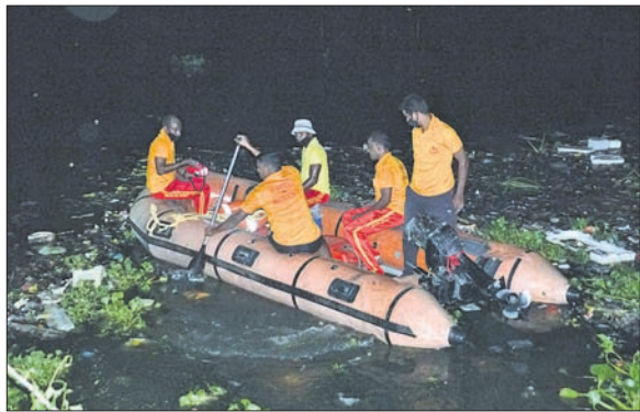
କାଠଯୋଡି ନଦୀରେ ଅଗ୍ନିଶମ ବିଭାଗ କର୍ମଚାରୀ ବାଳକଙ୍କୁ ଖୋଜୁଛନ୍ତି।