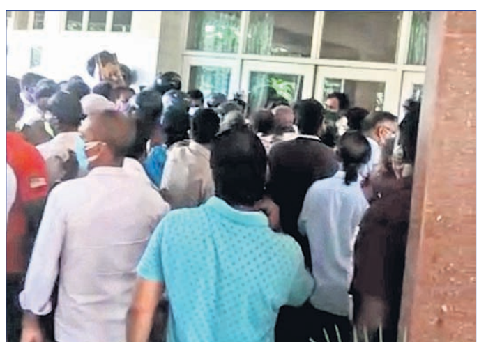
ଟିକା ପାଇଁ ଇନ୍ଡୋର ଷ୍ଟାଡ଼ିୟମରେ ଲୋକଙ୍କ ଗହଳି।