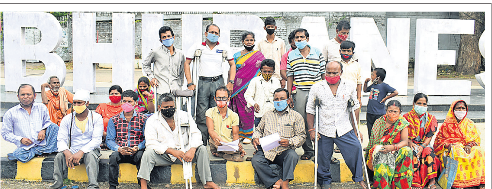
୫ ମାସର ଭରା ଦେବା ସହିତ ମାସିକ ଭରା ମହଜର ଚକାକୁ ବୁଦ୍ଧି ପାଇଁ ମୁଖ୍ୟମନ୍ତ୍ରୀଙ୍କ ଉଦ୍ଦେଶ୍ୟରେ ବାବିପତ୍ର ପ୍ରଦାନ ଅବସରରେ ରୁଧିର ଭୁବନେଶ୍ୱରରେ ଏକାଠି ହୋଇଥିବା ଦିବ୍ୟାଙ୍ଗମାନେ।