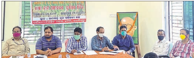
ଶିବିରରେ ମହାସାଧନ ଅଭିଯୋଗ।