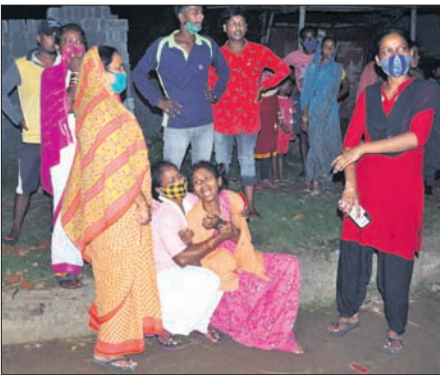
ଘଟଣାସ୍ଥଳରେ କୁହନରତ ପରିବାରବର୍ଗ।