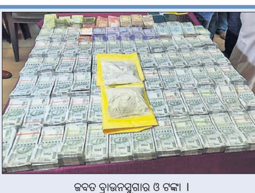
ଜବତ ବ୍ରାଉନସୁଗାର ଓ ଟଙ୍କା ।

ଭୁବନେଶ୍ୱର, ୧୪/୭(ବୁଧବେ) କୋଲକାତାରୁ ଭାୟା ବାଲେଶ୍ୱର ଦେଇ ଭୁବନେଶ୍ୱର ଆସୁଥିବା ବ୍ରାଉନସୁଗାର ଲକ୍ଷକୋଟିର ଟଙ୍କା ଟୋରା ଚାଲାଣକାରୀ ରହିଥିବାବେଳେ ଏମାନଙ୍କ ଜରିଆରେ ରାଜ୍ୟର ବିଭିନ୍ନ ସ୍ଥାନକୁ କୋଟି କୋଟି ଟଙ୍କାର ଧଳାକନ୍ଦର ଚାଲାଣ ହେଉଛି। ଶହାଦନଗର ଥାନାଞ୍ଚଳରେ ଏକ ଦମ୍ପତି ବ୍ରାଉନସୁଗାର କାରବାର କରୁଥିବା ଖବର ପାଇବା ପରେ କମିଶନରେଟ ପୋଲିସର କୁଲ୍‌ଡ ଆକ୍ସନ ଟିମ୍ (କ୍ୟୁଏଟି) ଓ ଶହାଦନଗର ପୋଲିସର ମିଳିତ ଟିମ୍ ମଙ୍ଗଳବାର ରାତିରେ କେଶୁରାସ୍ଥିତ ଏକ ଘରେ ଚଢ଼ାଇ କରି ବଡ଼ ରାଧାକେଟକୁ ଧରିଛି। ସେଠାକୁ