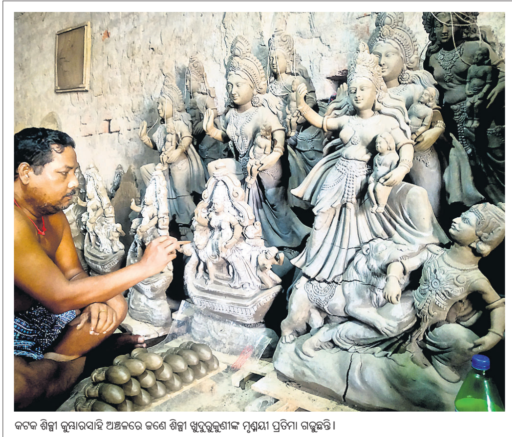
କଟକ ଶିଳ୍ପୀ କୁମାରସାହି ଅଞ୍ଚଳରେ ଜଣେ ଶିଳ୍ପୀ ଖୁରୁରୁଶାଙ୍କ ମୂର୍ତ୍ତ୍ୟୁ ପ୍ରତିମା ଗଢୁଛନ୍ତି।

କଟକ ଅଫିସ, ୧୪୪୭: କଟକ ବିଧାନସଭାରେ ବିଦ୍ୟାଧରପୁରସ୍ଥିତ ସହରାଞ୍ଚଳ ସ୍ୱାସ୍ଥ୍ୟକେନ୍ଦ୍ରରେ ସୋଲାର ବ୍ୟବସ୍ଥା କରାଯାଇଛି।