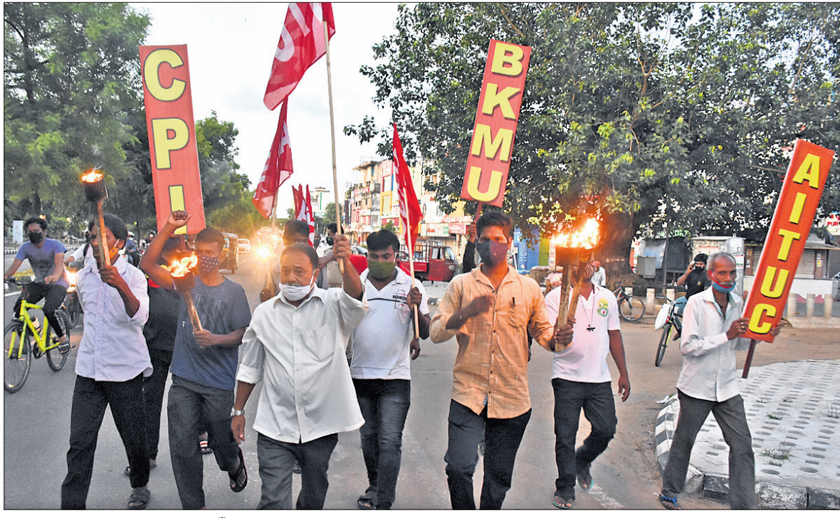
ଓଡ଼ିଶା ସରକାରଙ୍କ ଦ୍ୱାରା ପାଇଁ ବିକଳ ବାପାଙ୍କୁ ପୁଅର ମୃତ୍ୟୁର କାରଣରେ ଭୁବନେଶ୍ୱର ରାଜ୍ୟସଭା କ୍ଷେତ୍ରକୁ ବାହାରିଥିବା ମଣାଇ ରାଜା ।