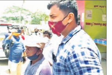
ସିଦ୍ଧିଆଇ ଗିରଫ କରି ନେଉଛି।

ଶାଖା ମଧ୍ୟରୁ ଓଡ଼ିଶାର ୫୭ଟି ଶାଖା ଥିବା କୁହାଯାଇଥିଲା। ଏହି ସଂସ୍ଥା ସମସ୍ତ ସେଗରେ ୨୫ଜଣ କୋର୍ଟ ଚଳାଏ ବ୍ୟବସାୟ କରିଥିବା ବେଳେ ଓଡ଼ିଶାରେ ୫୦୦ କୋଟି ଟଙ୍କାର ବ୍ୟବସାୟ କରିଥିଲା।