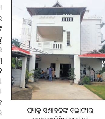
ପାଠ୍ୟ ସମ୍ପାଦକଙ୍କ ବଳାଙ୍ଗୀର ଘାଟେଲ୍‌ରେ ପଢ଼ା ହୋଇଛି

ସୋନପୁର/ତରଭା/ ବଳାଙ୍ଗୀର ଅଧିକାରୀଙ୍କ ଦ୍ୱାରା ପାଠ୍ୟ ସମ୍ପାଦକଙ୍କ କୋଟିଏରୁ ଉର୍ଦ୍ଧ୍ୱ ଚଙ୍କାର ସମ୍ପତ୍ତି ଠାବ ହୋଇଛି।