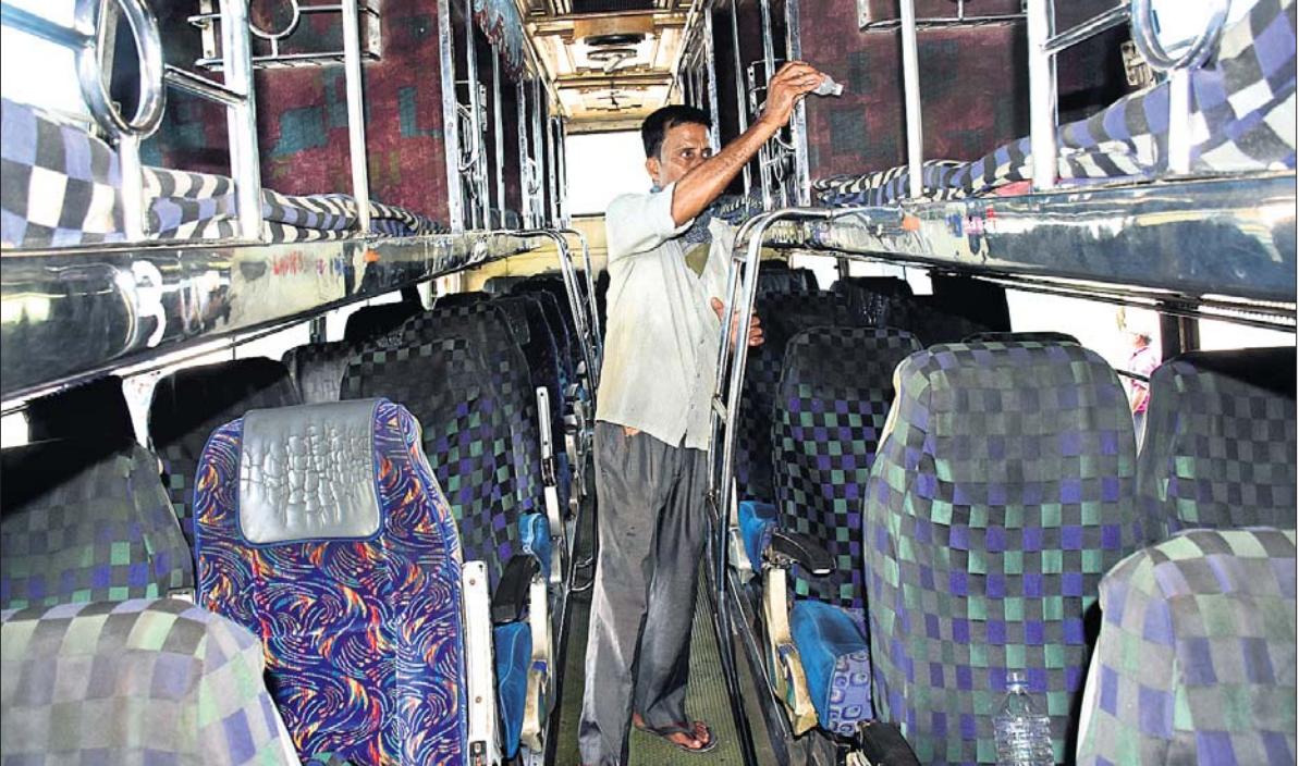
ଗଡ଼ିଲା! ବସ୍: ଭୁବନେଶ୍ୱର ବରମୁଣ୍ଡା ବସଷ୍ଟାଣ୍ଡରୁ ଶୁକ୍ରବାର ବାହାରିବାକୁ ଥିବା ଏକ ବସରେ ଜଣେ କର୍ମଚାରୀ ସାନିଟାଇଜ୍ କରୁଛନ୍ତି।

ଭଦ୍ରକରୁ ୬୬ ଲେଖାଏ, ନୟାଗଡ଼ରୁ ୫୯ ଓ ଅନୁଗୋଳରୁ ୫୭, କେନ୍ଦୁଝରରୁ ୫୬ ଓ ଷ୍ଟେଟ୍ସରୁ ୮୫ଟି ଲେଖାଏ ଉଚ୍ଚରହିଛି।