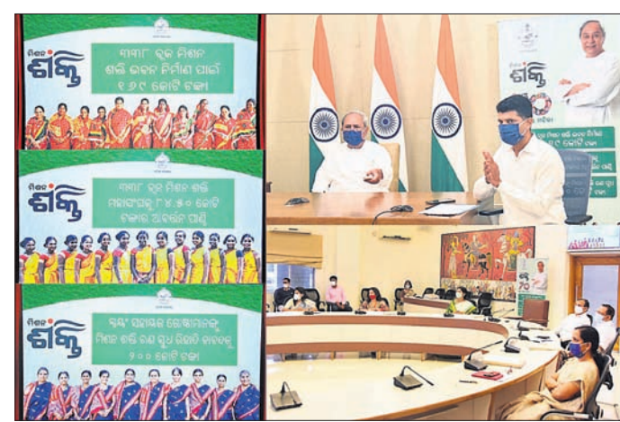
ଭୁବନେଶ୍ୱରରେ ମିଶନ ଶକ୍ତି କୋଟି ଉଦ୍‌ଘାଟନା ସମୟରେ

ମୁଖ୍ୟମନ୍ତ୍ରୀ କୋଟି ଉଦ୍‌ଘାଟନା କରିଛନ୍ତି। ଏହି କୋଟି ପ୍ରକଳ୍ପଟି ଆଗାମୀ ମସିହାରେ ପ୍ରାୟ ୨୦୦ କୋଟିରୁ ଅଧିକ ଆୟ ଆଣିବ।