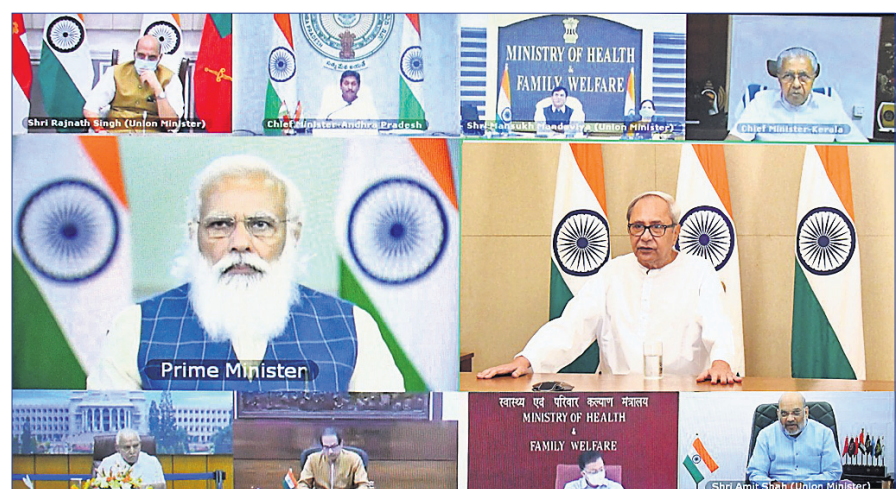
ବୈଠକରେ ପ୍ରଧାନମନ୍ତ୍ରୀ ନରେନ୍ଦ୍ର ମୋଦି, ସ୍ୱଚ୍ଛାୟାମନ୍ତ୍ରୀ ଅମିତ୍ ଶାହା, ପୁଖ୍ୟମନ୍ତ୍ରୀ ନବୀନ ପଟ୍ଟନାୟକ ଓ ଅନ୍ୟମାନେ ।

ପୁଖ୍ୟମନ୍ତ୍ରୀଙ୍କ ସହ ପ୍ରଧାନମନ୍ତ୍ରୀଙ୍କ ଆଲୋଚନା