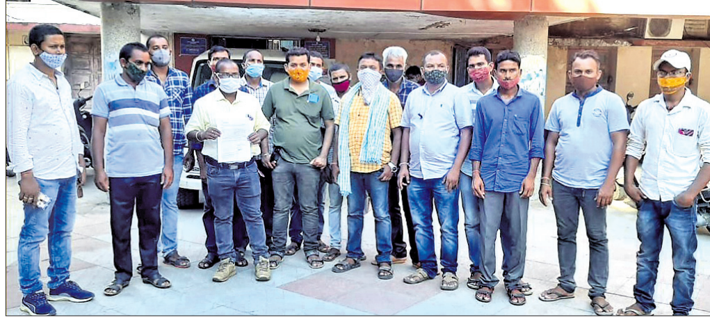
ଜିଲ୍ଲାପାଳଙ୍କୁ ଭେଟିବାକୁ ଆସିଥିବା ମୁୟୁମୁରା ଅଞ୍ଚଳର ଚାଷୀମାନେ।