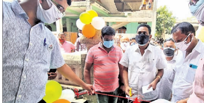
ଟିକାକରଣ କେନ୍ଦ୍ରକୁ ସ୍ୱାସ୍ଥ୍ୟମନ୍ତ୍ରୀ ଉଦ୍ଘାଟନ କରୁଛନ୍ତି।

ଠିକ୍ ସମୟରେ ଓଡ଼ିଶାକୁ ଚିକିତ୍ସା ଆସିବ ବୋଲି ପାଣିପାଗ ବିଭାଗ ପୂର୍ବାନୁମାନ କରିଥିଲା। ଏହି ଖବର ପାଇ ସମ୍ବଲପୁର ଜିଲ୍ଲାର ଚାଷୀମାନେ ବେଶ୍ ଉତ୍ସାହିତ ହୋଇଥିଲେ। କ୍ଷୟକ୍ଷତିକୁ ଭୁଲିଯାଇ ପୁଣି ଖରିଫ ଚାଷ ପାଇଁ ଅଶ୍ରୁ ଚଳୁଥିଲେ। ହେଲେ ଠିକ୍ ସମୟରେ ବର୍ଷା ହେଉ ନ ଥିବାରୁ ଚାଷୀମାନେ ଚିନ୍ତାରେ ପଡିଛନ୍ତି। ଅଣଜଳସେଚିତ ଅଞ୍ଚଳରେ ଚାଷକାମ ଅଟକି ଯାଇଥିବା ବେଳେ ଜଳସେଚିତ ଅଞ୍ଚଳରେ ମଧ୍ୟ ପ୍ରଭାବିତ ହୋଇଛି। କୁନ ମାସରେ ବୁଣା ଧାନ ଓ ଭୁଲାଇ ମାସରେ ବର୍ଷା ଅନୁପାତ କମିବାରୁ ଚାଷୀମାନେ ଚାଷ କାମ ଆରମ୍ଭ କରିପାରି ନ ଥିବା କହିଛନ୍ତି। ବାର୍ଦ୍ଧ ଏକସପ୍ତାହ ହେଲେ ଜିଲ୍ଲାରେ ବର୍ଷା ହୋଇନାହିଁ। ଫଳରେ ଜିଲ୍ଲାର ସମସ୍ତ ବ୍ଲକରେ ଚାଷକାର୍ଯ୍ୟ ବାଧାପ୍ରାପ୍ତ ହୋଇଛି। ଯେଉଁ ଷେଡରେ ଚାଷୀମାନେ ଧାନ ଚାଷ କରୁଥିଲେ ତାହା ଏବେ ଫାଟି ଥାଏ କରିବାକୁ ବସିଛି। ଅଳ୍ପ