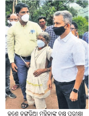
କର୍ମେ ଡଙ୍ଗାରିଆ ମହିଳାଙ୍କୁ ଚଷ୍ମା ପରୀକ୍ଷା ପାଇଁ ନିଆଯାଇଛି।