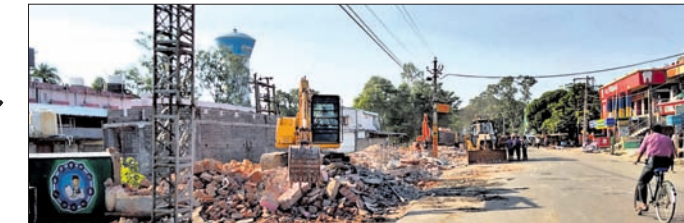
ହସିତାଳ ଛକରେ ଦୋକାନ ଗୃହ ଉଦ୍ଘୋଷଣା କରାଯାଇଛି।