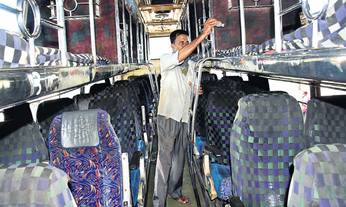
ଗଡ଼ିଲା! ବସ୍: ଭୁବନେଶ୍ୱର ବରମୁଣ୍ଡା ବସ୍ଷାଖରୁ ଶୁକ୍ରବାର ବାହାରିବାକୁ ଥିବା ଏକ ବସ୍ରେ ଜଣେ କର୍ମଚାରୀ ସାନିଟାଇଜ୍ କରୁଛନ୍ତି ।

ଅଧିକାରୀ ଥିଲେ ସୁଦ୍ଧା ସେମାନଙ୍କୁ ଏକ ପ୍ରକାର କୋଣଠୋପା କରି ରଖାଯାଇଛି । ବିଶେଷତାରେ ଏକ ନିର୍ଦ୍ଦିଷ୍ଟ ଗୋଷ୍ଠୀ ଲକ୍ଷିତରେ ଏଭଳି କରାଯାଉଥିବା ବିଭିନ୍ନ ସମୟରେ ଆଲୋଚନା ହୋଇଆସୁଛି । ଉଚ୍ଚ ପଦରେ ଥିବା ଅଣଓଡ଼ିଆ ଅଧିକାରୀମାନେ ସେମାନଙ୍କୁ ସୁହାଉଥିବା ତଥା ସେମାନଙ୍କ ପାଇଁ ଅନୁଗତ ଥିବା ଅଧିକାରୀଙ୍କୁ ଭଲ ସ୍ଥାନରେ ବସାଇ ନିଜ ସ୍ଥିତିକୁ ମଜବୁତ୍ କରୁଛନ୍ତି । ଏମିତିକି ଜଣ ଜଣଙ୍କ ପାଖରେ ଏକାଧିକ ଗୁରୁତ୍ୱପୂର୍ଣ୍ଣ ପଦବୀ ରହିଥିବା ଉଦାହରଣ ରହିଛି । ରାଜ୍ୟରେ ଅଣଓଡ଼ିଆ ଆଇପିଏସ୍ ଅଧିକାରୀଙ୍କୁ ଚଳୁଥିବା ଓଡ଼ିଆ ଅଧିକାରୀଙ୍କ ସଂଖ୍ୟା କମ୍ ଅଟେ । ଏଭଳି ସ୍ଥିତି ସୃଷ୍ଟି ହୋଇଥିବା ଅଧିକାରୀଙ୍କୁ ଉପଯୁକ୍ତ ସ୍ଥାନରେ ଅବସ୍ଥାପିତ କରାଗଲେ ସେମାନେ ନିଜର ଦାୟିତ୍ୱ ଠିକ୍ ଭାବେ ଚଳାଇ ପାରନ୍ତେ । ତେଣୁ କୌଣସି ପାତର ଅନ୍ତର ନ କରାଯାଇ ସେମାନେ ଦକ୍ଷ ସେମାନଙ୍କୁ ଗୁରୁତ୍ୱପୂର୍ଣ୍ଣ ପଦ ଦିଆଯିବା ଉଚିତ ବୋଲି ଅବସରପ୍ରାପ୍ତ ବରିଷ୍ଠ ପୋଲିସ୍ ଅଧିକାରୀ ମତ ଦେଇଛନ୍ତି ।