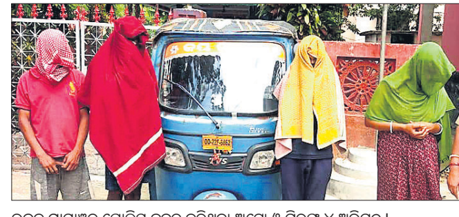
ଭଦ୍ରକ ଗ୍ରାମାଞ୍ଚଳ ପୋଲିସ୍ ଜବତ କରିଥିବା ଅଟୋ ଓ ରିଟେନ୍ ୪ ଅଭିଯୁକ୍ତ।