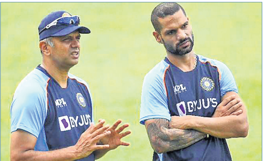
କୋର୍ ରାହୁଲ ଟ୍ରାଭିଡ଼ଙ୍କ ସହ ଶିଖର ଧାଞ୍ଜନ।

କଲମ୍ବୋ, ୧୭।୭ (ପି.ଟି.) ଶ୍ରୀଲଙ୍କା ଓ ଭ୍ରମଣକାରୀ ଭାରତ ମଧ୍ୟରେ ରବିବାରଠାରୁ ଆରମ୍ଭ ହେବାକୁ ଯାଉଛି ବହୁଚର୍ଚ୍ଚିତ ସୀମିତ ଓଭର ସିରିଜ। ଏହି ଗସ୍ତରେ ଭାରତ ମୋଟ ୬ଟି ମ୍ୟାଚ ଖେଳିବ। ପ୍ରଥମେ ଦୁଇ ଦେଶ ମଧ୍ୟରେ ୩ ମ୍ୟାଚ ବିଶିଷ୍ଟ ଦିନିକିଆ ସିରିଜ ଖେଳାଯିବ। ଏହାପରେ ଦୁଇ ଦିନ ମଧ୍ୟରେ ଆୟୋଜନ ହେବ ୩ ମ୍ୟାଚ ବିଶିଷ୍ଟ ଟି୨୦ ସିରିଜ। ତେଣୁ ସିରିଜ ଖେଳିବାକୁ ଦିବାର କୋହଲିଙ୍କ ନେତୃତ୍ୱରେ ଭାରତର ପୁଷ୍ପା ଦଳ ଇଂଲଣ୍ଡ ଗସ୍ତ କରିଛି। ପକ୍ଷରେ ଏହି ସୀମିତ ଓଭର ସିରିଜ ଖେଳିବାକୁ ଅଭିଜ୍ଞ ଓପନର ଶିଖର ଧାଞ୍ଜନଙ୍କ ନେତୃତ୍ୱରେ ଭାରତର ଅନ୍ୟ ଏକ ଯୁବ ଦଳ ଶ୍ରୀଲଙ୍କା ଗସ୍ତ କରିଛି। ରବିବାର ଆର. ପ୍ରେମଦାସା ଶ୍ରୀଲଙ୍କାରେ ପ୍ରଥମ ଦିନିକିଆ ମ୍ୟାଚ ଖେଳାଯିବ। ତାରକା ଖେଳାଳିଙ୍କ ଅନୁପସ୍ଥିତିରେ ଦ୍ୱିତୀୟ ଶ୍ରେଣୀର ଏହି ଭାରତୀୟ ଦଳ କିଭଳି ପ୍ରଦର୍ଶନ କରୁଛି ତାହା ଉପରେ ସମସ୍ତଙ୍କ ନଜର ରହିଛି। ଏହି ସିରିଜରେ ଭଲ ପ୍ରଦର୍ଶନ କରି କେତେକ ଖେଳାଳି ଆଗକୁ ଆୟୋଜନ ହେବାକୁପାରେ। ଟି୨୦ ବିଶ୍ୱକପ ପାଇଁ ଦଳରେ ସ୍ଥାନ ହାସଲ କରିବା ଲକ୍ଷ୍ୟରେ ରହିଛି। ଶ୍ରୀଲଙ୍କା ଶିବିରରେ କୋଭିଡ୍-୧୯ ସଂକ୍ରମଣ ଚିହ୍ନ ହେବାରୁ ଏହି ସିରିଜକୁ ୫ ଦିନ ପୁରୁଣା ଦିଆଯାଇଥିଲା। ଅଲରାଉଣ୍ଡର ଦମ୍ଭୁନ ସନକାଙ୍କ ନେତୃତ୍ୱରେ ଘରୋଇ ପରିବେଶରେ ଶ୍ରୀଲଙ୍କା ପଡିଆକୁ ଉନ୍ମାଳିବ। ଗତ ୪ ବର୍ଷ ମଧ୍ୟରେ ଶ୍ରୀଲଙ୍କାରେ ନେତୃତ୍ୱ ବହୁତାରେ ବଦଳିଛି ଓ ଦଶମ ଅଧିନାୟକ ଭାବେ