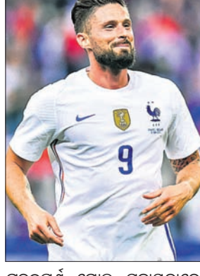
ଗୁରୁତ୍ୱପୂର୍ଣ୍ଣ ଗୋଲ୍ ସହାୟତାରେ ଟେଲ୍ସି ଗତ ସିଜନରେ ଗାମ୍ପିୟନ୍ ଲିଗ୍ ପାଇଁ ଯୋଗ୍ୟତା ଅର୍ଜନ କରିଥିଲା। ପ୍ରତିଯୋଗିତାରେ ତାଙ୍କ ୬ଟି ଗୋଲ୍ ସହାୟତାରେ ଲଣ୍ଡନ କ୍ଲବ୍ ଦ୍ୱିତୀୟ ଥର ପାଇଁ ଚାଲଟଲ ବିଜୟୀ ହୋଇଥିଲା। ଗିରୋଡ ଆହୁରିମଧ୍ୟ ୨୦୧୯ରେ ଟେଲ୍ସିର ବିଜୟରେ ଯୁରୋପା ଲିଗ୍ ଚପ୍ ଷ୍ଟୋରର ଥିଲେ।

ମିଲାନ, ୧୭।୭ (ଏପି): ପ୍ରାନ୍ତର ଭେଟେରାନ ଷ୍ଟାଇଲର ଅଲିଭର ଗିରୋଡ ଗାମ୍ପିୟନ୍ ଲିଗ୍ ବିଜେତା ଟେଲ୍ସି ଦଳ ପରିତ୍ୟାଗ କରି ଯୁରୋପିଆନ କପ୍ ବିଜେତା ଏସି ମିଲାନରେ ଯୋଗଦେଇଛନ୍ତି। ଗିରୋଡ ଏହି କ୍ଲବ୍ ତରଫରୁ ଖେଳିବା ବେଳେ ୯ ନମ୍ବର କର୍ଭି ବ୍ୟବହାର କରିବେ। ୩୪ ବର୍ଷୀୟ ଗିରୋଡ୍ ୯ ବର୍ଷ ହେଲା ଇଂଲିଶ୍ ପୁରବଳ ସହ ସମ୍ପୃକ୍ତ ଅଛନ୍ତି। ଆର୍ସେନାଲ ତରଫରୁ ଖେଳି ସେ ୧୦୫ ଗୋଲ ଷ୍ଟୋର କରିଥିବାବେଳେ ଟେଲ୍ସି ପକ୍ଷରୁ ସେ ୩୯ ଗୋଲ ବେଇଛନ୍ତି। ୪୬ ଗୋଲ୍ ସହ ସେ ପ୍ରାନ୍ତର ମଧ୍ୟ ଦ୍ୱିତୀୟ ସର୍ବାଧିକ ଷ୍ଟୋରର ବିବେଚିତ ହେଉଛନ୍ତି। ଆର୍ସେନାଲର ପୂର୍ବତନ ଷ୍ଟାର ଖେଳାଳି ଥିବା ହେନ୍ଡରୀକ୍ ଠାଉ ଗୋଲ୍ ୫ ଗୋଲ୍ ପଛରେ ରହିଛନ୍ତି। ୨୦୧୯-୨୦ ସିଜନରେ ତାଙ୍କର