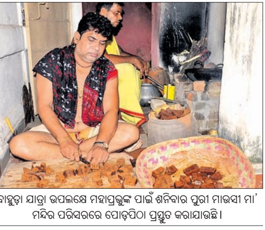
ବାହୁଡ଼ା ସାଗ୍ରା ଉପଲକ୍ଷେ ମହାପ୍ରଭୁଙ୍କ ପାଇଁ ଶନିବାର ପୁରୀ ମାଉସା ମା' ମନ୍ଦିର ପରିସରରେ ପୋଡ଼ିପିଠା ପ୍ରସ୍ତୁତ କରାଯାଇଛି।

ଭଦ୍ରକ ଗ୍ରାମାଞ୍ଚଳ ଥାନା ପୋଲିସ୍ ଶନିବାର ଧାମରା ରେଲୱେ ଓଭରବ୍ରିଜ ନିକଟରୁ ୧ କୋଟି ୯୦ ଗ୍ରାମ୍ ବ୍ରାଉନସୁଗାର ଜବତ କରିଛି। ଏଥିସହ ୪ଜଣଙ୍କୁ ପୋଲିସ୍ ରିଟେନ୍ କରିଛି। ସେମାନଙ୍କ ମଧ୍ୟରେ ଜଣେ ମହିଳା ଅଛନ୍ତି। ଜବତ ବ୍ରାଉନସୁଗାର ଆନୁମାନିକ ମୂଲ୍ୟ ୧ କୋଟିରୁ ଊର୍ଦ୍ଧ୍ୱ ହେବ ବୋଲି ଏକ ଖବରଦାତା ସମ୍ବଲପୁରରେ ଏସ୍ପି ତରଫରୁ ଥାନା ସୂଚନା ଦେଇଛନ୍ତି। ରିଟେନ୍ ୪ ଅଭିଯୁକ୍ତ ହେଲେ ବାଲେଶ୍ୱର ଜିଲ୍ଲା ଜେଜିଏସ୍ରେ ଏସ୍ପିଙ୍କୁ ନିକଟରେ ଉପସ୍ଥାପନ କରାଯାଇଛି। ଏନେଇ ପୋଲିସ୍ ଦ୍ୱାରା ଗିରଫ ହୋଇଥିବା ସତ୍ୟକ୍ଷୁ ବୁକ୍ ଅଫ୍ ରେକର୍ଡ୍ ନିମନ୍ତେ ଆବେଦନ କରିଥିଲେ। ଏ ନେଇ ଇଣ୍ଡିଆ ବୁକ୍ ଅଫ୍ ରେକର୍ଡ୍ ପକ୍ଷରୁ ଶନିବାର ସତ୍ୟକ୍ଷୁ ବୁକ୍ ଅଫ୍ ରେକର୍ଡ୍ ନିମନ୍ତେ ଆବେଦନ କରିଥିଲେ। ଏ ନେଇ ଇଣ୍ଡିଆ ବୁକ୍ ଅଫ୍ ରେକର୍ଡ୍ ପକ୍ଷରୁ ଶନିବାର ସତ୍ୟକ୍ଷୁ ବୁକ୍ ଅଫ୍ ରେକର୍ଡ୍ ନିମନ୍ତେ ଆବେଦନ କରିଥିଲେ।