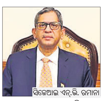
ସିଜେଆଇ ଏନ୍.ଭି. ରମାନା ଉଦ୍‌ଘୋଷଣା ଦେଇ ସିଜେଆଇ କହିଥିଲେ, ଭାରତ ସବୁ ଧର୍ମ, ଭାଷା, ସଂସ୍କୃତିର ଦେଶ ଯେଉଁଠି ବିବିଧତା ମଧ୍ୟରେ ଏକତା ରହିଛି । ଭାରତରେ ଆଇନର ଶାସନ ତାଲେ ଏବଂ ନ୍ୟାୟପାଳିକା ଉପରେ ସମସ୍ତଙ୍କର ପୂରା

ବିଶ୍ୱର ସର୍ବବୃହତ୍ ଗଣତନ୍ତ୍ର ଭାରତର ବିଚାର ବ୍ୟବସ୍ଥା ଉପରେ ଦେଶବାସୀଙ୍କ ଭରସା ରହିଛି । ସେମାନେ କୋର୍ଟକୁ ନ୍ୟାୟ ପାଇବା ନେଇ ସ୍ୱଳ୍ପ ନିଶ୍ଚିତ ବୋଲି ଭାରତର ପ୍ରଧାନ ବିଚାରପତି (ସିଜେଆଇ) ଏନ୍.ଭି. ରମାନା ଶନିବାର କହିଛନ୍ତି । ଯେତେବେଳେ ଦେଶରେ କିଛି ଭୁଲ୍ କାର୍ଯ୍ୟ ହୁଏ, ସେତେବେଳେ ସର୍ବବୃହତ୍ ଗଣତନ୍ତ୍ର ଅଭିଭାବକ ଭାବେ ସୁପ୍ରିମକୋର୍ଟ ଜନସାଧାରଣଙ୍କ ପାଖରେ ଛିଡ଼ାହେବ ବୋଲି ସେମାନଙ୍କର ବିଶ୍ୱାସ ରହିଥିବା ଜଣ୍ଠି ସରମାନା କହିଛନ୍ତି । ଭାରତ-ସିଙ୍ଗାପୁର ମଧ୍ୟସ୍ତର ସମ୍ପର୍କରେ