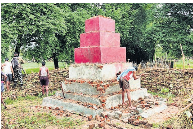
ଯବାନମାନେ ଭାଙ୍ଗି ଦେଇଯାଇଥିବା ମାଓବାଦୀଙ୍କ ଶହୀଦ ସୁପକୁ ସ୍ଥାନୀୟ ଲୋକେ ଦେଖୁଛନ୍ତି।

ମାଲକାନଗିରି, ୧୭/୭ (ଡି.ଏନ୍.ଏ.) କୋଟି ଅପରେଶନ କରାଯାଇଥିଲା। ଏହି ସମୟରେ ଜଙ୍ଗଲରେ ଯବାନମାନେ ମାଓବାଦୀଙ୍କ ଏକ ଶହୀଦ ସୁପ ଅର୍ଥାତ୍ ମାଲକାନଗିରି ଗ୍ରାମ ନିକଟ ଜଙ୍ଗଲରେ ଦେଖିବାକୁ ପାଇଥିଲେ। ପରେ ସେମାନେ ଏହାକୁ ବାହୁଡ଼ ଲଗାଇ ଶନିବାର ଯବାନମାନେ ଭାଙ୍ଗି ଦେଇଛନ୍ତି। ମାଓବାଦୀ ଉପତୁ ଅଞ୍ଚଳ ଆଲିମପାଇଁ ସହ ଅନ୍ୟ ଜଙ୍ଗଲରେ ତିଆରି ୭୦୨ କୋଡ଼ା ବାଟାଲିୟନ ପକ୍ଷରୁ ମିଳିତ