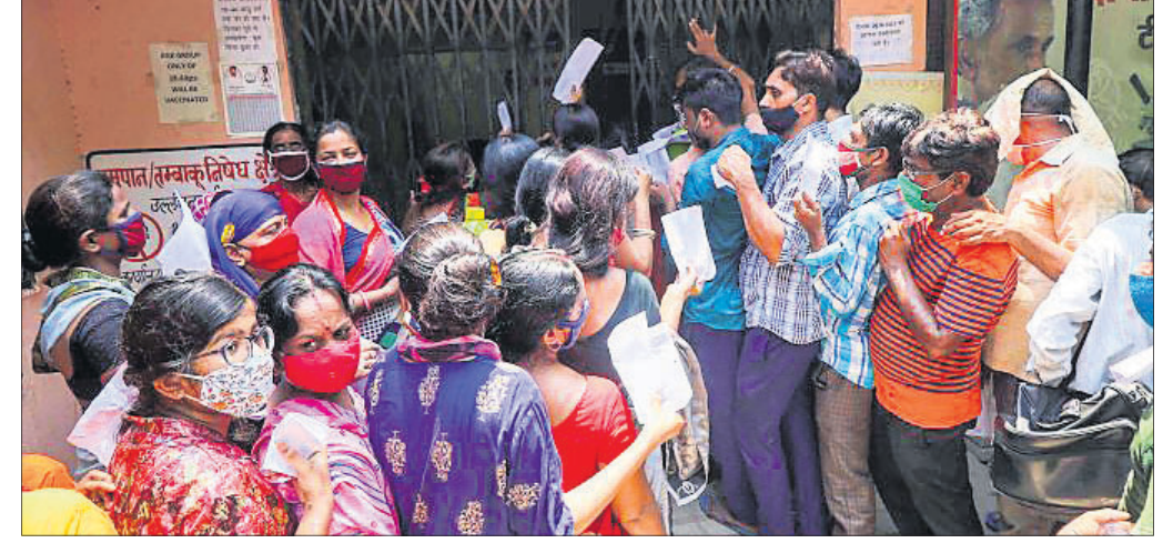
ରାଜସ୍ଥାନର ଜୟପୁରସ୍ଥିତ ଏକ ଚିକା କେନ୍ଦ୍ରରେ ଶନିବାର ପ୍ରବଳ ଭିଡ଼ ।