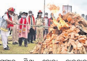
ଟଙ୍କାର ନିଗା ଚୋରା କାରବାର ହେଉଥିବା ପୁଖ୍ୟମନ୍ତ୍ରୀ କହିଛନ୍ତି ।

ଶନିବାର ଦିନୁ ଓ ଗୋଲାଘାଟରେ ନିଗାତ୍ରବ୍ୟ ପୋଡ଼ାଯାଇଥିବାବେଳେ ରବିବାର ନାଗାଠି ଏବଂ ହୋଇଲରେ ଏଥିପାଇଁ ରାଜ୍ୟ ସରକାରଙ୍କ ପକ୍ଷରୁ ତୁଇଦିନିଆ ନିଗାତ୍ରବ୍ୟ ପୋଡ଼ା ଅଭିଯାନ ଆରମ୍ଭ ହୋଇଛି । ପୁଖ୍ୟମନ୍ତ୍ରୀ ହିମନ୍ତ ବିଶ୍ୱ ଶର୍ମା ଶନିବାର ତୁଇଟି ସ୍ଥାନରେ ନିଗାତ୍ରବ୍ୟରେ ନିଆଁ ଲଗାଇଛନ୍ତି ।