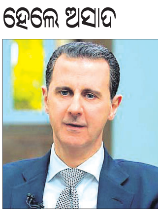
ନୂଆଦିଲ୍ଲୀ, ୧୭୧୭

ପ୍ରଧାନମନ୍ତ୍ରୀ ନରେନ୍ଦ୍ର ମୋଦି ଭିଡିଓ କନ୍‌ଫରେନ୍ସ କରିଥିବାବେଳେ ଶୁକ୍ରବାର ଭୁବନେଶ୍ୱରରେ ବିଭିନ୍ନ ରେଳ ପ୍ରକଳ୍ପ ଉଦଘାଟନ କରିଛନ୍ତି । ଏହି ଅବସରରେ ଭୁବନେଶ୍ୱର ସାଇକ୍ଲ ସିଟିଠାରେ ଆକାଞ୍ଚିକ୍ଷ ଓ ରୋବୋଟିକ୍ସ ଗ୍ୟାଲେରି ଏବଂ ଏକ ପ୍ରାକୃତିକ ଉଦ୍ୟାନକୁ ମଧ୍ୟ ଲୋକାର୍ପିତ କରିଛନ୍ତି । ଗାନ୍ଧୀନଗର କ୍ୟାମ୍ପାସ-ବାଗାଣସା ସୁପରଫାଷ୍ଟ ଏକ୍ସପ୍ରେସ୍ ଓ ଗାନ୍ଧୀନଗର କ୍ୟାମ୍ପାସ ଓ ଭେରେଠା ମଧ୍ୟରେ ମେମୁ ସେବା ଉଦଘାଟିତ ହୋଇଛି । ଏହି ଅବସରରେ ପ୍ରଧାନମନ୍ତ୍ରୀ କହିଥିଲେ, କେବଳ କଂକ୍ରିଟ୍ ତାଣ୍ଡା ନୁହେଁ ବରଂ ନିକଟ୍ସ ଚରିତ୍ର ଥିବା ଭିଡିଓମି ନିର୍ମାଣ ଦେଶର ଲକ୍ଷ୍ୟ । ପିଲାମାନଙ୍କର ପ୍ରାକୃତିକ ବିକାଶ ପାଇଁ ମନୋରଞ୍ଜନ ସହିତ ଅଧ୍ୟୟନ ଓ ସୁକ୍ଷମଶାଳତା ପାଇଁ ଅବସର ସୃଷ୍ଟି କରାଯିବା ଆବଶ୍ୟକ । ସାଇକ୍ଲ ସିଟି ଏପରି ଏକ ପ୍ରକଳ୍ପ ଯେଉଁଥିରେ ଆମୋଦପ୍ରମୋଦ ସହିତ ସୁକ୍ଷମଶାଳତାର ମିଶ୍ରଣ ରହିଛି । ଏହି ଆକାଞ୍ଚିକ୍ଷ ଏସିଆର ସବୁଠୁ ବଡ଼ ଆକାଞ୍ଚିକ୍ଷ ମଧ୍ୟରୁ ଅନ୍ୟତମ ଏବଂ