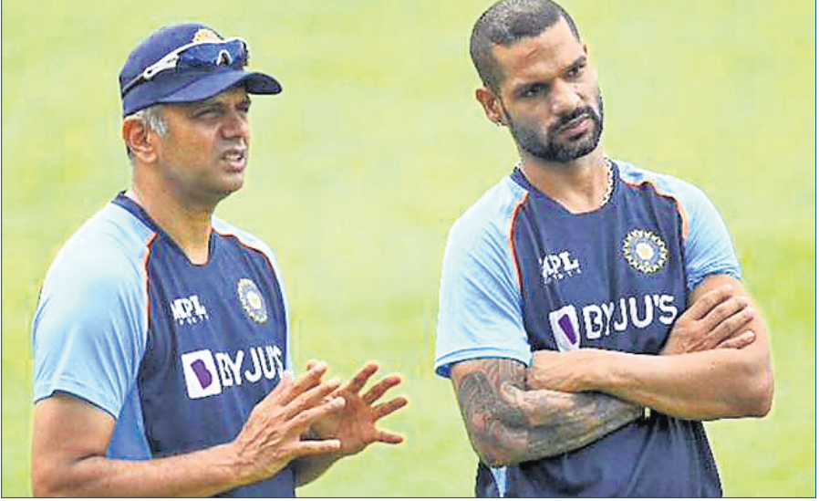
କୋର୍ ରାହୁଲ ଟ୍ରାଭିଡ୍‌ଙ୍କ ସହ ଶିଖର ଧାଞ୍ଜନ।

ଶ୍ରୀଲଙ୍କା ଓ ଭ୍ରମଣକାରୀ ଭାରତ ମଧ୍ୟରେ ରବିବାରଠାରୁ ଆରମ୍ଭ ହେବାକୁ ଯାଉଛି ବହୁଚର୍ଚ୍ଚିତ ସୀମିତ ଓଭର ସିରିଜ। ଏହି ଗସ୍ତରେ ଭାରତ ମୋଟ ୬ଟି ମ୍ୟାଚ ଖେଳିବ। ପ୍ରଥମେ ଦୁଇ ଦେଶ ମଧ୍ୟରେ ୩ ମ୍ୟାଚ ବିଶିଷ୍ଟ ଦିନିକିଆ ସିରିଜ ଖେଳାଯିବ। ଏହାପରେ ଦୁଇ ଦିନ ମଧ୍ୟରେ ଆୟୋଜନ ହେବ ୩ ମ୍ୟାଚ ବିଶିଷ୍ଟ ଟି୨୦ ସିରିଜ। ତେଣୁ ସିରିଜ ଖେଳିବାକୁ ଦିଗ୍‌ଗେଟ କୋହଲିଙ୍କ ନେତୃତ୍ୱରେ ଭାରତର ପୂର୍ଣ୍ଣ ଦଳ ଇଂଲଣ୍ଡ ଗସ୍ତ କରିଛି। ଫଳରେ ଏହି ସୀମିତ ଓଭର ସିରିଜ ଖେଳିବାକୁ ଅଭିଜ୍ଞ ଓପନର ଶିଖର ଧାଞ୍ଜନଙ୍କ ନେତୃତ୍ୱରେ ଭାରତର ଅନ୍ୟ ଏକ ଯୁବ ଦଳ ଶ୍ରୀଲଙ୍କା ଗସ୍ତ କରିଛି। ରବିବାର ଆର. ପ୍ରେମଦାସା ଶୁଭିକ୍ଷମରେ ପ୍ରଥମ ଦିନିକିଆ ମ୍ୟାଚ ଖେଳାଯିବ। ତାରକା ଖେଳାଳିଙ୍କ ଅନୁପସ୍ଥିତିରେ ଦ୍ୱିତୀୟ ଶ୍ରେଣୀର ଏହି ଭାରତୀୟ ଦଳ କେବଳ ପ୍ରଦର୍ଶନ କରୁଛି ତାହା ଉପରେ ସମସ୍ତଙ୍କ ନଜର ରହିଛି। ଏହି ସିରିଜରେ ଭଲ ପ୍ରଦର୍ଶନ କରି କେତେକ ଖେଳାଳି ଆଗକୁ ଆୟୋଜନ ହେବାକୁପା ୧୨୦ ବିଶ୍ୱକପ ପାଇଁ ଦଳରେ ସ୍ଥାନ ହାସଲ କରିବା ଲକ୍ଷ୍ୟରେ ରହିଛନ୍ତି। ଶ୍ରୀଲଙ୍କା ଶିବିରରେ କୋଭିଡ୍-୧୯ ସଂକ୍ରମଣ ଚିହ୍ନ ହେବାରୁ ଏହି ସିରିଜକୁ ୫ ଦିନ ଚୁଆଇ ଦିଆଯାଇଥିଲା। ଅଲରାଉଣ୍ଡର ଦସୁନ ସନକାଙ୍କ ନେତୃତ୍ୱରେ ଘରୋଇ ପରିବେଶରେ ଶ୍ରୀଲଙ୍କା ପଡିଆକୁ ଓହ୍ଲାଇବ। ଗତ ୪ ବର୍ଷ ମଧ୍ୟରେ ଶ୍ରୀଲଙ୍କାର ନେତୃତ୍ୱ ବହୁତାର ବଦଳିଛି ଓ ବର୍ତ୍ତମାନ ଅଧିନାୟକ ଭାବେ