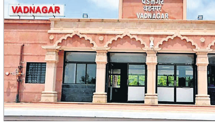
ଭୁବନେଶ୍ୱର ଉଦଘାଟନ କେଳି ଶ୍ରେଣୀର ଆଧୁନିକୀକରଣ କରାଯାଇଛି ।

ସାରା ବିଶ୍ୱର ସାମୁଦ୍ରିକ ଜୈବ ବିବିଧତାର ଦୃଶ୍ୟ ଗୋଟିଏ ସ୍ଥାନରେ ଦେଖିବା ଏକ ଅତୁତ ଅନୁଭବ ପ୍ରଦାନ କରିବ । ସେହିପରି ରୋବୋଟିକ୍ସ ଗ୍ୟାଲେରି ସୁବକ୍ଷମାନ୍ତରୁ ରୋବୋଟିକ୍ସ କ୍ଷେତ୍ରରେ କାମ କରିବା ଲାଗି ଅନୁପ୍ରାଣିତ କରିବ । ପ୍ରଧାନମନ୍ତ୍ରୀ ଆହୁରି ସୁକ୍ଷମଶାଳତାର ମିଶ୍ରଣ ରହିଛି । ଏହି ଆକାଞ୍ଚିକ୍ଷ ଏସିଆର ସବୁଠୁ ବଡ଼ ଆକାଞ୍ଚିକ୍ଷ ମଧ୍ୟରୁ ଅନ୍ୟତମ ଏବଂ