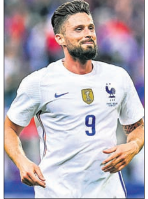
ଗୁରୁତ୍ୱପୂର୍ଣ୍ଣ ଗୋଲ୍ ସହାୟତାରେ ଚେଲ୍‌ସି ଗତ ସିଜନରେ ଗାମ୍ପିୟନ୍ ଲିଗ୍ ପାଇଁ ଯୋଗ୍ୟତା ଅର୍ଜନ କରିଥିଲା। ପ୍ରତିଯୋଗିତାରେ ଟାକ୍ ୬ଟି ଗୋଲ୍ ସହାୟତାରେ ଲଣ୍ଡନ କ୍ଲବ୍ ଦ୍ୱିତୀୟ ଥର ପାଇଁ ଟାଇଟଲ୍ ବିଜୟୀ ହୋଇଥିଲା। ଗିରୋଡ୍ ଆହୁରିମଧ୍ୟ ୨୦୧୯ରେ ଚେଲ୍‌ସିର ବିଜୟରେ ଯୁରୋପା ଲିଗ୍‌ର ଚପ୍ ଷ୍ଟୋରର ଥିଲେ।

ଏସି ମିଲାନରେ ଯୋଗଦେଲେ ଗିରୋଡ ମିଲାନ, ୧୭/୭ (ଏସି): ପ୍ରାନ୍ତର ଭେଟେରାନ ଷ୍ଟାଇଲର ଅଭିଭାବ ଗିରୋଡ ଗାମ୍ପିୟନ୍‌ସ୍ ଲିଗ୍ ବିଜେତା ଚେଲ୍‌ସି ଦଳ ପରିତ୍ୟାଗ କରି ଯୁରୋପିଆନ କପ୍ ବିଜେତା ଏସି ମିଲାନରେ ଯୋଗଦେଇଛନ୍ତି। ଗିରୋଡ ଏହି କ୍ଲବ୍ ତରଫରୁ ଖେଳିବା ବେଳେ ୯ ନମ୍ବର ଜର୍ସି ବ୍ୟବହାର କରିବେ। ୩୪ ବର୍ଷୀୟ ଗିରୋଡ୍ ୯ ବର୍ଷ ହେଲା ଇଂଲିଶ୍ ଫୁଟବଲ୍ ସହ ସମ୍ପୃକ୍ତ ଅଛନ୍ତି। ଆର୍ଯେନାଲ୍‌ରେ ଚଳୁଥିବା ଖେଳି ସେ ୧୦୫ ଗୋଲ୍ ଷ୍ଟୋର କରିଥିବାବେଳେ ଚେଲ୍‌ସି ପକ୍ଷରୁ ସେ ୩୯ ଗୋଲ୍ ବେଇଛନ୍ତି। ୪୬ ଗୋଲ୍ ସହ ସେ ପ୍ରାନ୍ତର ମଧ୍ୟ ଦ୍ୱିତୀୟ ସର୍ବାଧିକ ଷ୍ଟୋରର ବିବେଚିତ ହେଉଛନ୍ତି। ଆର୍ଯେନାଲର ପୂର୍ବତନ ଷ୍ଟାର ଖେଳାଳି ଥିବା ହେନ୍‌ରୀଙ୍କଠାରୁ ମାତ୍ର ୫ ଗୋଲ୍ ପଛରେ ରହିଛନ୍ତି। ୨୦୧୯-୨୦ ସିଜନରେ ଟାକ୍