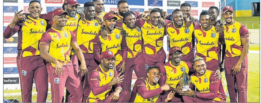
ଟି୨୦ ସିରିଜ ବିଜୟୀ ଝେଷ୍ଟଇଣ୍ଡିଜ ଦଳ।