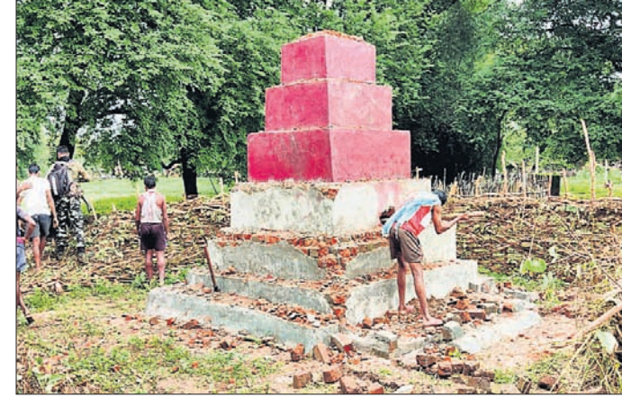
ଯବାନମାନେ ଭାଙ୍ଗି ଦେଇଯାଇଥିବା ମାଓବାଦୀଙ୍କ ଶହାଦ ସୁପକୁ ସ୍ଥାନୀୟ ଲୋକେ ଦେଖୁଛନ୍ତି।