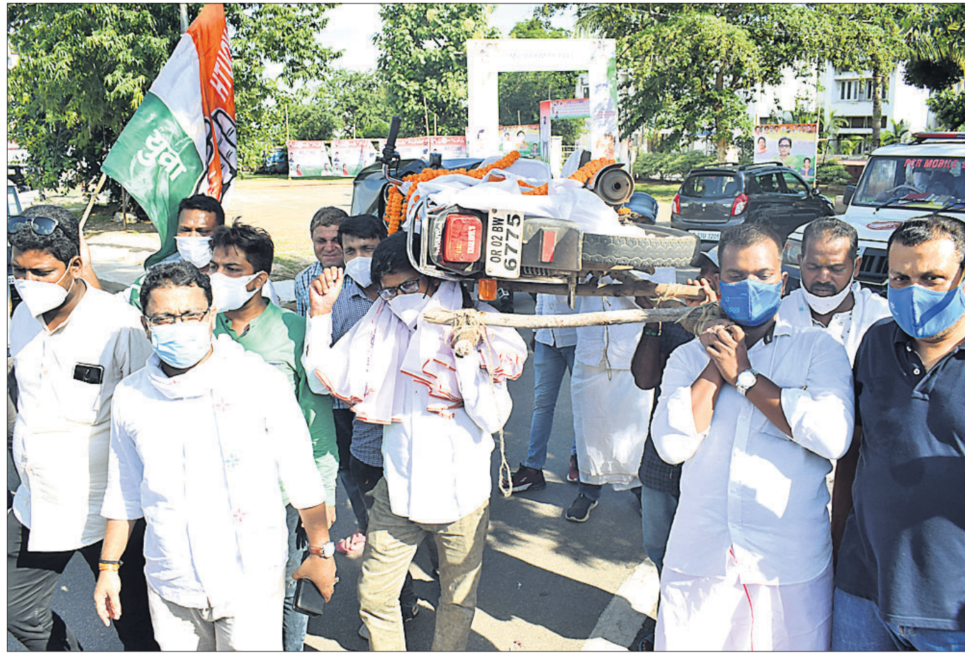
ଟେଲ ଦର ବୃଦ୍ଧି ପ୍ରତିବାଦରେ ଶନିବାର ଭୁବନେଶ୍ୱର ଲୋୟର ପିଏମ୍‌ଜିରେ ଯୁବ କଂଗ୍ରେସ ପକ୍ଷରୁ ଏକ ବାଇକକୁ କୋକେଇରେ ରଖାଯାଇ ବିରୋଧ ପ୍ରଦର୍ଶନ କରାଯାଇଛି ।

ଅଭିନେତ୍ରୀ କରୀନା କପୁରଙ୍କ ପ୍ରେମରେ ପଡ଼ିବା ପରେ ହାତ କାଟି ଦେଇଥିଲେ ଅଭିନେତା ସୈଫ୍ ଅଲୀ ଖାନ।