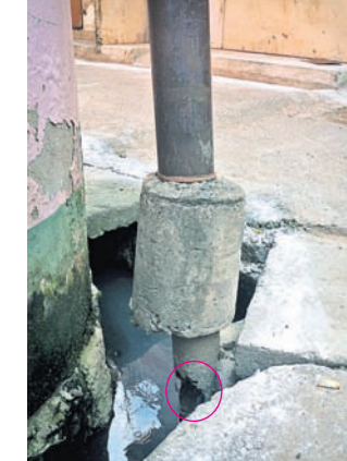
ଉକ୍ତ ଗ୍ଲାମାୟ ଯାଇ ଅନୁଧ୍ୟାନ କରିବା ପରେ ଖୁଣ୍ଟଟିକୁ ମରାମତି କରାଯିବ।