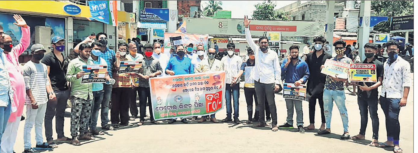
ପେଟ୍ରୋଲ ଓ ଡିଜେଲ ଦର ବୃଦ୍ଧି ପ୍ରତିବାଦରେ ଶନିବାର ପୁରୀ ବଡ଼ଦାଣ୍ଡସ୍ଥିତ ଏକ ପେଟ୍ରୋଲ ପମ୍ପ ସମ୍ମୁଖରେ କଂଗ୍ରେସ ପକ୍ଷରୁ ବିକ୍ଷୋଭ ପ୍ରଦର୍ଶନ କରାଯାଇଛି।