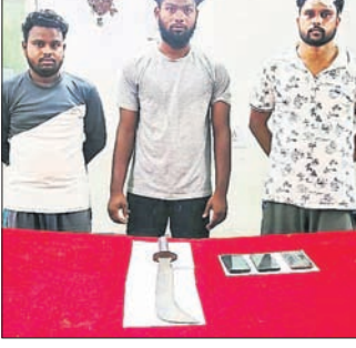
ଗିରଫ ୩ ଅଭିଯୁକ୍ତ, ଜବତ କରୁଛି।