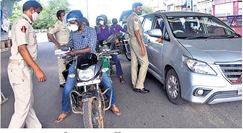
ଭୁବନେଶ୍ୱର ରାଜମହଲ୍ ହକ୍ସରେ ଶନିବାର ଶତ୍ରୁଚାରଣ ଯାତ୍ରା ବାଲିଛି।

କ୍ରେଡିଟ୍, ଡେବିଡ୍ କାର୍ଡ, ୟୁପିଆଇ ଭେରିଫିକେଶନ, ଲୋନ୍, ପୁରସ୍କାର, ହରିଗ୍ରାଫ୍ ଆଦି ବାହାନରେ ସାଇବର ଠକେଇ ହେଉଛି। ଏବେ ପୂର୍ବଜଳ ପୁଣିଥରେ ହାତୁଆପ୍ ଲଟେରି ଓ ସିମ୍କାର୍ଡ ଭେରିଫିକେଶନ ନାଁରେ ସାଇବର ଠକେଇ ଲୋକଙ୍କୁ ଫସାଇ ନିକିଛି। ଶୁକ୍ରବାର ରାତିରେ ପୋଲିସ୍ ବିପ ତେଲ କଳାବଜାର ହେବା ଟଙ୍କାକୁ ନେଇ ଥାନାରେ ଥିବା ୨ କର୍ମଚାରୀଙ୍କୁ ଉଦ୍ଧାର କରିଥିବା ଦେଖିବାକୁ ମିଳିଛି। ଶୁକ୍ରବାର ରାତିରେ ପୋଲିସ୍ ବିପ ତେଲ କଳାବଜାର ହେବା ଟଙ୍କାକୁ ନେଇ ଥାନାରେ ଥିବା ୨ କର୍ମଚାରୀଙ୍କୁ ଉଦ୍ଧାର କରିଥିବା ଦେଖିବାକୁ ମିଳିଛି। ଶୁକ୍ରବାର ରାତିରେ ପୋଲିସ୍ ବିପ ତେଲ କଳାବଜାର ହେବା ଟଙ୍କାକୁ ନେଇ ଥାନାରେ ଥିବା ୨ କର୍ମଚାରୀଙ୍କୁ ଉଦ୍ଧାର କରିଥିବା ଦେଖିବାକୁ ମିଳିଛି। ଶୁକ୍ରବାର ରାତିରେ ପୋଲିସ୍ ବିପ ତେଲ କଳାବଜାର ହେବା ଟଙ୍କାକୁ ନେଇ ଥାନାରେ ଥିବା ୨ କର୍ମଚାରୀଙ୍କୁ ଉଦ୍ଧାର କରିଥିବା ଦେଖିବାକୁ ମିଳିଛି।