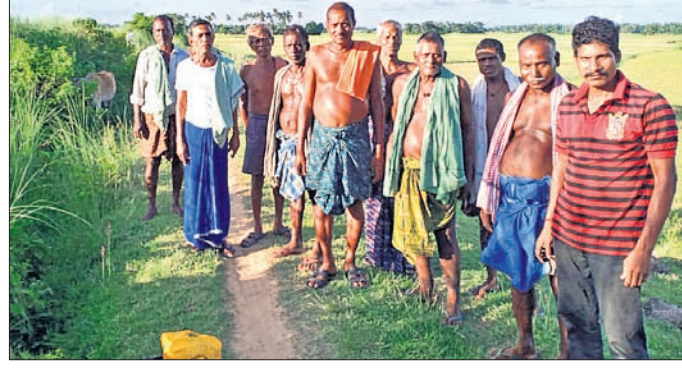
ଚାଷୀମାନେ ପଡ଼ିଆ ପଡ଼ିଥିବା ଚାଷଜମି ଦେଖାଉଛନ୍ତି।

ମୌସୁମୀ ବର୍ଷାରେ ଲୁଚକାଳି ଖେଳ ଯାଇଛି କେନାଲ ସଫା ନ ହେବାରୁ ସାଲେପୁର ବ୍ଲକର ବହୁ ଚାଷଜମିରେ ଜଳସେଚନ ହୋଇପାରୁନାହିଁ। ଏଥିପାଇଁ ଅନେକ ଚାଷ ଜମି ପଡ଼ିଆ ପଡ଼ିଛି। ଫଳରେ ଚାଷୀ ଅସନ୍ତୋଷ ବୃଦ୍ଧି ପାଇବାରେ ଲାଗିଛି। ଚାଷ କାର୍ଯ୍ୟ ପାଇଁ ଗ୍ଲାମାୟ ଅଞ୍ଚଳର ଚାଷୀମାନେ ମୁଖ୍ୟତଃ କେନାଲ ଓ ବର୍ଷା ଉପରେ ନିର୍ଭର କରିଥାନ୍ତି। ଏକଲିପ୍ଟିତରେ ଚାଷ କାର୍ଯ୍ୟ ପାଇଁ ଚାଷୀ ସାଲେପୁର ବ୍ଲକ ଅନ୍ତର୍ଗତ ତେନ୍ତୋଳ