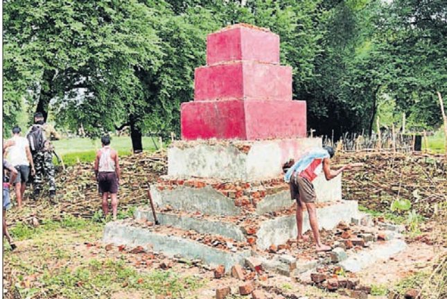
ଯବାନମାନେ ଭାଙ୍ଗି ଦେଇଯାଇଥିବା ମାଓବାଦୀଙ୍କ ଶହୀଦ ସ୍ତୁପକୁ ସ୍ଥାନୀୟ ଲୋକେ ଦେଖୁଛନ୍ତି।

ମାଲକାନଗିରି ଜିଲା ସୀମାନ୍ତ ଛତିଶଗଡ଼ର ଥାନା ନିକଟ ଜଙ୍ଗଲରେ ଥିବା ମାଓବାଦୀଙ୍କ ଏକ ଶହୀଦ ସ୍ତୁପକୁ ଶନିବାର ଯବାନମାନେ ଭାଙ୍ଗି ଦେଇଛନ୍ତି। ମାଓବାଦୀ ଉପତୁ ଅଞ୍ଚଳ ଆଲିମପାଲୀ ସହ ଅନ୍ୟ ଜଙ୍ଗଲରେ ତିଆରିକି ଓ ୨୦୧୧ କୋକ୍ରା ବାଟାଲିୟନ ପକ୍ଷରୁ ମିଳିତ କୋର୍ଟି ଅପରେଶନ କରାଯାଇଥିଲା। ଏହି ସମୟରେ ଜଙ୍ଗଲରେ ଯବାନମାନେ ମାଓବାଦୀଙ୍କ ଏକ ଶହୀଦ ସ୍ତୁପ ଦେଖିବାକୁ ପାଇଥିଲେ। ପରେ ସେମାନେ ଏହାକୁ ବାହୁଡ଼ ଲଗାଇ ବିଖୋରଣ କରି ଭାଙ୍ଗିଦେଇଥିଲେ। ଉକ୍ତ ଅଞ୍ଚଳରେ ମାଓବାଦୀମାନେ ନିଜର ସ୍ଥିତି କାହିଁର କରିବା ପାଇଁ ଏହି ଶହୀଦ ସ୍ତୁପ ନିର୍ମାଣ କରିଥିବା କୁହାଯାଉଛି।