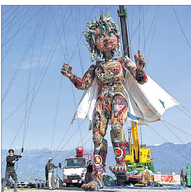
ଗୋକିଓରେ ପହଞ୍ଚିଲା ବିଶାଳ ଅଲିମ୍ପିକ କଣ୍ଠେଇ

ସ୍ୱାଭିଭାବ ଓ ଅଲିମ୍ପିକ ଭେଦ୍ୟରେ ଦେଖିବାକୁ ମିଳିଛି। କୋରିଆ ଏ ନେଇ ଆପତ୍ତି ଉଠାଇଛି। ଆଇଓସି ମଧ୍ୟ ଏହି ପତାକାଗୁଡ଼ିକୁ ବ୍ୟାନ୍ କରିବାକୁ କୋରିଆକୁ ପ୍ରତିଶ୍ରୁତି ଦେଇଛି। ଏହି ପତାକା ଅତୀତରେ ଥିବା ଯୁଦ୍ଧସମ୍ପର୍କକୁ ସୂଚାଉଛି। ପତାକାରେ ଉଦିତ ସୂର୍ଯ୍ୟକାଠାରୁ ୧୬ଟି ରଶ୍ମି ବାହାରୁଥିବାର ଦେଖାଯାଇଛି। ଏହି ବିବାଦକୁ ଆରମ୍ଭ ନ ବଢ଼ାଇବାକୁ ନିଷ୍ପତ୍ତି ନିଆଯାଇଛି। ଏଭଳି ପତାକା ପ୍ରଦର୍ଶନ ଉଭୟ ଦେଶର ରାଜନୈତିକ ତଥା କୂଟନୈତିକ ସମ୍ପର୍କକୁ ଖରାପ କରିବ ବୋଲି କୁହାଯାଇଛି।