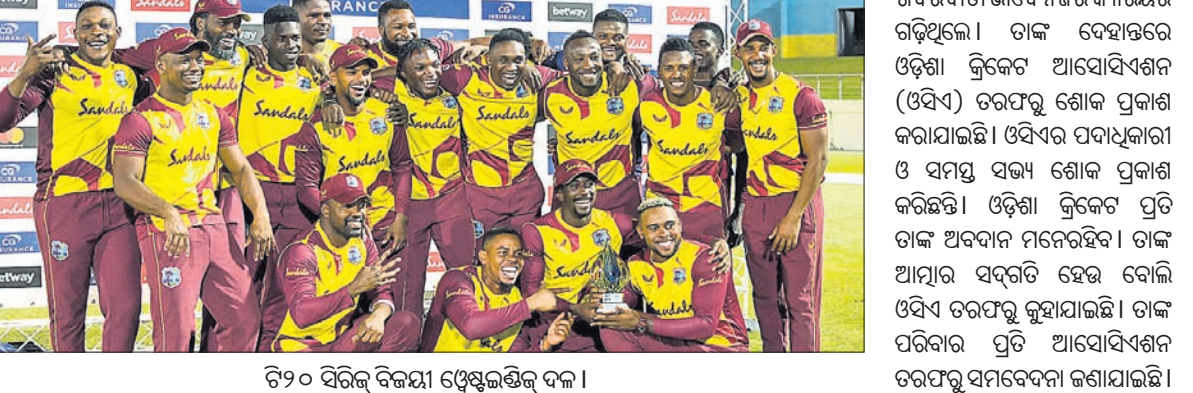
ଟି୨୦ ସିରିଜ୍ ବିଜୟୀ ଡ୍ରେସ୍‌ଇଣ୍ଡିଜ୍ ଦଳ।