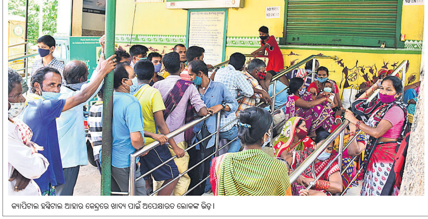
କ୍ୟାମ୍ପିଟାଲ ହସ୍ପିଟାଲ ଆହାର କେନ୍ଦ୍ରରେ ଖାଦ୍ୟ ପାଇଁ ଅପେକ୍ଷାକୃତ ଲୋକଙ୍କ ଭିଡ଼।