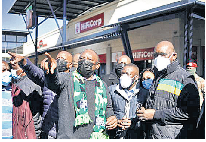
ଦକ୍ଷିଣ ଆଫ୍ରିକା ରାଷ୍ଟ୍ରପତି ସିରିଲ ରାମାଫୋସା କୋହାଟ୍ଟୁବର୍ଗର ସୋପ୍ଟେଟୋରେ ରବିବାର ସ୍ଥିତି ସମୀକ୍ଷା କରୁଛନ୍ତି।

ଜାକବ ଜୁମା ରାଷ୍ଟ୍ରପତି ଥିବାବେଳେ ଗୁପ୍ତା ବ୍ରଦର୍ସ ତାଙ୍କର ଅତି ଘନିଷ୍ଠ ଥିଲେ। ଜୁମାଙ୍କ ବିରୋଧରେ ଆସିଥିବା ଦୁର୍ନୀତି