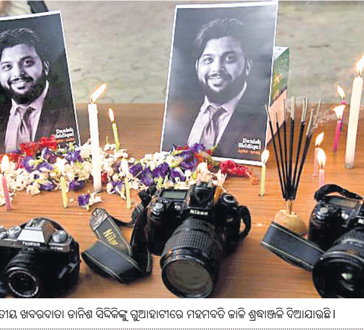
ଆଫଗାନିସ୍ତାନରେ ନିହତ ଭାରତୀୟ ଖବରଦାତା ତାରିଖ ସିଦ୍ଦିକଙ୍କୁ ଗୁଆହାଟୀରେ ମହମବତି ଜାକି ଶ୍ରଦ୍ଧାଞ୍ଜଳି ଦିଆଯାଇଛି।

କନ୍ଦେନ, ୧୮।୭: ରାଜସ୍ଥାନର ଗଙ୍ଗାପୁର ସହରରେ ଜଣେ କୋଭିଡ଼ ସଂକ୍ରମିତଙ୍କ ଘରେ