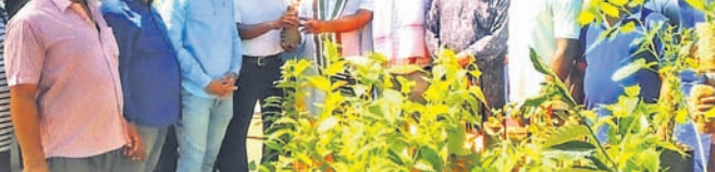
ଉପସ୍ଥିତ ଅତିଥି ବୃନ୍ଦ ।