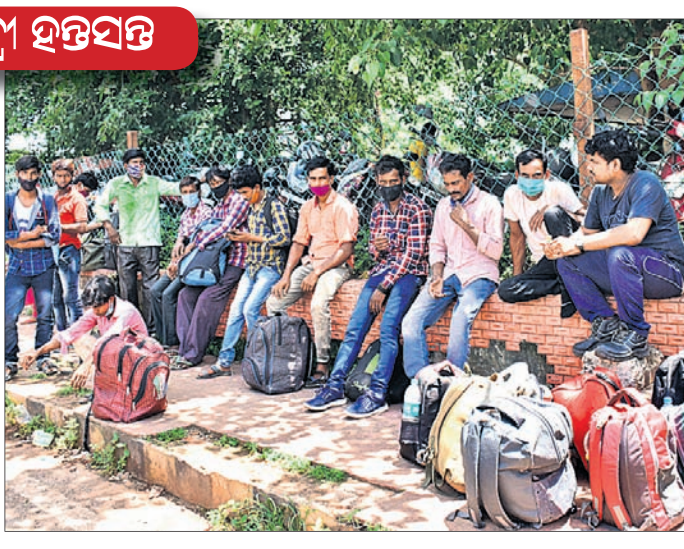
ସପ୍ତାହାତ୍ର ଶତ୍ରୁତା ପାଇଁ ଗାଡ଼ି ନ ପାଇ ରବିବାର ଭୁବନେଶ୍ଵର ରେଳ ଷ୍ଟେସନରେ ଯାତ୍ରୀମାନେ ଚାଲିଲେ ଯାଉଛନ୍ତି। ଆଉ କେତେଜଣ ଗଲୁକୁ ଅପେକ୍ଷା କରିଛନ୍ତି।