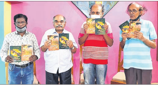
ଅଭିଯୋଗ ପୁସ୍ତକ ଉଦ୍ଘୋଷଣା କରୁଛନ୍ତି ।