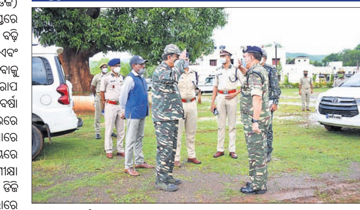
ପୋଲିସ୍ ରିଜର୍ଟ ପଢ଼ିଆରେ ଡିଡିପି ଓ ଅନୁମୋଦନ ।

ରାଜ୍ୟ ପୋଲିସ୍ ମହାନିର୍ଦ୍ଦେଶକ (ଡିଜି) ଅଧିକାରୀଙ୍କୁ ସୁଧାରିବା ପାଇଁ ଭବିଷ୍ୟତ ସୁଧାରଣା ପ୍ରସ୍ତୁତ କଲା ଭାବପା ସୁବର୍ଣ୍ଣକାନ୍ତ ସମାଜ ସହଯୋଗ କମିଟି ସଭାରେ ଚର୍ଚ୍ଚା ଅଧିବେଶନ ଯାରି ରଖାଯାଇଛି ।