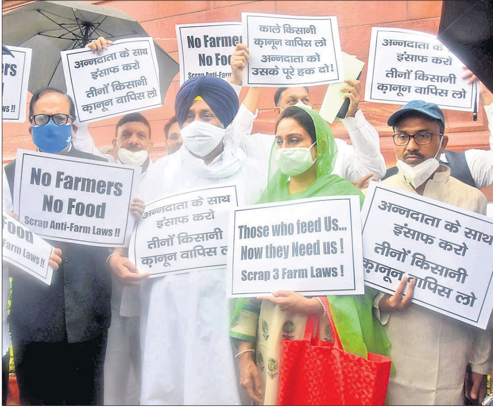
ଯୋଗଦାନ ପାଇଁ ନେତୃତ୍ୱ ନେଇ ଥାନା ଅଧିକାରୀଙ୍କ ଆରମ୍ଭ ହୋଇଥିବାବେଳେ କେତେକ ଦଳର ସମ୍ପର୍କରେ ପୁଲିସ୍ ପ୍ରଦର୍ଶନ କରି ବିବାଦୀୟ ୩ ନୂଆ ଆଇନ ପ୍ରଚାରା କରିବାକୁ ଦାବି କରୁଛନ୍ତି।

ଭୁବନେଶ୍ୱର, ୧୯।୭(ବୁଧବେଳା): ମାଧ୍ୟମିକ ଶିକ୍ଷା ପରିଷଦ(ବୋର୍ଡ) ଯୋଗଦାନ ଓଡ଼ିଶା ସେକେଣ୍ଡାରୀ ସ୍କୁଲ ଡିଗ୍ରୀର ଏଲିମିନେଟିଡ୍ ଚେଷ୍ଟା (ଓଏସ୍‌ସ୍‌ସିସି) ୨୦୨୧ ପାଇଁ ଫର୍ମ ପୂରଣ ଅବଧୂ ବୃଦ୍ଧି କରିଛି।