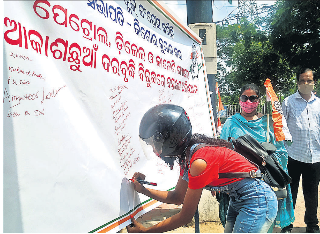
ପେଟ୍ରୋଲ, ଡିଜେଲ ଓ କାଲେଣି ଗ୍ୟାସ୍‌ର ଅହେତୁକ ଦର ବୃଦ୍ଧି ପ୍ରତିବାଦରେ କଟକ ସିଟି ପେଟ୍ରୋଲ ପମ୍ପ ନିକଟରେ କଂଗ୍ରେସ ପକ୍ଷରୁ ଜନସଚେତନତା ଦସ୍ତଖତ ଅଭିଯାନ।