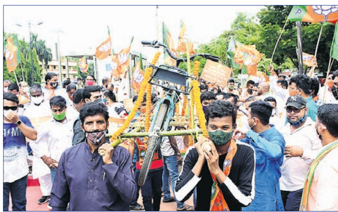
ଭାବପା ପକ୍ଷରୁ 'ମୋ ସାଇକେଲ'କୁ କୋକେଲ ଶୋଭାଯାତ୍ରାରେ ନିଆଯାଇଛି।