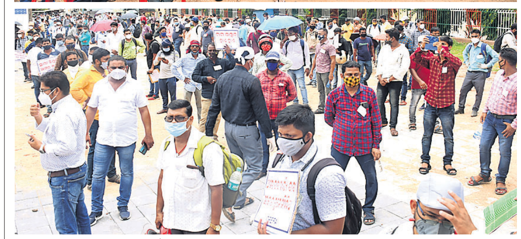
ସ୍ଥାୟୀ ନିଯୁକ୍ତି ଦାବିରେ ଉଦ୍‌ଘୋଷଣା କରିବା ପାଇଁ କର୍ମଚାରୀମାନେ ଯୋଗଦାନ କରିଥିବା ଭୁବନେଶ୍ୱର ଲକ୍ଷ୍ମଣ ଚାଉଳ ଉତ୍ପାଦନ ଅଫିସକୁ ଘେରାଉ କରିବା ସହ ବିକ୍ଷୋଭ ପ୍ରଦର୍ଶନ କରୁଥିଲେ (ଡି.ଏନ.ଏ.)