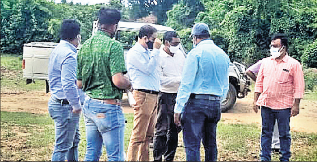
ଓଡ଼ିଶା ଅଧିକାରୀମାନେ ଆନ୍ଧ୍ରର ଇଞ୍ଜିନିୟରଙ୍କ ସହ ଆଲୋଚନା କରୁଛନ୍ତି ।

ରାୟଗଡ଼ା ବ୍ଲକ ବିରୋଗୀ ହଲ୍ ଆ ପଞ୍ଚାୟତ ସାନଲାକୃତି ଗାଁ ନାଳରେ ଅର୍ଦ୍ଧନିର୍ମିତ ପୋଲକୁ ପୁନଃ ନିର୍ମାଣ କରିବାକୁ ଆନ୍ଧ୍ର ଅନୁମତି ମାଗିଥିଲା । କିନ୍ତୁ ରାୟଗଡ଼ା ପ୍ରଶାସନ ସେମାନଙ୍କୁ ମନା କରିଦେଇଛି । କିଛି ଦିନ ପୂର୍ବରୁ ଗାଁ ନାଳରେ ଏକ ହେବ, ତାହା ଓଡ଼ିଶା ସରକାରଙ୍କ ପକ୍ଷରୁ କରାଯିବ ବୋଲି ରାୟଗଡ଼ା ପ୍ରଶାସନିକ ଅଧିକାରୀମାନେ ସ୍ୱପ୍ନ କରିଛନ୍ତି । ପୂର୍ବରୁ ଅନୁମତି, ରାୟଗଡ଼ା ବ୍ଲକ ବିରୋଗୀ ହଲ୍ ଆ ପଞ୍ଚାୟତ ଅଧିକାରୀ ସାନଲାକୃତି ଗାଁ ନାଳରେ ଆନ୍ଧ୍ର ପୋଲ ନିର୍ମାଣ କରୁଥିଲା । ସାନଲାକୃତି ଗାଁ ନାଳରେ ୨୬.୫୫ ମି. ଦୂରରେ ଆନ୍ଧ୍ରର ଲାଡ଼ା ଗ୍ରାମ ରହିଛି । ଲାଡ଼ାକୁ ଯିବାକୁ ହେଲେ ଓଡ଼ିଶା ରାସ୍ତା ଡେଇଁ ଯିବାକୁ ହୁଏ । ଲାଡ଼ା ଗ୍ରାମବାସୀଙ୍କ ପାଇଁ ସାନଲାକୃତି-ଲାଡ଼ା ମଧ୍ୟରେ ଥିବା ନାଳରେ ଆନ୍ଧ୍ର ପୋଲ ନିର୍ମାଣ କରୁଥିଲା । ଗୋଟିଏ ପିଲାର ଆନ୍ଧ୍ରରେ ଓ ଡୁଇଟି ପିଲାର ଓଡ଼ିଶା ସାମାଜ୍ୟରେ ରହିଥିଲା । ଖବରପାଠ