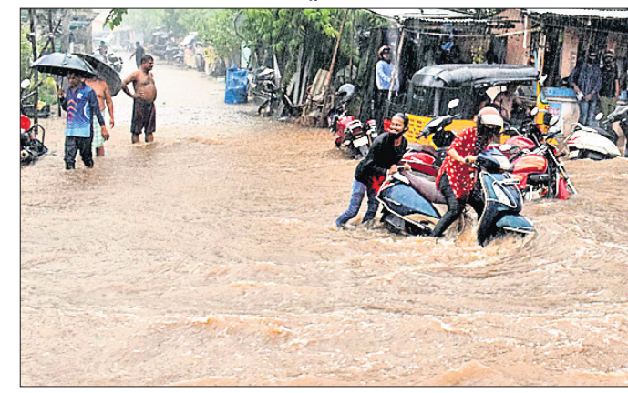
ଶାସ୍ତ୍ରୀ ନଗର ଛକ ରାସ୍ତାରେ ବର୍ଷା ପାଣିର ସୁଅ।

ରହିଗଲେ। ବର୍ଷା ଚାଣ୍ଡବ ସାମାନ୍ୟ ହୁଏ ପାଇବା ପରେ ନିଜେ ନିଜର ଗଡ଼ବ୍ୟ ସ୍ଥଳକୁ ଯିବାକୁ ଉଦ୍ୟମ କରିଥିଲେ। ମାତ୍ର ରାସ୍ତାରେ ଜମି ରହିଥିବା ଅଣ୍ଟା ଧାରି ଆଉ କିଛି ସମୟ ଅପେକ୍ଷା କରିବାକୁ ଲୋକମାନଙ୍କୁ ବାଧ୍ୟ କରିଥିଲା। ଭୁବନେଶ୍ୱର ସାଙ୍ଗକୁ ଜଳସ୍ରୋତ ଅବରୋଧ ଯୋଗୁ ସହରରେ ଏକ କୁଟ୍ରିମ ବନ୍ୟା ପରିସ୍ଥିତି ସୃଷ୍ଟି ହୋଇଥିଲା। ଇନ୍ଦନ ମନ୍ଦିର ସମ୍ମୁଖ, ନୟାପଲ୍ଲୀ ବେହେରା ସାହି, ଆଚାର୍ଯ୍ୟ ବିହାର, ଜୟଦେବ ବିହାର, ରମ୍ଭୁଲଗଡ଼, ବନିଖାଲ, କଳ୍ପନା ଛକ, ଶିରିପୁର, ବରମୁଣ୍ଡା, ଗଣ୍ଡମୁଣ୍ଡା, ପଥରବନ୍ଧ, ମହିଷାଖାଲ, ଲକ୍ଷ୍ମୀସାଗର, ନିଗମାନନ୍ଦ ନଗର, ସତ୍ୟବିହାର, ଜଗନ୍ନାଥ ବସ୍ଟି, ଚନ୍ଦ୍ରଶେଖରପୁର କୋଅପରେଟିଭ କଲୋନୀ, କୋଟିଳାଖାଲ ହାଟ ସମ୍ମୁଖରେ ଅଣ୍ଟା ଧାରି ପାଣି ବୁଡ଼ି ଚାଲିଥିଲା। ଭୁବନେଶ୍ୱର ଆଞ୍ଚଳିକ ପାଣିପାଗ କାର୍ଯ୍ୟାଳୟ ପକ୍ଷରୁ ମିଳିଥିବା ସୂଚନା ଅନୁଯାୟୀ ଭୁବନେଶ୍ୱରରେ ୭୭ ମିଲିମିଟର ବର୍ଷା ହୋଇଥିବା ବେଳେ କଟକରେ ୩୭ ମିଲିମିଟର ବର୍ଷା ହୋଇଛି। ଯଦି ଏହି ବର୍ଷାରେ ସହର ଅଧିକ