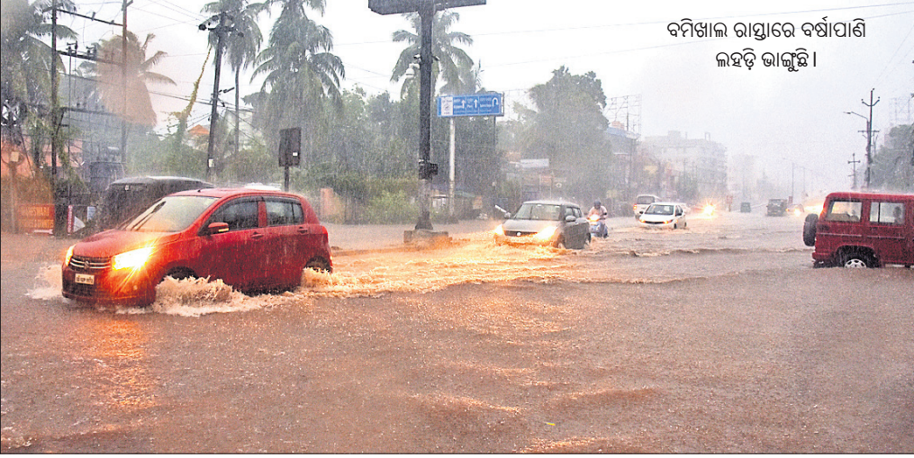
ବନିଖାଲ ରାସ୍ତାରେ ବର୍ଷାପାଣି ଲହଡ଼ି ଭାଙ୍ଗୁଛି।