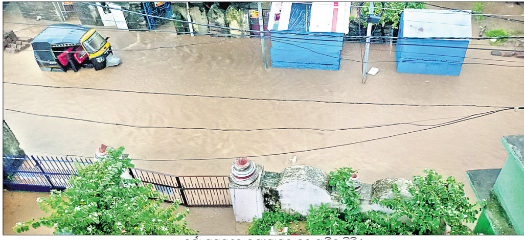
ବର୍ଷା ସମୟରେ ଲକ୍ଷ୍ମୀସାଗର ତଳ ସାହିର ସ୍ଥିତି।

କିଲୋମିଟର ଡ୍ରେନ୍ ମାରାପତି ଅଥବା ପୁନଃ ନିର୍ମାଣ କରାଯାଇଛି। କେବଳ ସେତିକି ନୁହେଁ, ଭୁବନେଶ୍ୱରର ଜଳ ନିଷ୍କାସନ ବ୍ୟବସ୍ଥାକୁ ସୁଧାରିବା ସକାଶେ ୨୦୧୮ରେ ଜଳସମ୍ପଦ ବିଭାଗ ପକ୍ଷରୁ ଏକ ମେଗା ଡ୍ରେନେଜ ବ୍ୟବସ୍ଥା କରିବାକୁ ଯୋଜନା କରାଯାଇଥିଲା। ନୟାପଲ୍ଲୀ, ଜୟଦେବ ବିହାର, ଆଚାର୍ଯ୍ୟ ବିହାର ମଧ୍ୟରେ ଭୁବନେଶ୍ୱର ନିଷ୍କାସନ ବ୍ୟବସ୍ଥାକୁ ପରିଚଳନା କରାଯାଇଥିଲା। ତେବେ ତାହା ଏବେ ବି ଅସମ୍ପୂର୍ଣ୍ଣ ହୋଇ ରହିଛି। ସହରରେ ଦିନକୁ ଦିନ ଜନସଂଖ୍ୟା ବଢ଼ୁଥିବାରୁ ମନଭଲ୍ଲୀ ଗୃହ ନିର୍ମାଣ ଚାଲିଛି। ଜଳାଶୟ ପୂର୍ଣ୍ଣ ବନ୍ଦ ହେବାରେ ଲାଗିଛି। ମଙ୍ଗଳବାର ଅପରାହ୍ନ ୪ଟାରେ ହଠାତ୍ ମାଡ଼ିଆସିଲା କଳାହାଣ୍ଡିଆ ମେଘ। ପ୍ରବଳ ବର୍ଷାରେ ସମଗ୍ର ରାଜଧାନୀ ହୋଇଗଲା ଜଳାଶୁବ। ଘୂମୁ ଓଭରଠାରୁ ଆରମ୍ଭ କରି ରାସ୍ତାଘାଟ, ଖାଲୁଆ ଅଞ୍ଚଳ ସବୁଠି ଜଳତାଣ୍ଡବ। ବୁଲଘଣ୍ଟା ପ୍ରବଳ ବର୍ଷା ଯୋଗୁ ସହରର ଜନଜୀବନ ଗ୍ରସ୍ତ ହୋଇଗଲା। ଯିଏ ଯେଉଁଠି ଥିଲେ ମୁଣ୍ଡଗୁଣ୍ଡି