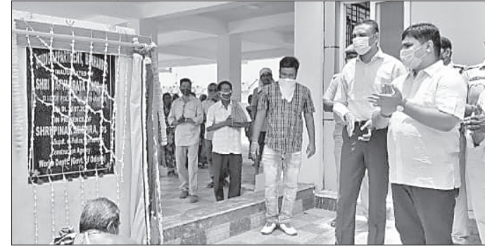
ପୋଲିସ୍ ଗ୍ରାନ୍ତିକ୍ ହାତକୁ ଉଦ୍ଧାର କରୁଛି ଦକ୍ଷିଣାଞ୍ଚଳ ଆରକ୍ଷୀ ଉପ ମହାନିର୍ଦ୍ଦେଶକ।