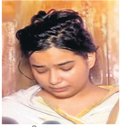
ବିଦ୍ୟାଭାରତୀ ହତ୍ୟା ଖଡ଼ଯନ୍ତ୍ର କରାଯାଇଥିଲା ବୋଲି ଜୁନିଆ ଗଣମାଧ୍ୟମ ଆଗରେ କହିଛନ୍ତି।

ଝଣନ କରିଛନ୍ତି। ହତ୍ୟା ମାମଲାରୁ ଖସିଯିବା ପାଇଁ ବିଦ୍ୟା ଚାଲି ଚଳାଇଥିବା ସେ କହିଛନ୍ତି। ଯଦି ଏକଥା ସତ ହୋଇଥାଏ ତେବେ ପୋଲିସ୍ ପାଖରେ ଥିବା ମୋବାଇଲ୍ ଯାଞ୍ଚ କଲେ ସବୁକିଛି ଜଣାପଡ଼ିବ।