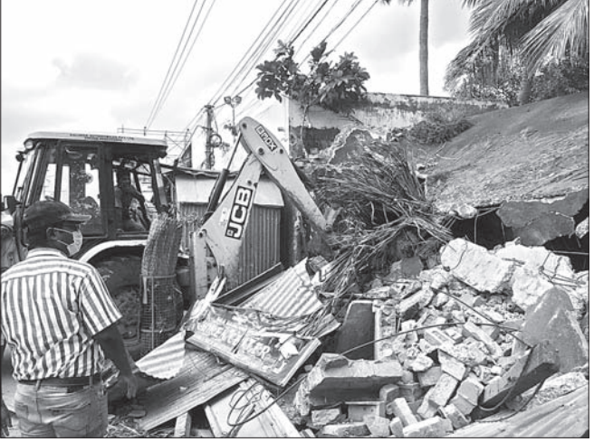
ବିଏମ୍ପିର ଜବରଦସ୍ତୀ ଭିକ୍ଷା