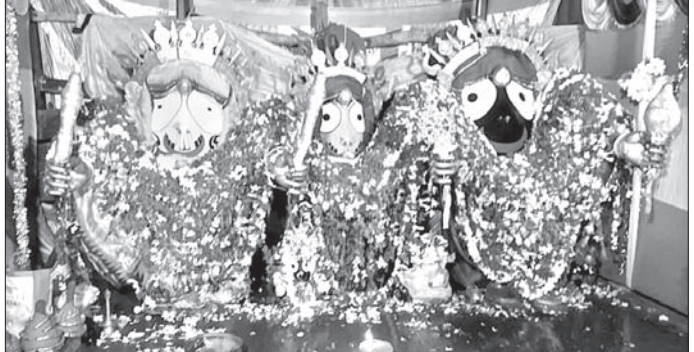
ଧରାକୋଟରେ ମନ୍ଦିରରେ ୩ ଠାକୁରଙ୍କ ରାଜା ବେଶ।