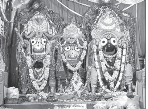
କୋର୍ଟପେଟା ଜଗନ୍ନାଥ ମନ୍ଦିର ଅଗ୍ରାୟୀ ମୁଖପରେ ତିନି ଠାକୁର।