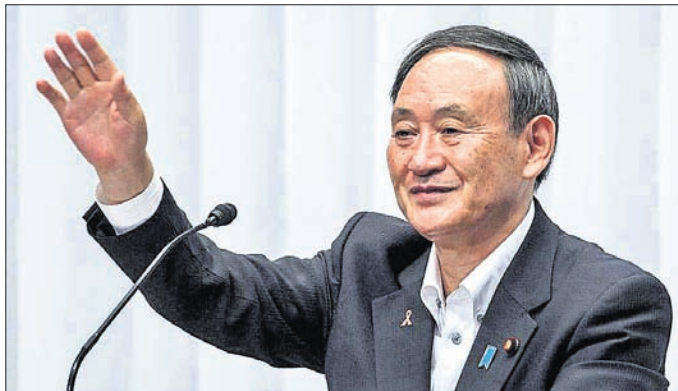
ଜାପାନ ପ୍ରଧାନମନ୍ତ୍ରୀ ଯୋଶିହିଦେ ସୁରା।

ସୁରା ବିଶ୍ୱ ଏକ ସମ୍ପୂର୍ଣ୍ଣ ସୁରକ୍ଷିତ ଅଲିମ୍ପିକ୍ସ ଆୟୋଜନ ଦେଖିବ ବୋଲି ମଙ୍ଗଳବାର ଜାପାନ ପ୍ରଧାନମନ୍ତ୍ରୀ ଯୋଶିହିଦେ ସୁରା କହିଛନ୍ତି। ଟୋକିଓ ଅଲିମ୍ପିକ୍ସ ଆୟୋଜନ ହେବାର ଠିକ୍ ଦୁଇଦିନ ପୂର୍ବରୁ ଏଭଳି ମନ୍ତବ୍ୟ ଦେଇ ସେ ସୁରା ବିଶ୍ୱକୁ ଏକ ସକାରାତ୍ମକ ସନ୍ଦେଶ ଦେବାକୁ ପ୍ରୟାସ କରିଛନ୍ତି। ଆଧିକାର, ଅର୍ଥସିଆଲ, ରେମ୍ ଷ୍ଟାଫ୍ ଓ ଗଣମାଧ୍ୟମ ପ୍ରତିନିଧିତ୍ୱ ସମେତ ମୋଟ ୧୦ ହଜାର ବ୍ୟକ୍ତି ଜାପାନରେ ପଦାର୍ପଣ କରିଛନ୍ତି। ଦେଶର ନାଗରିକଙ୍କ ପ୍ରବଳ ବିରୋଧ ସତ୍ତ୍ୱେ ଟୋକିଓ ଓ ଆଖପାଖ ଅଞ୍ଚଳରେ ଲମ୍ବକେନ୍ଦ୍ରିତ ଭାବେ କରାଯାଇଛି। ବୁଧବାରଠାରୁ ଇଭେଣ୍ଟୁଆଲ ଆୟୋଜନ ହେବା ଆରମ୍ଭ ହେବ। ସମ୍ପୂର୍ଣ୍ଣ ଓ ମହିଳା ପୁରସ୍କାର ମ୍ୟାଟ୍ରିକ୍ୟୁଲ ପ୍ରଥମେ ଖେଳାଯିବ। ଏହାର ଦୁଇଦିନ ପରେ ଔପଚାରିକ ଭାବେ ଉଦ୍‌ଘାଟନା ଉତ୍ସବ ଆରମ୍ଭ ହେବ। କୋଭିଡ୍-୧୯ ସଂକ୍ରମଣ ପାଇଁ ଅଲିମ୍ପିକ୍ସକୁ ଗୋଟିଏ ଦିନ ଗୁଞ୍ଜାଇ ଦିଆଯାଇଥିଲା।