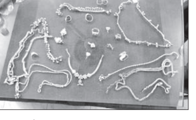
ଜବତ ସୁନା ଓ ରୂପା ଅଳଙ୍କାର।