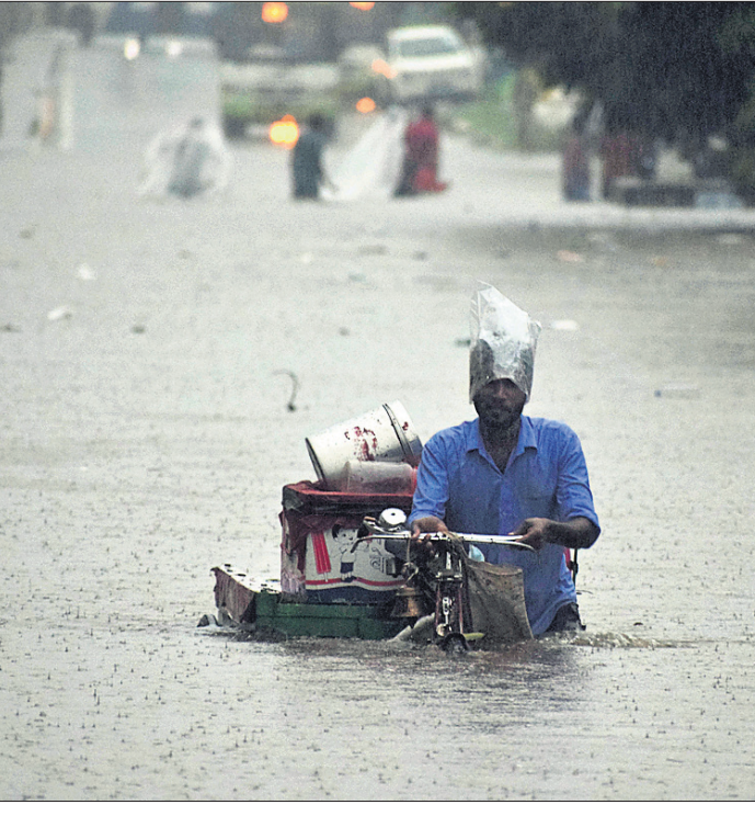
ଭୁବନେଶ୍ୱରରେ ମଙ୍ଗଳବାର ଅପରାହ୍ନରେ ହୋଇଥିବା ବର୍ଷାରେ ଇନ୍ଦନ ମନ୍ଦିର ସମ୍ମୁଖ ରାସ୍ତାରେ ବସ୍ ଓ କାରଗୁଡ଼ିକ ଅଧା ବୁଡ଼ିଯାଇଛି। ଜଣେ ବ୍ୟକ୍ତି ବୁଲିଲେ ଜିନିଷପତ୍ର ଧରି ଅଣ୍ଟା ଧାରିରେ ପଶି ଯାଉଛନ୍ତି।