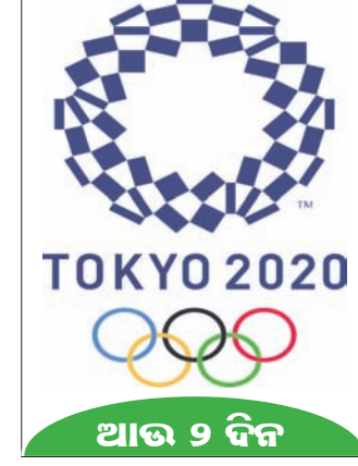
ଆଉ ୨ ଦିନ

ମୋଟେ ଏହି ମାମଲାରେ ବହୁ ସଂଖ୍ୟାରେ ପରାମର୍ଶ ଓ ଉପଦେଶ ମିଳିଥିଲା। ଏହାକୁ ସମ୍ମାନ ସହିତ ଗ୍ରହଣ କରୁଛି। ଇସ୍ତଫାରେ କାର୍ଯ୍ୟକରିବା ଅସମ୍ଭବ ଓ ନିଜର ଚିନ୍ତାଧାରାରେ ଏଭଳି ଭୁଟିକୁ ନ ଦୋହରାଇବାକୁ ଚେଷ୍ଟା କରିବେ ବୋଲି ସେ ଉଲ୍ଲେଖ କରିଛନ୍ତି। ପିଲାଦିନେ କରିଥିବା ଭୁଲ ଓ ଏଭଳି ଆଚରଣ ପାଇଁ କ୍ଷମା ମାଗୁଛି ବୋଲି ସେ କହିଛନ୍ତି। ଉଲ୍ଲେଖାଥାଉ କି ପିଲାଦିନେ ସେ ନିଜର ଜଣେ ଦିବ୍ୟାଙ୍ଗ ସହପାଠୀଙ୍କୁ ଦୁର୍ବ୍ୟବହାର କରିଥିଲେ। ୧୯୯୦ରେ ସେ ଜାପାନର ଏକ ମାଗାଜିମ୍‌କୁ ସାକ୍ଷାତକାର ଦେବା ବେଳେ ପିଲାବେଳର ଏହି ଭୁଟି ସମ୍ପର୍କରେ ସୂଚନା ଦେଇଥିଲେ। ତେବେ ଏହାପରେ ତାଙ୍କୁ ବିଭିନ୍ନ ସୋସିଆଲ ମିଡ଼ିଆ ଓ ଅନ୍ୟାନ୍ୟ ଗଣମାଧ୍ୟମରେ ବେଶ୍ ସମାଲୋଚନା