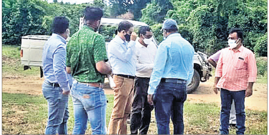
ଓଡ଼ିଶା ଅଧିକାରୀମାନେ ଆନ୍ଧ୍ର ଲଞ୍ଜିନିୟର ସହ ଆଲୋଚନା କରୁଛନ୍ତି ।

ରାୟଗଡ଼ା ଅଫିସ, ୨୦।୭ ରାୟଗଡ଼ା ବ୍ଲକ୍ ବିଭାଗୀ ହଲ୍‌ରେ ଆଞ୍ଚଳିକ ସାନଲାକୃତି ଗାଁ ନାଳରେ ଅର୍ଦ୍ଧନିର୍ମିତ ପୋଲକୁ ପୁନଃ ନିର୍ମାଣ କରିବାକୁ ଆନ୍ଧ୍ର ଅନୁମତି ମାଗିଥିଲା । କିନ୍ତୁ ରାୟଗଡ଼ା ପ୍ରଶାସନ ସେମାନଙ୍କୁ ମନା କରିଦେଇଛି ।