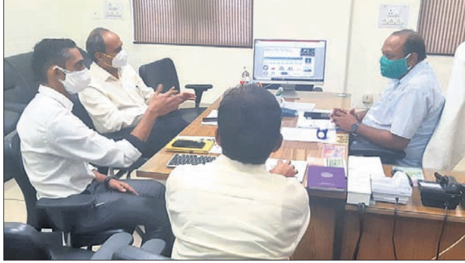
ଦକ୍ଷିଣ ବିକାଶ ଓ ବୈଷୟିକ ଶିକ୍ଷା ମନ୍ତ୍ରୀ ପ୍ରୋମାନନ୍ଦ ନାୟକ ସମାକ୍ଷୀ କରୁଛନ୍ତି ।

ଦକ୍ଷିଣ ବିକାଶ ଓ ବୈଷୟିକ ଶିକ୍ଷା ମନ୍ତ୍ରୀ ପ୍ରୋମାନନ୍ଦ ନାୟକ ସମାକ୍ଷୀ କରୁଛନ୍ତି । ସାମିଲ କରାଯିବା ଉଚିତ । ଏହାଦ୍ୱାରା ଏକ ବିକଶିତ ସମାଜ ଗଠନ ସମ୍ଭବ ହୋଇପାରିବ ବୋଲି ମନ୍ତ୍ରୀ ପ୍ରକାଶ କରିଛନ୍ତି । ଏହି ଅବସରରେ ଦକ୍ଷିଣ ବିକାଶ ଓ ବୈଷୟିକ ଶିକ୍ଷା ବିଭାଗର