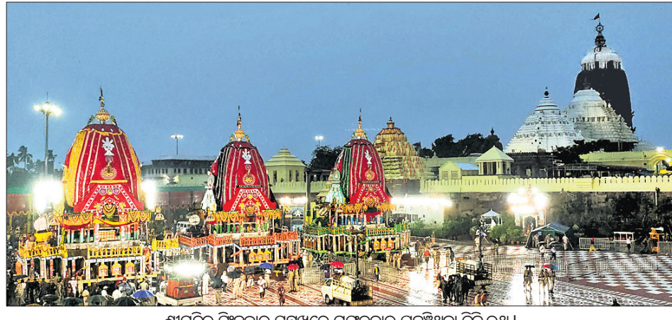
ଶ୍ରୀମନ୍ଦିର ସମ୍ମୁଖରେ ମଙ୍ଗଳବାର ପହଞ୍ଚିଥିବା ତିନି ରଥ।