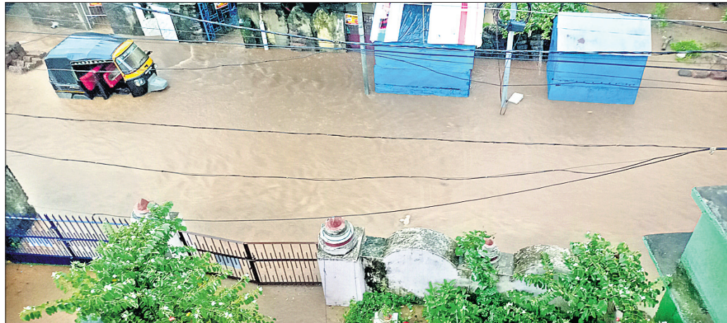
ବର୍ଷା ସମୟରେ ଲକ୍ଷ୍ମୀସାଗର ତଳ ସାହିର ସ୍ଥିତି।

କିଲୋମିଟର ଡ୍ରେନ୍‌କୁ ମରାମତି ଅଥବା ପୁନଃ ନିର୍ମାଣ କରାଯାଇଛି। କେବଳ ସେତିକି ନୁହେଁ, ଭୁବନେଶ୍ୱରର ଜଳ ନିଷ୍କାସନ ବ୍ୟବସ୍ଥାକୁ ସୁଧାରିବା ସମ୍ପର୍କରେ ୨୦୧୮ରେ ଜଳସମ୍ପଦ ବିଭାଗ ପକ୍ଷରୁ ଏକ ମେଗା ଡ୍ରେନେଜ ବ୍ୟବସ୍ଥା କରିବାକୁ ଯୋଜନା କରାଯାଇଥିଲା। ନୟାପଳା, ଜୟଦେବ ବିହାର, ଆଗାୟମ ବିହାର ମଧ୍ୟରେ ଭୁବନେଶ୍ୱର ନଗର ନିଗମ ପରିକଳ୍ପନା କରାଯାଇଥିଲା। ତେବେ ତାହା ଏବେ ବି ଅସମ୍ପୂର୍ଣ୍ଣ ହୋଇ ରହିଛି। ସହରରେ ଦିନକୁ ଦିନ ଜନସଂଖ୍ୟା ବଢ଼ୁଥିବାରୁ ମନଭଙ୍ଗା ଗୃହ ନିର୍ମାଣ ଚାଲିଛି। ଜଳାଣ୍ଡି ପୂର୍ଣ୍ଣ ବନ୍ଦ ହେବାରେ ଲାଗିଛି। ମଙ୍ଗଳବାର ଅପରାହ୍ଣ ୪ଟାରେ ହଠାତ୍ ମାଡ଼ିଆସିଲା କଳାହାଣ୍ଡିଆ ମେଘ। ପ୍ରବଳ ବର୍ଷାରେ ସମଗ୍ର ରାଜଧାନୀ ହୋଇଗଲା ଜଳାଣ୍ଡିବ। ଘୂର୍ଣ୍ଣି ଓଜରଠାରୁ ଆରମ୍ଭ କରି ରାସ୍ତାଘାଟ, ଖାଲୁଆ ଅଞ୍ଚଳ ସବୁଠି ଜଳତାଣ୍ଡିବ। ବୁଲିଯିବା ପ୍ରବଳ ହୋଇଗଲା। ଯିଏ ଯେଉଁଠି ଥିଲେ ମୁଣ୍ଡଗୁଞ୍ଜି