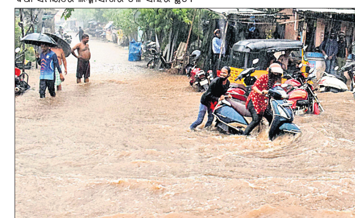
ଶାସ୍ତ୍ରୀ ନଗର ଛକ ରାସ୍ତାରେ ବର୍ଷା ପାଣିର ସୁଅ।

ରହିଗଲେ। ବର୍ଷା ଚାଣ୍ଡବ ସାମାନ୍ୟ ହୁଏ ପାଇବା ପରେ ନିଜେ ନିଜର ଗଡ଼ବ୍ୟ ସ୍ଥଳକୁ ଯିବାକୁ ଉଦ୍ୟମ କରିଥିଲେ। ମାତ୍ର ରାସ୍ତାରେ ଜଳ ରହିଥିବା ଅଣ୍ଟା ଲେଖା ପାଣି ଆଉ କିଛି ସମୟ ଅପେକ୍ଷା କରିବାକୁ ଲୋକମାନଙ୍କୁ ବାଧ୍ୟ କରିଥିଲା। ଡ୍ରେନ୍ ଅବ୍ୟବସ୍ଥା ସାଙ୍ଗକୁ ଜଳସ୍ରୋତ ଅବରୋଧ ଯୋଗୁଁ ସହରରେ ଏକ କ୍ରିମ୍ ବନ୍ୟା ପରିସ୍ଥିତି ସୃଷ୍ଟି ହୋଇଥିଲା। ଇନ୍ଦନ ମନ୍ଦିର ସମ୍ମୁଖ, ନୟାପଳା ବେହେରା ସାହି, ଆଗାୟମ ବିହାର, ଜୟଦେବ ବିହାର, ରଘୁନାଗଡ଼, ବନିଖାଲ, କଳ୍ପନା ଛକ, ଶିରିପୁର, ବରପୁଣ୍ଡା, ଗଣ୍ଡପୁଣ୍ଡା, ପଥରବନ୍ଧ, ମହିଷାଖାଲ, ଲକ୍ଷ୍ମୀସାଗର, ନିଗମାନନ୍ଦ ନଗର, ସତ୍ୟବିହାର, ଜଗନ୍ନାଥ ବସ୍ଟି, ଚନ୍ଦ୍ରଶେଖରପୁର କୋଅପରେଟିଭ କଲୋନୀ, କୋଟିକାଖାଲ ସାତ ସମ୍ମୁଖରେ ଅଣ୍ଟା ଯାଏ ପାଣି ବୁଡ଼ି ଚାଲିଥିଲା। ଭୁବନେଶ୍ୱର ଆଞ୍ଚଳିକ ପାଣିପାଗ କାର୍ଯ୍ୟାଳୟ ପକ୍ଷରୁ ମିଳିଥିବା ସୂଚନା ଅନୁଯାୟୀ ଭୁବନେଶ୍ୱରରେ ୭୭ ମିଲିମିଟର ବର୍ଷା ହୋଇଥିବା ବେଳେ କଟକରେ ୩୭ ମିଲିମିଟର ବର୍ଷା ହୋଇଛି। ଯଦି ଏହି ବର୍ଷାରେ ସହର ଅବସ୍ଥା ଏଭଳି