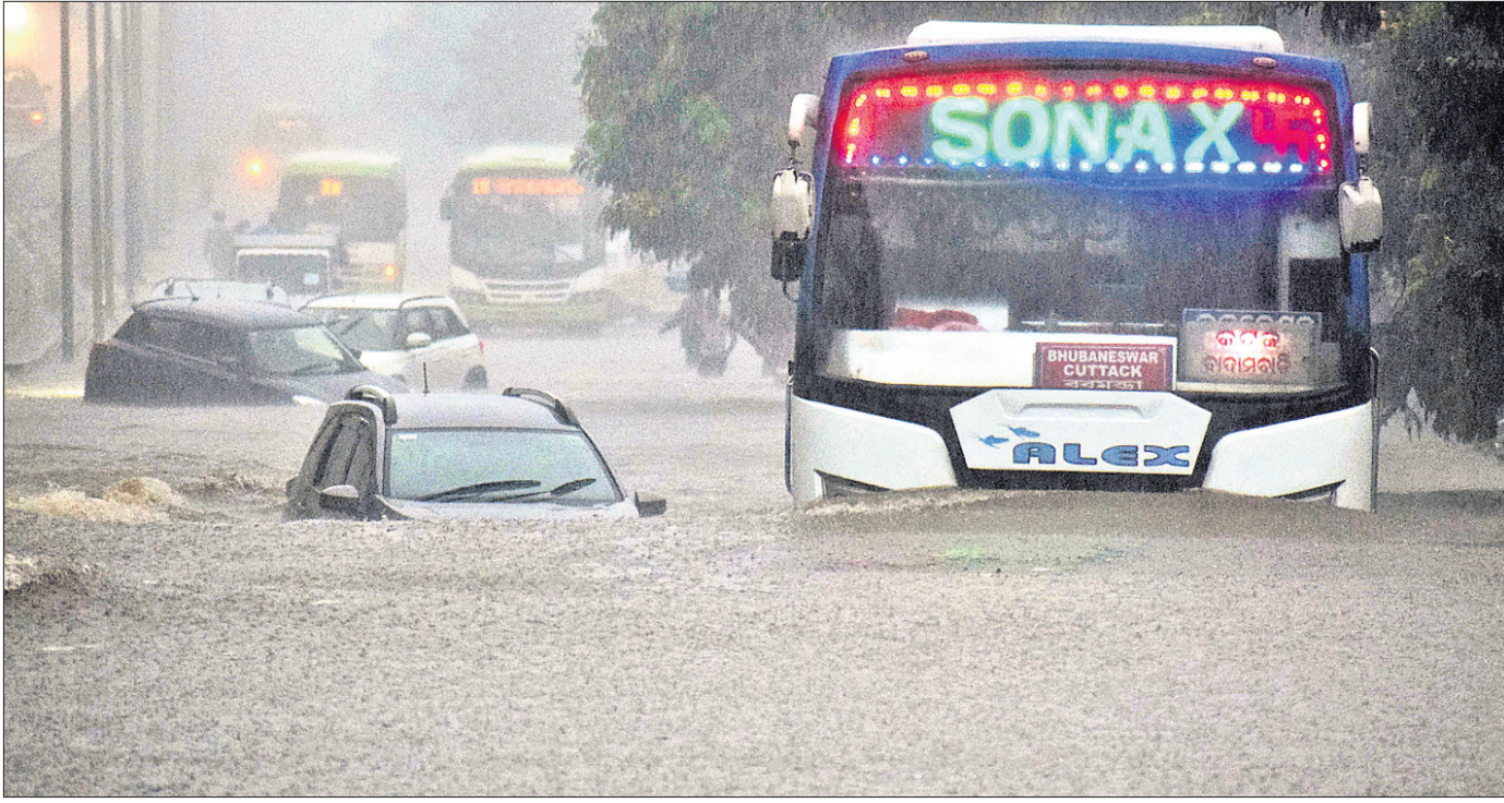
ଭୁବନେଶ୍ୱରରେ ମଙ୍ଗଳବାର ଅପରାହ୍ନରେ ହୋଇଥିବା ବର୍ଷାରେ ଇନ୍ଦନ ମନ୍ଦିର ସମ୍ମୁଖ ରାସ୍ତାରେ ବସ୍ ଓ କାରଗୁଡ଼ିକ ଅଧା ବୁଡ଼ିଯାଇଛି। ଜଣେ ବ୍ୟକ୍ତି ବୁଲିରେ ଜିନିଷପତ୍ର ଧରି ଅଣ୍ଟା ପାଣିରେ ପଶି ଯାଉଛନ୍ତି।

ଭୁବନେଶ୍ୱର, ୨୦୧୨(ବୁଧବାର): ଆସନ୍ତା ୨୩ ତାରିଖରେ ଉତ୍ତର ପଶ୍ଚିମ ବଙ୍ଗୋପସାଗରରେ ଲଘୁଚାପ ସୃଷ୍ଟି ହେବ ବୋଲି ପାଣିପାଗ ବିଭାଗ ପୂର୍ବାନୁମାନ କରିଛି। ଏହାର ପ୍ରଭାବରେ ରାଜ୍ୟରେ ବର୍ଷା କାମି ରହିଛି। ମଙ୍ଗଳବାର ଭୁବନେଶ୍ୱର, କଟକ, ପୁରୀ ସମେତ ବିଭିନ୍ନ ସ୍ଥାନରେ ପ୍ରବଳ ବର୍ଷା ହୋଇଛି। ଏହାପରେ ଚଳିତ ବର୍ଷ ରାଜ୍ୟରେ ନିଅଧିକା ବର୍ଷା ହୋଇଛି। ଜୁନ୍ ୧ରେ ଓଡ଼ିଶାକୁ ଦକ୍ଷିଣ ପଶ୍ଚିମ ମୋସୁମୀ ବାୟୁ ପ୍ରବେଶ କରିଥିଲା। ଠିକ୍ ସମୟରେ ମୋସୁମୀ ପ୍ରବେଶ କରିଥିଲେ ମଧ୍ୟ ଏଯାଏଁ ସ୍ୱାଭାବିକ ବର୍ଷା ହୋଇନାହିଁ। ତେଣୁ କେତେକ ଜିଲ୍ଲାରେ ମଗୁଡ଼ି ସ୍ଥିତି ଦେଖାଦେଇଛି। ଭୁବନେଶ୍ୱର ଆଞ୍ଚଳିକ ପାଣିପାଗ ବିଭାଗ କେନ୍ଦ୍ରର ସୂଚନାନୁସାରେ, ଜୁନ୍ ୧ରୁ ଜୁଲାଇ ୨୦ତାରିଖ ସୁଦ୍ଧା ଓଡ଼ିଶାରେ ୩୧୦.୨ ମି.ମି. ବର୍ଷା ରେକର୍ଡ କରାଯାଇଛି, ଯାହା ସ୍ୱାଭାବିକ ବର୍ଷା ୪୨୯.୪ ମି.ମି.ଠାରୁ ୨୮ ପ୍ରତିଶତ କମ୍ ରହିଛି। ଏହି ସମୟ ମଧ୍ୟରେ ଗୋଟିଏ ଜିଲ୍ଲାରେ ଅଧିକ ନିଅଧିକା, ୧୯ ଜିଲ୍ଲାରେ ନିଅଧିକା ଏବଂ ବାକି ୧୦ ଜିଲ୍ଲାରେ ସ୍ୱାଭାବିକ ବର୍ଷା ରେକର୍ଡ କରାଯାଇଛି। ରାୟଗଡ଼ା, ଗଞ୍ଜାମ, ଗଜପତି, ନବରଙ୍ଗପୁର, କଳାହାଣ୍ଡି, କଳାଙ୍ଗାଳ, ବୌଦ୍ଧ, ସୋନପୁର, କନ୍ଧମାଳ, ଯାଜପୁର, ବାଲେଶ୍ୱର, ସମ୍ବଲପୁର, ଅନୁଗୋଳ, ଦେବଗଡ଼, ସୁନ୍ଦରଗଡ଼, ଝାରସୁଗୁଡ଼ା, ବରଗଡ଼, ମୟୂରଭଞ୍ଜ ଓ କେନ୍ଦୁଝର ଆଦି ୧୯ ଜିଲ୍ଲାରେ ନିଅଧିକା ବା ସ୍ୱାଭାବିକ ବର୍ଷାଠାରୁ ୨୦ ରୁ ୫୯% ଯାଏଁ କମ୍ ରହିଛି। କେବଳ କୋରାପୁଟ ଜିଲ୍ଲାରେ ସର୍ବାଧିକ ୪୨୪.୬ ମି.ମି. ବର୍ଷା ହୋଇଥିବାବେଳେ ଏହା ସ୍ୱାଭାବିକ ବର୍ଷାଠାରୁ ୨୯% କମ୍ ରହିଛି। ସେହିପରି ସର୍ବାଧିକ ପ୍ରଭାବିତ ଜିଲ୍ଲାଗୁଡ଼ିକ ମଧ୍ୟରେ ଭଦ୍ରକ ଜିଲ୍ଲାରେ ୬୧%, ଯାଜପୁର ୫୫%, ବଳାଙ୍ଗୀର ୪୬%, କେନ୍ଦୁଝର ୪୨%, ବୌଦ୍ଧ ଓ ଗଜପତି ଜିଲ୍ଲାରେ ୪୧% କମ୍ ବର୍ଷା ରେକର୍ଡ କରାଯାଇଛି।