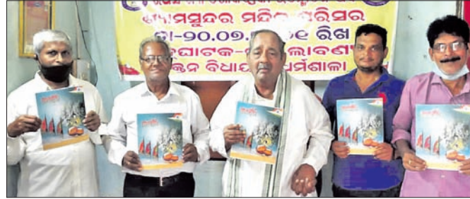
ଅତିଥି 'ଗୋକର୍ଣ୍ଣିକା' ରଥସଂଖ୍ୟା ଉନ୍ନୋଚନ କରୁଛନ୍ତି।