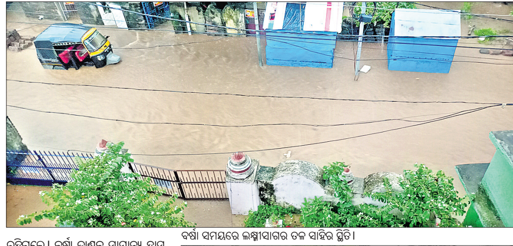
ବର୍ଷା ସମୟରେ ଲକ୍ଷ୍ମୀପାହାର ତଳ ସାହିର ସ୍ଥିତି।

କିଲୋମିଟର ଡ୍ରେନ୍‌କୁ ମରାମତି ଅଥବା ପୁନଃ ନିର୍ମାଣ କରାଯାଇଛି। କେବଳ ସେତିକି ନୁହେଁ, ଭୁବନେଶ୍ୱରର ଜଳ ନିଷ୍କାସନ ବ୍ୟବସ୍ଥାକୁ ସୁଧାରିବା ସମ୍ଭାବ୍ୟ ୨୦୧୮ରେ ଜଳସମ୍ପଦ ବିଭାଗ ପକ୍ଷରୁ ଏକ ମେଗା ଡ୍ରେନେଜ ବ୍ୟବସ୍ଥା କରିବାକୁ ଯୋଜନା କରାଯାଇଥିଲା। ନୟାପଲ୍ଲୀ, ଜୟଦେବ ବିହାର, ଆଚାର୍ଯ୍ୟ ବିହାର ମଧ୍ୟରେ ଭୁବନେଶ୍ୱର ନିଗମର ପରିଚାଳନା କରାଯାଇଥିଲା। ତେବେ ତାହା ଏବେ ବି ଅସମ୍ପୂର୍ଣ୍ଣ ହୋଇ ରହିଛି। ସହରରେ ଦିନକୁ ଦିନ ଜନସଂଖ୍ୟା ବଢ଼ୁଥିବାରୁ ମନଭଙ୍ଗା ଗୃହ ନିର୍ମାଣ ଚାଲିଛି। ଜଳାଶୟ ପୂର୍ଣ୍ଣ ବନ୍ଦ ହେବାରେ ଲାଗିଛି। ମଙ୍ଗଳବାର ଅପରାହ୍ନ ୪ଟାରେ ହଠାତ୍ ମାଡ଼ିଆସିଲା କଳାହାଣ୍ଡିଆ ମେଘ। ପ୍ରବଳ ବର୍ଷାରେ ସମଗ୍ର ରାଜଧାନୀ ହୋଇଗଲା ଜଳାଶୁଣ୍ଠ। ଘୁମ୍‌ ଓଜରଠାରୁ ଆରମ୍ଭ କରି ରାସ୍ତାଘାଟ, ଖାଲୁଆ ଅଞ୍ଚଳ ସବୁଠି ଜଳତାଣ୍ଡବ। ବୁଲଘଣ୍ଟା ପ୍ରବଳ ବର୍ଷା ଯୋଗୁ ସହରର ଜନଜୀବନ ଗ୍ରସ୍ତ ହୋଇଗଲା। ଯିଏ ଯେଉଁଠି ଥିଲେ ମୁଣ୍ଡଗୁଣ୍ଠି