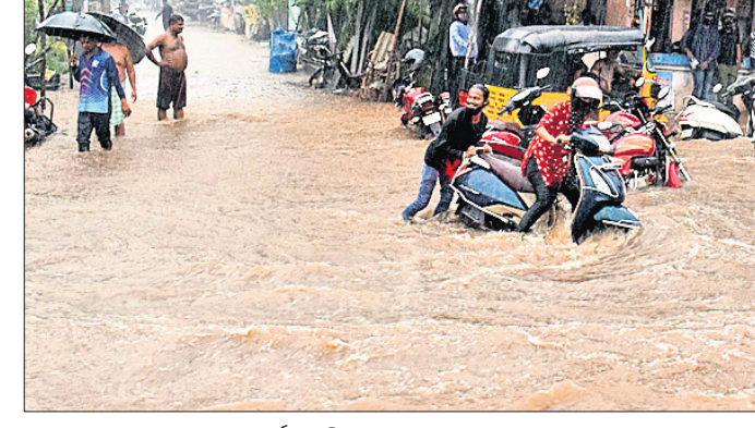
ଶାସ୍ତ୍ରୀ ନଗର ଛକ ରାସ୍ତାରେ ବର୍ଷା ପାଣିର ସୁଅ।

ରହିଗଲେ। ବର୍ଷା ଚାଣ୍ଡବ ସାମାନ୍ୟ ହୁଏ ପାଇବା ପରେ ନିଜେ ନିଜର ଗଡ଼ବ୍ୟ ସ୍ଥଳକୁ ଯିବାକୁ ଉଦ୍ୟମ କରିଥିଲେ। ମାତ୍ର ରାସ୍ତାରେ ଜମି ରହିଥିବା ଅଣ୍ଟାଏ ଲେଖା ପାଣି ଆଉ କିଛି ସମୟ ଅପେକ୍ଷା କରିବାକୁ ଲୋକମାନଙ୍କୁ ବାଧ୍ୟ କରିଥିଲା। ଡ୍ରେନ୍ ଅବ୍ୟବସ୍ଥା ସାଙ୍ଗକୁ ଜଳସ୍ରୋତ ଅବରୋଧ ଯୋଗୁ ସହରରେ ଏକ କୁଟ୍ରିମ ବନ୍ୟା ପରିସ୍ଥିତି ସୃଷ୍ଟି ହୋଇଥିଲା। ଲଘୁଚାପରେ ସାହି, ଆଚାର୍ଯ୍ୟ ବିହାର, ଜୟଦେବ ବିହାର, ରମ୍ଭାଗଡ଼, ବନିଖାଲ, କଳ୍ପନା ଛକ, ଶିରିପୁର, ବରପୁଣ୍ଡା, ଗଣପୁଣ୍ଡା, ପଥରବନ୍ଧ, ମହିଷାଖାଲ, ଲକ୍ଷ୍ମୀପାହାର, ନିଗମାନନ୍ଦ ନଗର, ସତ୍ୟବିହାର, ଜଗନ୍ନାଥ ବସ୍ଟି, ଚନ୍ଦ୍ରଶେଖରପୁର କୋଅପରେଟିଭ କଲୋନୀ, କୋଟିଳାଖାଲ ହାଟ ସମ୍ମୁଖରେ ଅଣ୍ଟା ଯାଏ ପାଣି ବୁଡ଼ି ଚାଲିଥିଲା। ଭୁବନେଶ୍ୱର ଆଞ୍ଚଳିକ ପାଣିପାଗ କାର୍ଯ୍ୟାଳୟ ପକ୍ଷରୁ ମିଳିଥିବା ସୂଚନା ଅନୁଯାୟୀ ଭୁବନେଶ୍ୱରରେ ୭୭ ମିଲିମିଟର ବର୍ଷା ହୋଇଥିବା ବେଳେ କଟକରେ ୩୭ ମିଲିମିଟର ବର୍ଷା ହୋଇଛି। ଯଦି ଏହି ବର୍ଷାରେ ସହର ଅଧିକ ଏଭଳି