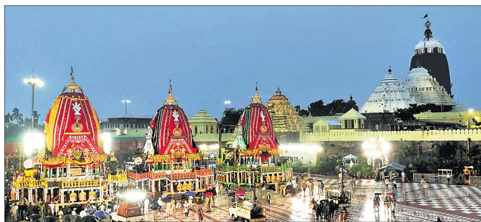
ଶ୍ରୀମନ୍ଦିର ବିହରୀର ସମ୍ମୁଖରେ ମଙ୍ଗଳବାର ପହଞ୍ଚିଥିବା ତିନି ରଥ।