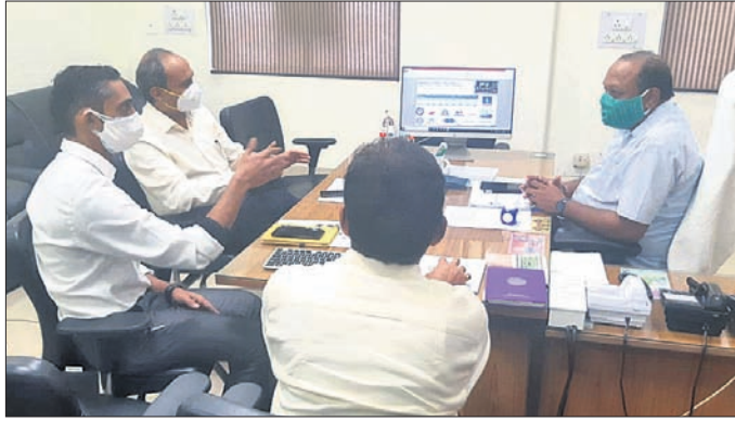
ଦକ୍ଷତା ବିକାଶ ଓ ବୈଷୟିକ ଶିକ୍ଷା ମନ୍ତ୍ରୀ ପ୍ରୋମୋନସ ନାୟକ ସମାକ୍ଷା କରୁଛନ୍ତି ।

ଦକ୍ଷତା ବିକାଶ ଓ ବୈଷୟିକ ଶିକ୍ଷା ମନ୍ତ୍ରୀ ପ୍ରୋମୋନସ ନାୟକ ସମାକ୍ଷା କରୁଛନ୍ତି । ସାମିଲ କରାଯିବା ଉଚିତ । ଏହାଦ୍ୱାରା ଏକ ବିକଶିତ ସମାଜ ଗଠନ ସମ୍ଭବ ହୋଇପାରିବ ବୋଲି ମନ୍ତ୍ରୀ ପ୍ରକାଶ କରିଛନ୍ତି । ଏହି ଅବସରରେ ଦକ୍ଷତା ବିକାଶ ଓ ବୈଷୟିକ ଶିକ୍ଷା ବିଭାଗର