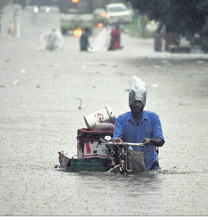
ଭୁବନେଶ୍ୱରରେ ମଙ୍ଗଳବାର ଅପରାହ୍ନରେ ହୋଇଥିବା ବର୍ଷାରେ ଲଘୁଚାପର ସମ୍ମୁଖୀନ ରାସ୍ତାରେ ବସ୍ ଓ କାରଗୁଡ଼ିକ ଅଧା ବୁଡ଼ିଯାଇଛି। ଜଣେ ବ୍ୟକ୍ତି ଗୁଲିରେ ଜିନିଷପତ୍ର ଧରି ଅଣ୍ଟା ଧରି ପାଣିରେ ପଶି ଯାଉଛନ୍ତି।