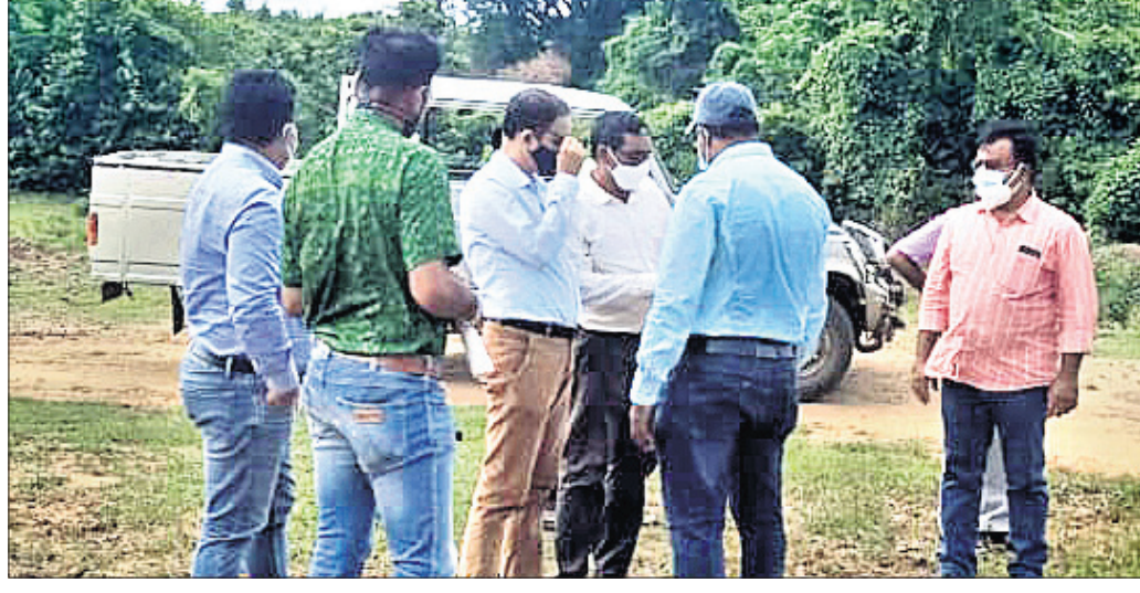
ଓଡ଼ିଶା ଅଧିକାରୀମାନେ ଆନ୍ଧ୍ର ଲଞ୍ଜିନିୟରଙ୍କ ସହ ଆଲୋଚନା କରୁଛନ୍ତି ।

ରାୟଗଡ଼ା ବ୍ଲକ ବିରୋଗୀ ହଲ୍ ଆ ପଞ୍ଚାୟତ ସାନଲାକୃତି ଗାଁ ନାଳରେ ଅର୍ଦ୍ଧନିର୍ମିତ ପୋଲକୁ ପୁନଃ ନିର୍ମାଣ କରିବାକୁ ଆନ୍ଧ୍ର ଅନୁମତି ମାଗିଥିଲା । କିନ୍ତୁ ରାୟଗଡ଼ା ପ୍ରଶାସନ ସେମାନଙ୍କୁ ମନା କରିଦେଇଛି । କିଛି ଦିନ ପୂର୍ବରୁ ଉପରୋକ୍ତ ଗାଁ ନାଳରେ ଏକ ସରକାରୀ ପୋଲ ନିର୍ମାଣ ପ୍ରକଳ୍ପର ଉଦ୍ଦେଶ୍ୟରେ ଏକ ସମାବେଶ ଯୋଜନା କରାଯାଇଥିଲା । ଏଥିରେ ପ୍ରଶାସନିକ ଅଧିକାରୀଙ୍କ ସହିତ ଗ୍ରାମବାସୀଙ୍କ ମଧ୍ୟ ଉପସ୍ଥିତି ଥିଲା ।