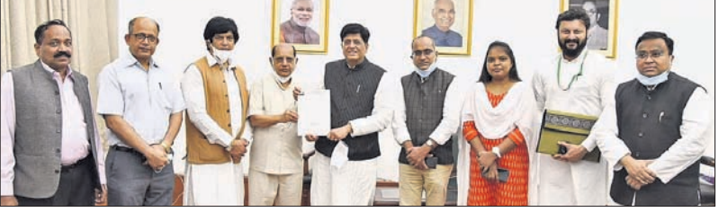
ବକେୟା ପୁଢ଼ ସର୍ବସିଦ୍ଧି ପ୍ରଦାନ ବାବେର ବିଜେଡି ଏମ୍‌ପିମାନେ ମଙ୍ଗଳବାର ଖାଉଟିବ୍ୟାପାର, ଖାଦ୍ୟ ଓ ସାଧାରଣ ବ୍ୟବସାୟ ମନ୍ତ୍ରୀ ପାଠ୍ଯକ୍ଷ ଗୋୟଲଙ୍କୁ ଭେଟୁଛନ୍ତି।

ଭୁବନେଶ୍ୱର, ୨୦୧୭(ବୁଧବେଳା) ଖାଦ୍ୟ ରିହାତି (ପୁଢ଼ ସର୍ବସିଦ୍ଧି) ୨୦୮୧ କୋଟି ଟଙ୍କା ରୁରତ ଦେବାକୁ ବିଜେଡି ଏମ୍‌ପିମାନଙ୍କୁ ମଙ୍ଗଳବାର ଖାଉଟି ବ୍ୟାପାର, ଖାଦ୍ୟ ଓ ସାଧାରଣ ବ୍ୟବସାୟ ମନ୍ତ୍ରୀ ପାଠ୍ଯକ୍ଷ ଗୋୟଲଙ୍କୁ ଭେଟି ଦାବି କରାଯାଇଛି। ଏ ନେଇ ଏକ ସମ୍ବନ୍ଧୀୟ ମନ୍ତ୍ରାଳୟ ଏକ ସ୍ମାରକପତ୍ର ପ୍ରଦାନ କରାଯାଇଛି। ଏଥିରେ ଦର୍ଶାଯାଇଛି ଯେ ତାଜକ ସଂଗ୍ରହ କରିବା କ୍ଷେତ୍ରରେ ରାଜ୍ୟ ସରକାରଙ୍କ ଉପରେ କୌଣସି ଆର୍ଥିକ ବୋଧ ରହିବା କଥା ନୁହେଁ। ରାଜ୍ୟ ତାଜକ ସଂଗ୍ରହକାରୀ ସଂସ୍ଥା ଅତିରିକ୍ତ ଟଙ୍କାର ୩ ମାସିଆ ସର୍ବସିଦ୍ଧି ପ୍ରଦାନ କରିବ। ମାତ୍ର ଓଡ଼ିଶାକୁ ଅତିରିକ୍ତ ରିହାତି ଅର୍ଥ ପ୍ରଦାନ କରାଯାଉ ନ ଥିବା ସ୍ମାରକପତ୍ରରେ ଉଲ୍ଲେଖ କରାଯାଇଛି। ଓଡ଼ିଶା ରାଜ୍ୟ ଯୋଗାଣ ନିଗମ ରାଜ୍ୟ ସରକାରଙ୍କ ଏକ ବୃହତ୍ ସଂଗ୍ରହକାରୀ ସଂସ୍ଥା। ଏହି ସଂସ୍ଥା ପ୍ରୋଜିକ୍ଟନାଲ ସର୍ବସିଦ୍ଧି ୫୩୭୫.୧୧ କୋଟି ଟଙ୍କା ଏବଂ ଆରୁଆ ସର୍ବସିଦ୍ଧି ୭୧୬.୩୪ କୋଟି ଟଙ୍କା ପାଇବାକୁ ରହିଛି। ସର୍ବସିଦ୍ଧି ଅର୍ଥ ଦେବାବେଳେ ବିଲ୍ଡି କାରଣରୁ ଏହାର ଅତିରିକ୍ତ ସୁଧ ବାବଦରେ ୪୮୮୩.୫୫ କୋଟି ଟଙ୍କା ମଧ୍ୟ କେନ୍ଦ୍ର ସରକାର ଦେବାକୁ ବାକି ରହିଛି। ଏଥିସହ ବିଜେଡି ଏମ୍‌ପିମାନେ ରାଜ୍ୟକୁ ଅଧିକ ତାଜକ ଉଠାଇବା ପାଇଁ ଉଦ୍ଦେଶ୍ୟ ରଖିଛନ୍ତି।