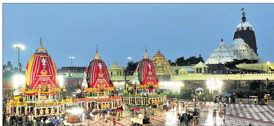
ଶ୍ରୀମନ୍ଦିର ବିହରୀ ସମ୍ମୁଖରେ ମଙ୍ଗଳବାର ପହଞ୍ଚିଥିବା ତିନି ରଥ।