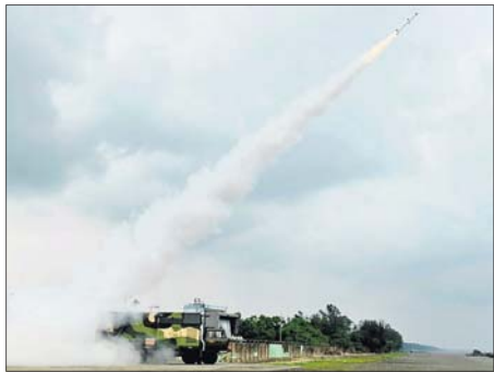
ଆକାଶ ଷ୍ଟେସନାସ୍ତ୍ର ପରୀକ୍ଷା କେନ୍ଦ୍ରରେ ଚାନ୍ଦିପୁର ଷ୍ଟେସନାସ୍ତ୍ର ପରୀକ୍ଷା କେନ୍ଦ୍ରରେ ଶୁଣା (ଏନଜି)ର ଉପସ୍ଥାପନା କରାଯାଇଛି।

ବାଲେଶ୍ୱର ଜିଲ୍ଲା ଚାନ୍ଦିପୁର ଷ୍ଟେସନାସ୍ତ୍ର ପରୀକ୍ଷା କେନ୍ଦ୍ରର ୩୩୯... ଲକ୍ଷ୍ୟପାଠକୁ ଶୁକ୍ରବାର ପୂର୍ବାହ୍ନ ୧୧ଟା ୫୬ ମିନିଟ୍ରେ ଆକାଶ ଷ୍ଟେସନାସ୍ତ୍ର ଘୁଷୁ କେନ୍ଦ୍ରରେ ଶୁଣା (ଏନଜି)ର ଉପସ୍ଥାପନା କରାଯାଇଛି।