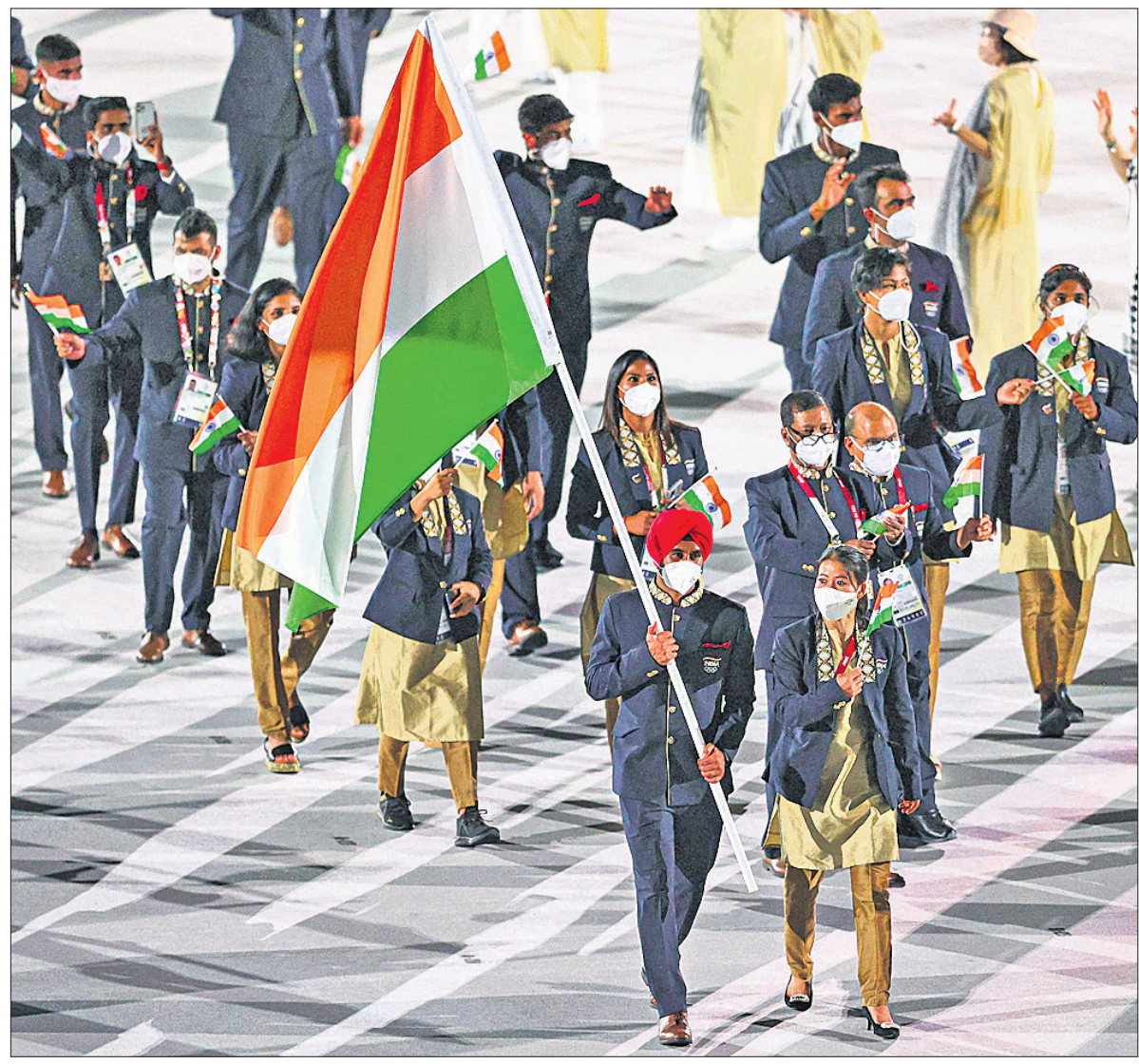
ଟୋକିଓର ନ୍ୟାଶନାଲ ଷ୍ଟାଡ଼ିୟମରେ ଅଲିମ୍ପିକ୍ ଉଦ୍‌ଘାଟନା ସମାରୋହରେ ଭାରତୀୟ ଦଳର ମାର୍ଚ୍ଚପାଣ୍ଠୀ