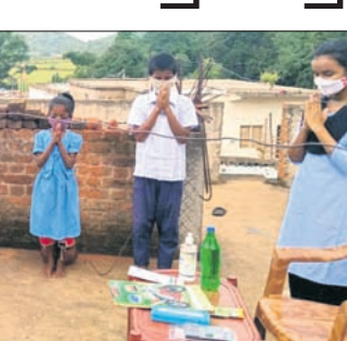
ବିକଳ ଶିକ୍ଷାଦାନ କାର୍ଯ୍ୟକ୍ରମରେ ଛାତ୍ରାଛାତ୍ରୀଙ୍କୁ ଶିକ୍ଷା ଗ୍ରହଣ