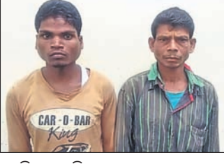
ସେହି କାରୁକର୍ମରେ ଯୋଗଦାନ କରିଥିବା ମାଓବାଦୀ ଗିରଫ

ମାଲକାନଗିରି ଜିଲ୍ଲା ସୀମାନ୍ତରୁ ୨ ମାଓବାଦୀ ଗିରଫ କରାଯାଇଛି