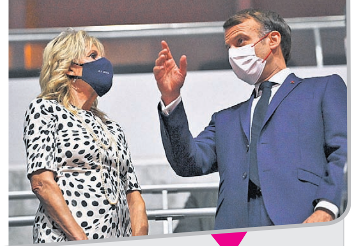
ଆମେରିକାର ପ୍ରଥମ ମହିଳା ଜିଲ ବାଇଡେନ ପ୍ରାୟ ରାଷ୍ଟ୍ରପତି ଜମାଦ୍ୱେଲ ମାକ୍‌ରୌଙ୍କ ସହ ଆଲୋଚନାଚାରତ ।