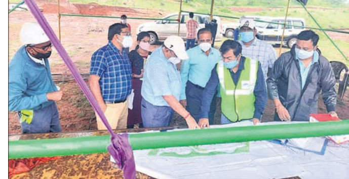
ଅଧ୍ୟାପନା ହସ୍ତିଚାଳ ନିର୍ମାଣ କାର୍ଯ୍ୟ ତଦାରଖ କରୁଥିବା ମୁଖ୍ୟମନ୍ତ୍ରୀ

କୋରାପୁଟରୁ ଶହାଦ ଲକ୍ଷ୍ମଣ ନାୟକ ନେତୃତ୍ୱରେ ଗୋଟିଏ ଦଳ