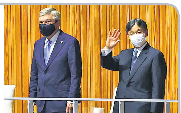
ଅନ୍ତର୍ଜାତୀୟ ଅଲିମ୍ପିକ୍ କମିଟି ସଭାପତି ଥୋମାସ ବାକ୍ସ ସହ ଜାପାନ ସମ୍ରାଟ ନାରୁହିତୋ ।