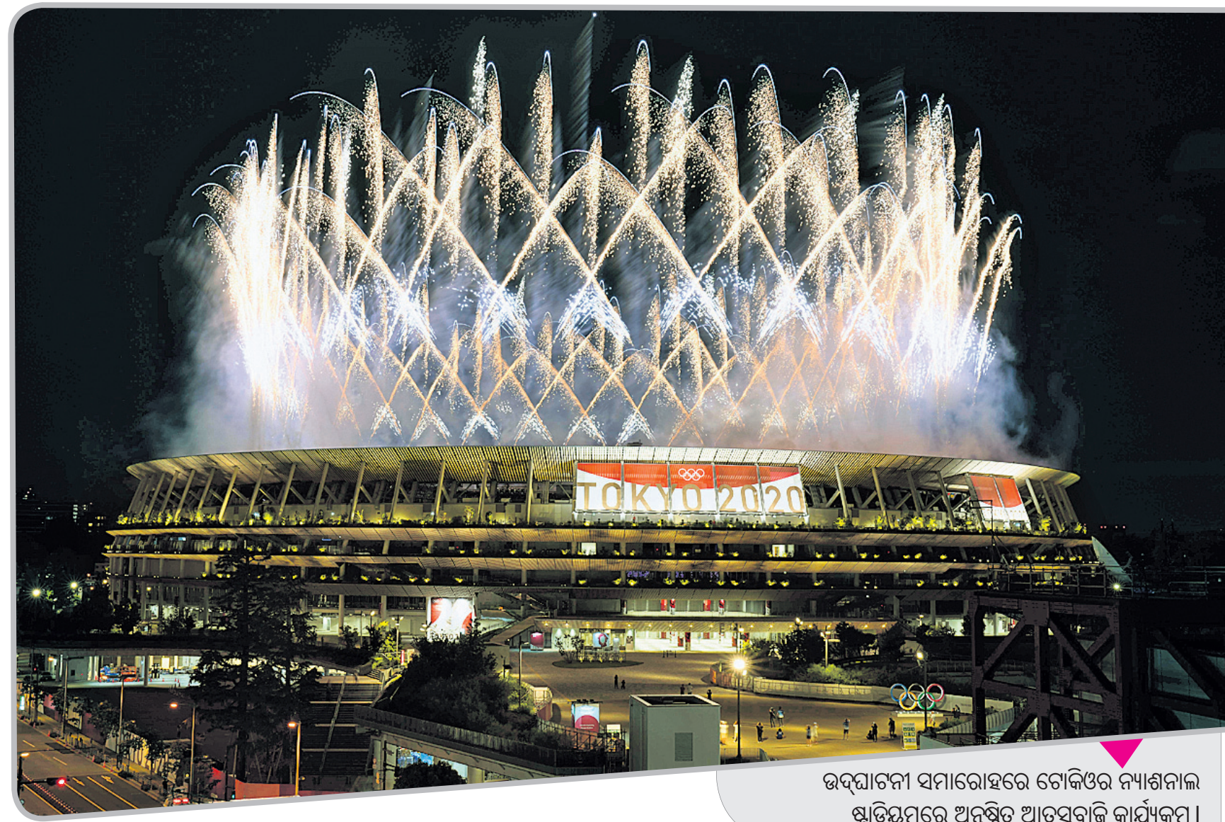
ଉଦ୍‌ଘାଟନୀ ସମାରୋହରେ ଟୋକିଓର ନ୍ୟାଶନାଲ ଷ୍ଟାଡ଼ିୟମରେ ଅନୁଷ୍ଠିତ ଆତସବାଜି କାର୍ଯ୍ୟକ୍ରମ ।