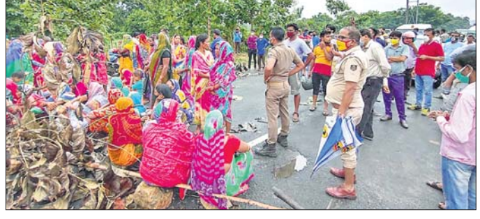
ଭବ୍ୟ ଗ୍ରାମବାସୀ ଅନୁଗୋଳ-ଆଠଗଡ଼ ରାସ୍ତା ଅବରୋଧ କରିଛନ୍ତି।