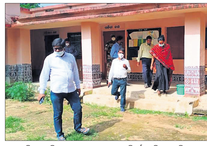
ବରଗଡ଼ ଜିଲ୍ଲାପାଳ ବିଜେପୁର ସରକାରୀ ହାଇସ୍କୁଲ ପରିଦର୍ଶନ କରି ଫେରୁଛନ୍ତି ।