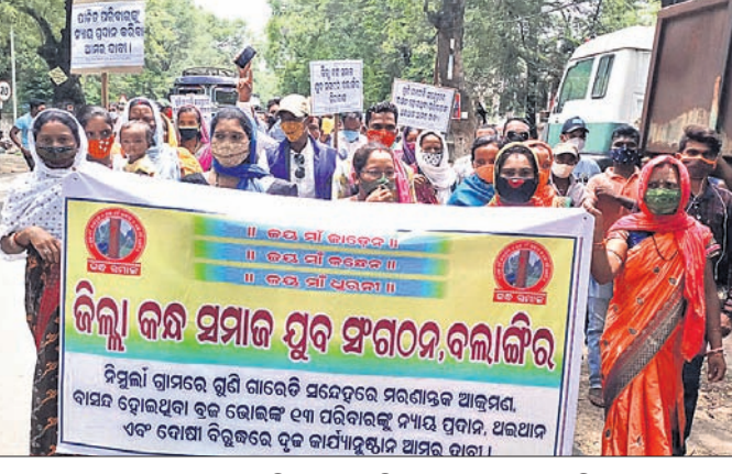
କନ୍ଧ ସମାଜ ଯୁବ ସଙ୍ଗଠନ ପକ୍ଷରୁ ଜିଲ୍ଲାପାଳ ଅର୍ପିତ ଘେରାଇ କରାଯାଇଛି ।

ବଲାଙ୍ଗୀର ଜିଲ୍ଲା ସିଦ୍ଧକେଳା ଥାନା ଅନ୍ତର୍ଗତ ନିମୁଲି ଗାଁରେ ଗୁଣିଗାରେଡ଼ି ସନ୍ଦେହରେ ବାସନ୍ଦ ପରିବାରକୁ ନ୍ୟାୟ ଏବଂ ଅଭିଯୁକ୍ତଙ୍କ ଗିରଫ ଦାବିରେ ଜିଲ୍ଲା କନ୍ଧ ସମାଜ ଯୁବ ସଙ୍ଗଠନ ପକ୍ଷରୁ ଶନିବାର ଜିଲ୍ଲାପାଳ ଅର୍ପିତ ଘେରାଇ କରାଯାଇଥିଲା । ଏହି ଘଟଣାରେ ସିଦ୍ଧକେଳା ପୋଲିସ୍ ଅଭିଯୁକ୍ତଙ୍କ ବିରୋଧରେ କୌଣସି କାର୍ଯ୍ୟାନୁଷ୍ଠାନ ଗ୍ରହଣ କରିନାହିଁ । ପାତକ ପରିବାର ସଦସ୍ୟମାନେ ଘଟଣାକୁ ଦୈନିକ ଚିଟିକାଗତ ଏସଡିପିଓ ଏବଂ ଏସପିକୁ ସାକ୍ଷାତ କରିଥିଲେ ମଧ୍ୟ ସୁପ୍ରିମ ମିଳିନାହିଁ । ଏହାର ପ୍ରତିବାଦରେ ଜିଲ୍ଲା କନ୍ଧ ସମାଜ ଯୁବ ସଙ୍ଗଠନ ପକ୍ଷରୁ ଜିଲ୍ଲାପାଳ ଅର୍ପିତ ଘେରାଇ କରାଯାଇଥିଲା । ବିଶେଷକାରୀ ପୋଲିସ୍ ପ୍ରଶାସନ ବିରୋଧରେ ନାରାବାଜି କରିଥିଲେ । କନ୍ଧ ସମାଜ ଯୁବ ସଙ୍ଗଠନ ପକ୍ଷରୁ କୁହାଯାଇଛି ଯେ, ବଲାଙ୍ଗୀର ଜିଲ୍ଲାରେ ଗୁଣିଗାରେଡ଼ି, ଅଧିକାଂସକ୍ତ ନେଇ ଅନେକ ଗଣଗୋଳ ଓ ଅମାନୁଷିକ ଘଟଣା ଘଟୁଛି । ତେବେ